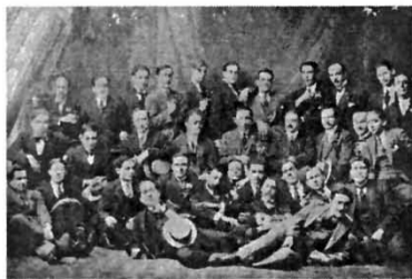
José Carlos Mariátegui, en fila central, sentado, segundo desde la izquierda. A su lado derecho, César Falcón, con un grupo de escritores y actores de teatro, 1916.

El punto de vista en el cuento El punto de vista desde la perspectiva de la estructura interna Las técnicas narrativas Las técnicas narrativas más usuales en el cuento contemporáneo.