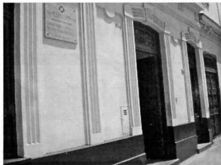
Fachada del Museo