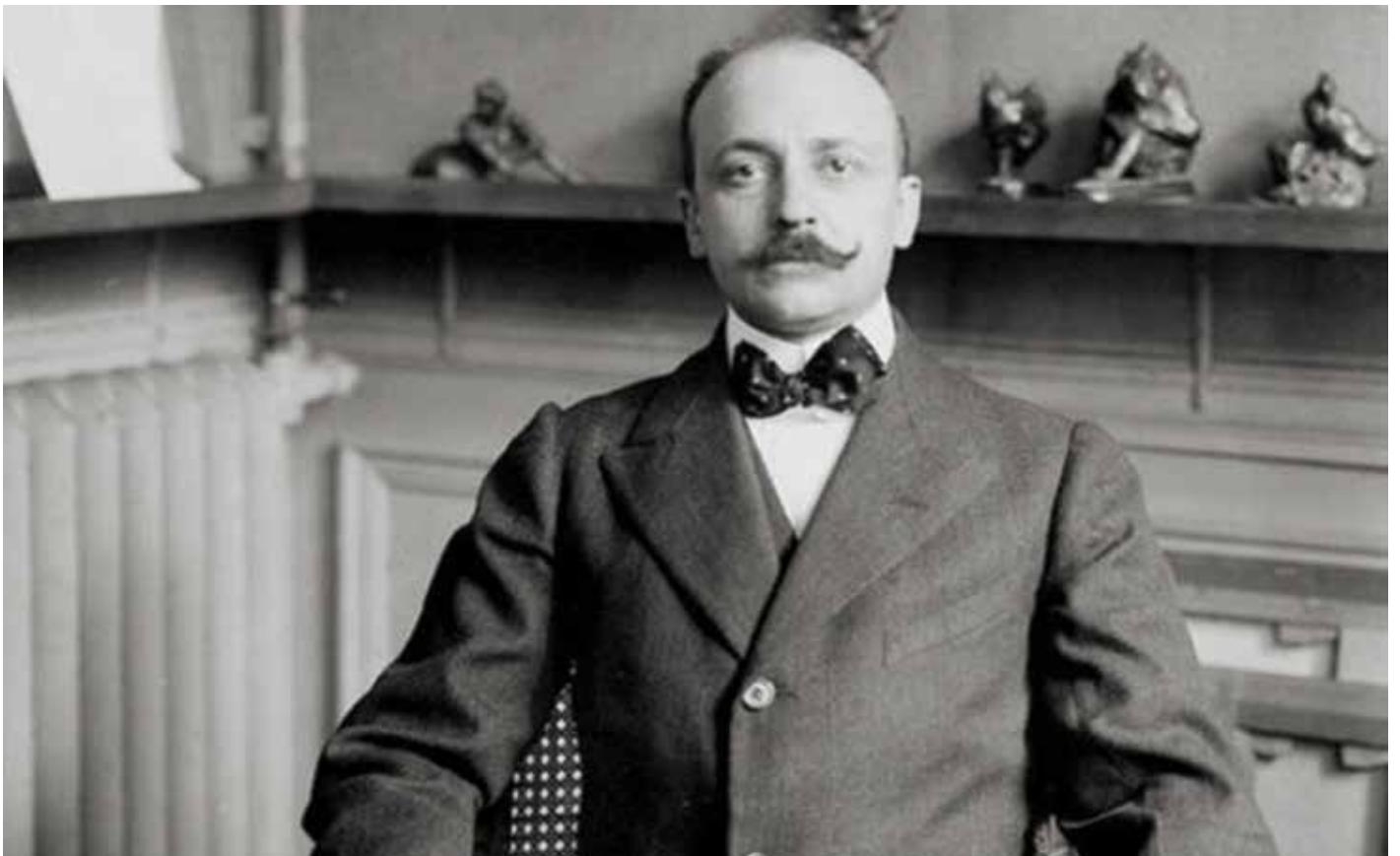
Filippo Tommaso Marinetti (1876-1944)

Sin embargo, José Carlos Mariátegui, siguió de cerca todos los acontecimientos vanguardistas. Es por esa razón que pudo decir: "Hace quince años del bautismo del futurismo. En febrero de 1909, Marinetti y otros artistas suscribieron y publicaron en París el primer manifiesto futurista. El futurismo aspiraba a ser un movimiento internacional. Nació, por eso, en París. Pero estaba destinado a adquirir, poco a poco una fisonomía y una esencia fundamentalmente italianas. Su duce, su animador, su caudillo, era un artista de temperamento italianísimo: