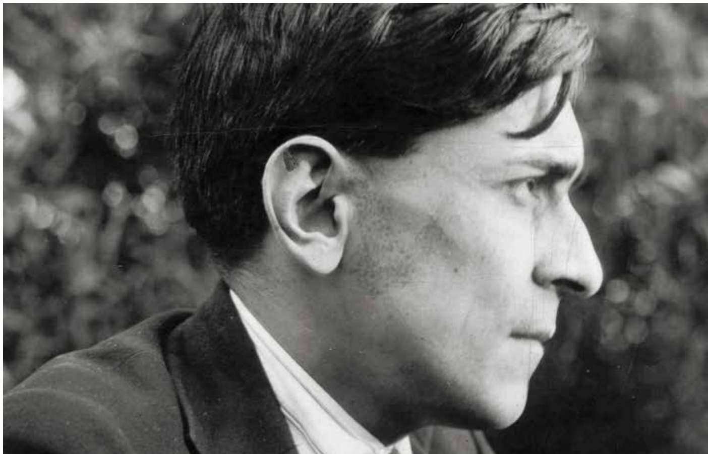
José Carlos Mariátegui.

El gran reto del pensamiento latinoamericano ha sido, y continúa siendo, su capacidad para explicar nuestra realidad desde una perspectiva original y creadora, que no se limite a la reiterada importación de modelos teóricos exógenos, como ha sido frecuente en el curso de la historia de América Latina. Tal reto no se limita a superar la adopción de modelos políticos y económicos de marca liberal-occidental; para el caso que nos atañe, es necesario afirmar que ni el marxismo (en tanto pensamiento crítico que puso de manifiesto las contradicciones inherentes al modo de producción capitalista y advirtió del carácter transitorio de éste), podía ser aplicado a rajatabla en la realidad latinoamericana. En ese tenor se inscriben las aportaciones de José Carlos Mariátegui al Pensamiento Latinoamericano.