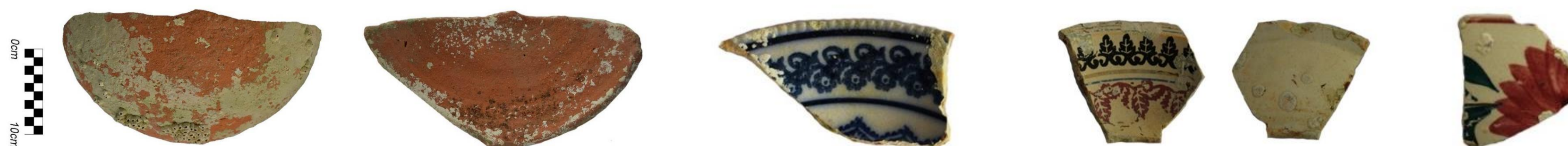
Materiales recuperados durante la prospección y elaboración del diagnóstico del área subacuática

La dispersión de materiales culturales, pudo generarse por el acarreo de objetos desde la superficie de la isla principal. Estos fragmentos pueden constituir desechos de los implementos utilizados por los trabajadores de la explotación guanera en las islas.