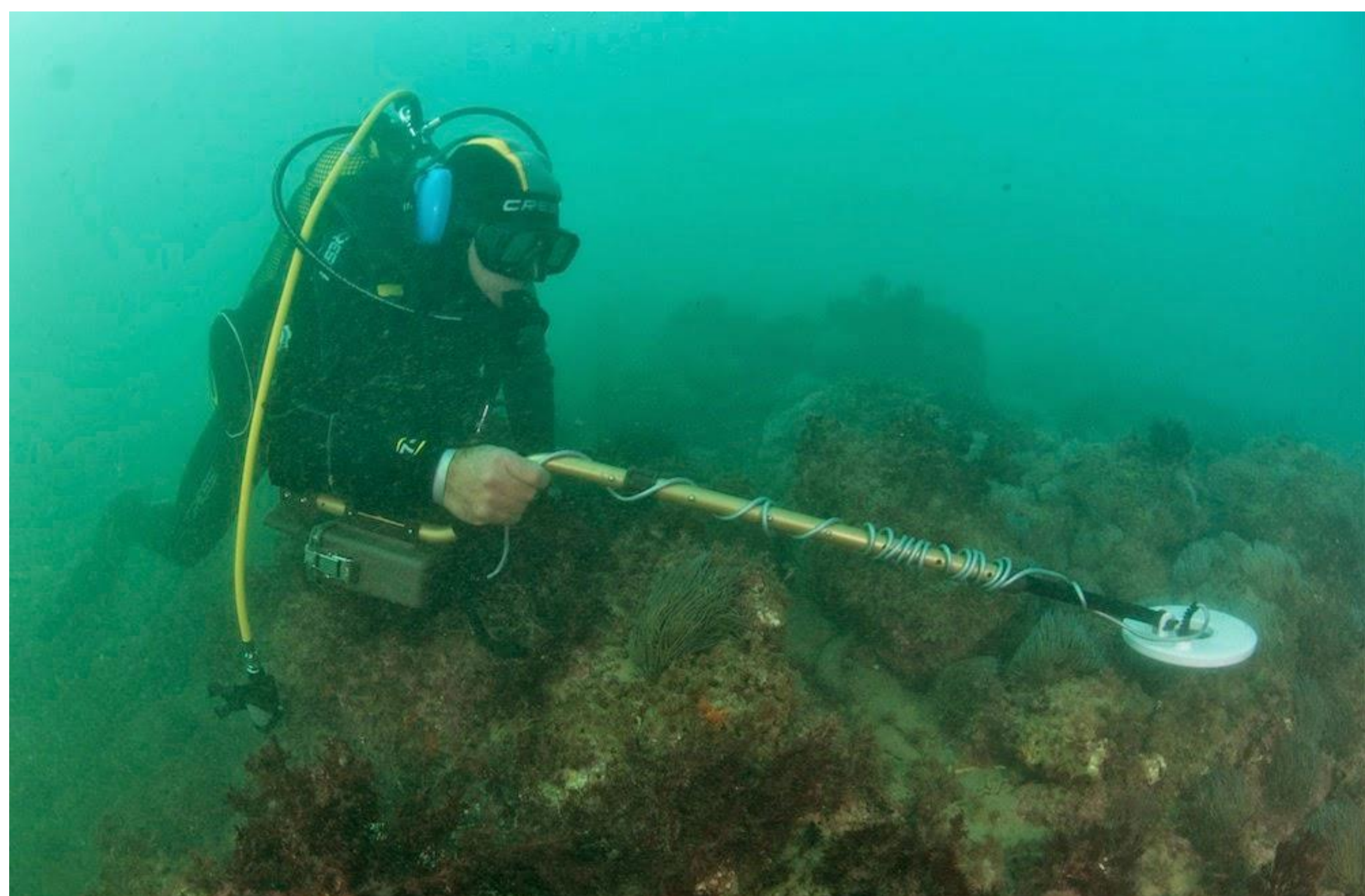
Prospección subacuática con detector de metales