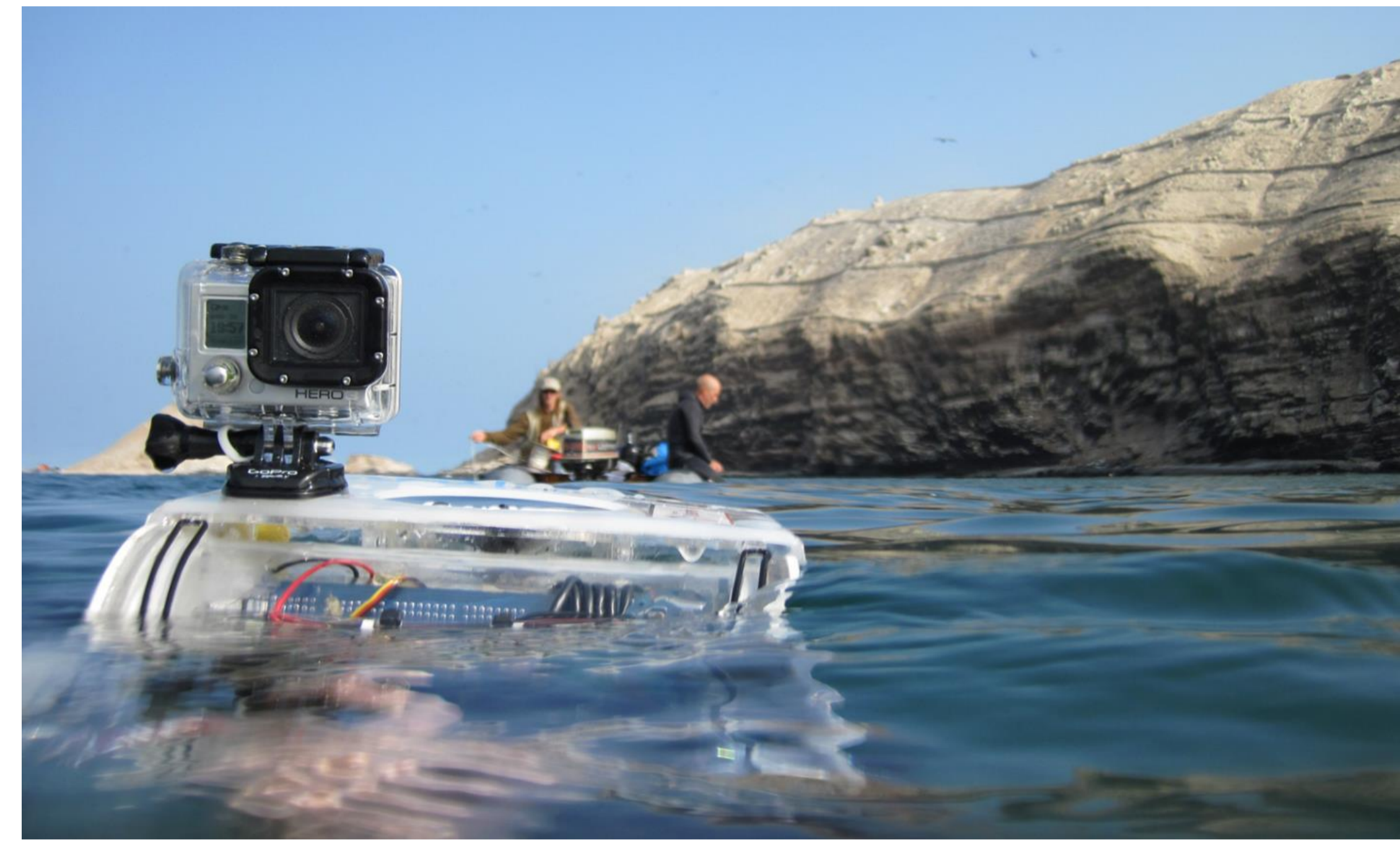
Vehículo de operación remota (ROV) instrumento de apoyo en prospección y registro subacuático

El Proyecto de Investigación Arqueológica Islas de Pachacamac contribuye a la formación de profesionales en arqueología subacuática y en la aplicación de métodos, técnicas y tecnologías vinculadas a la disciplina arqueológica y la práctica del submarinismo.