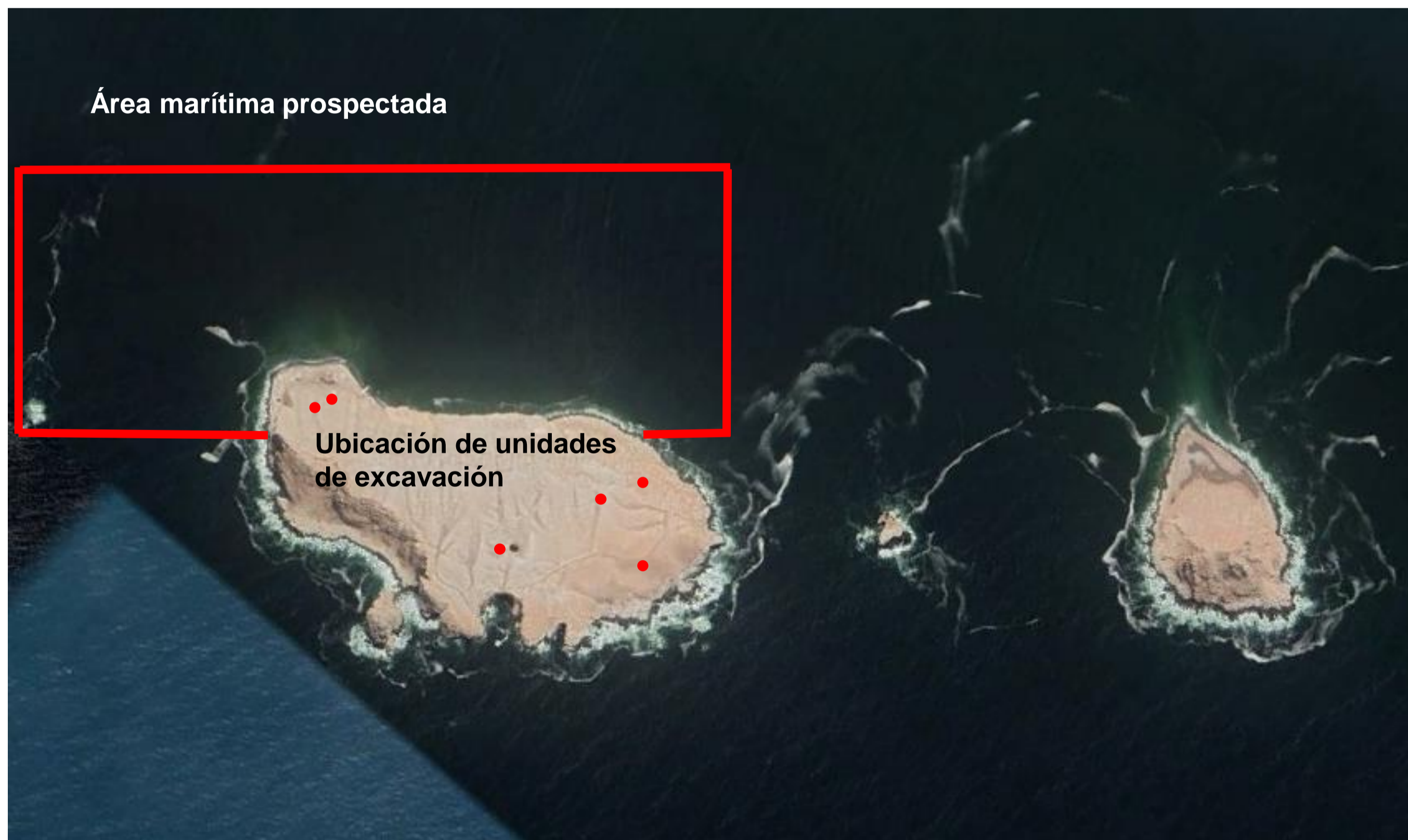
Áreas de prospección terrestre y subacuática. Ubicación de seis unidades de excavación

En el 2013 y 2014 se realizó la prospección y diagnóstico de los componentes terrestre y subacuático. El componente terrestre abarcó la superficie de la isla principal, se realizó una prospección sistemática intensiva, y excavamos seis unidades de cateo. El componente subacuático abarcó el área marítima, que se adentra 250m desde la orilla oeste de la isla principal, alcanzando 1300m de largo en dirección noroeste sureste, en un área de 260 000 m2. El reconocimiento del lecho marino permitió la identificación visual del terreno y el uso de tecnología aplicada, permitió georeferenciar cada uno de los elementos con valor patrimonial encontrados. La profundidad máxima alcanzada fue de 26m. Para completar nuestro trabajo, hemos realizado un registro fotográfico y filmico del área prospectada.