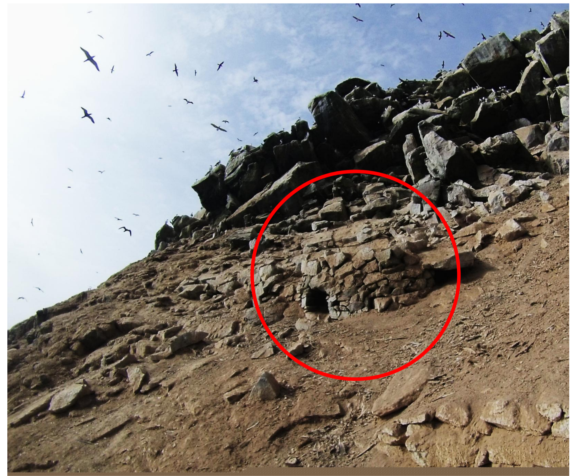
Probable estructura arquitectónica prehispánica