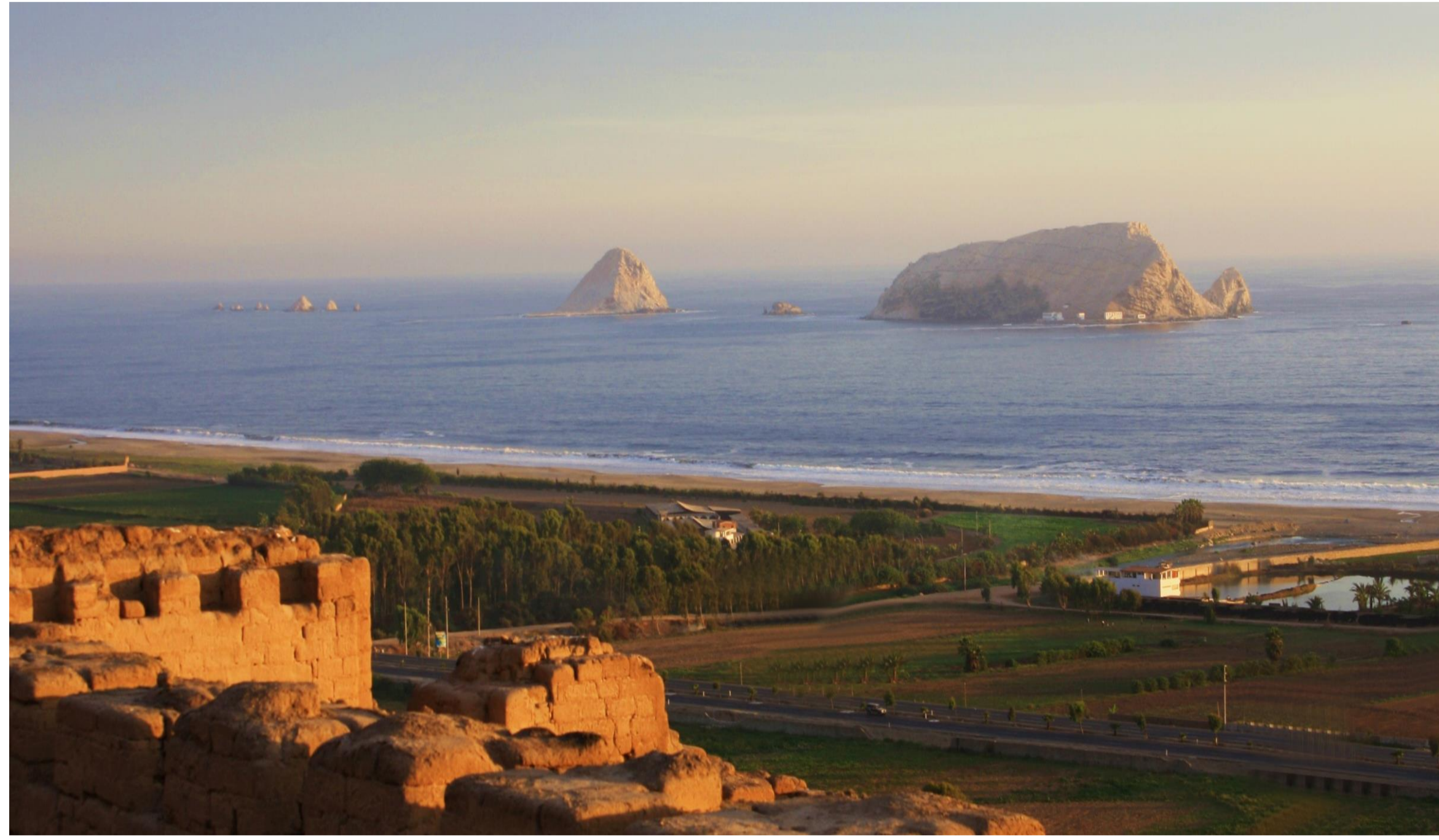
Sub zona del litoral marítimo y las Islas de Pachacamac desde el Templo del Sol

Al sur de Lima se ubica el santuario arqueológico de Pachacamac, con una extensión aproximada de 465 ha. y una historia de más de 1000 años, siendo el santuario más importante de la costa central del Perú. Frente a sus costas, la existencia de una isla y un islote son representación material de dos deidades Inca: Cavillaca y su hija, mencionadas en la leyenda de origen de las islas de Pachacamac.