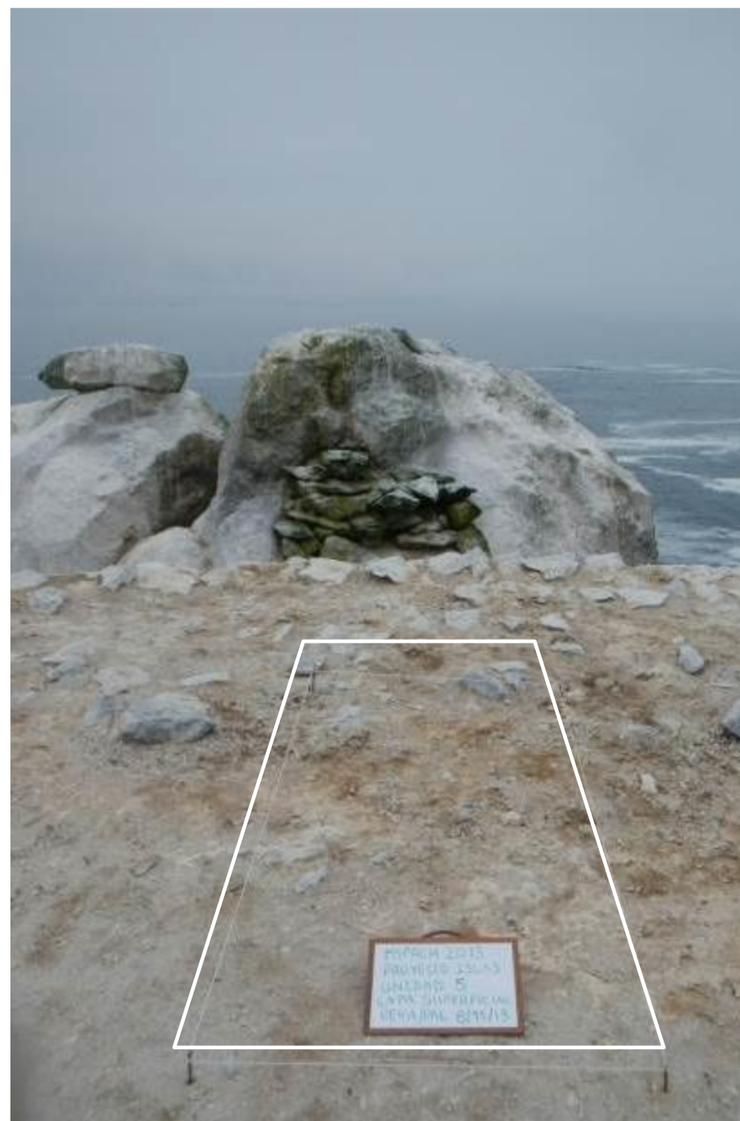
Unidad de excavación, ubicada en accidente geográfico relevante