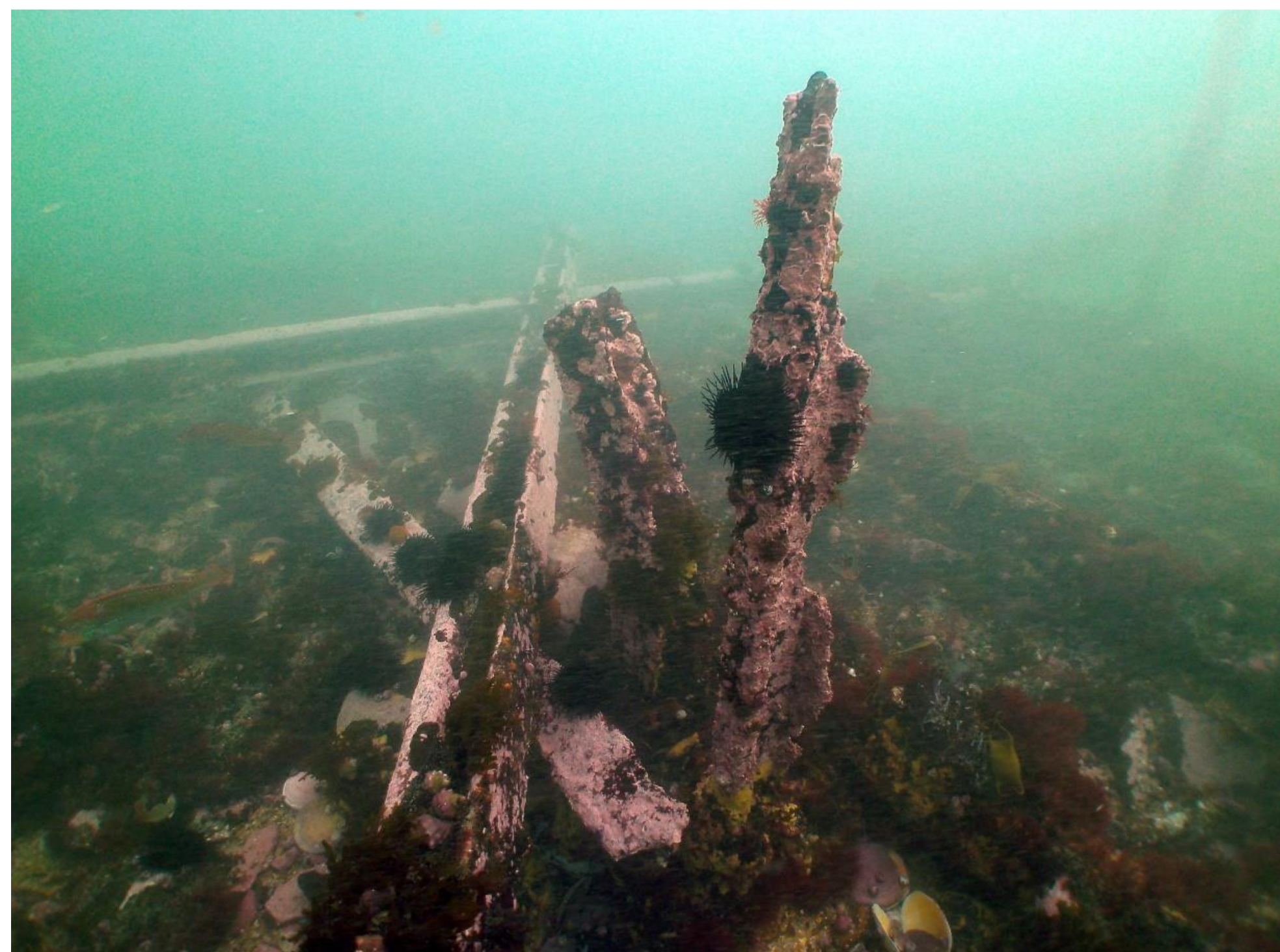
Estructura portuaria republicana colapsada ( muelle construido con rieles de tren).