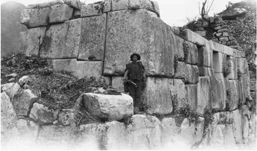
Figura 10. Melquiades Álvarez en el Templo de las Tres Ventanas, 1912.