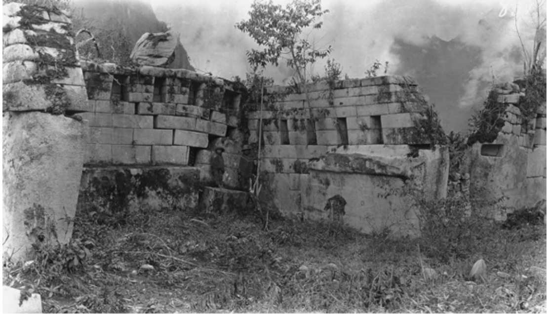
Figura 3. Templo Principal, setiembre de 1911.