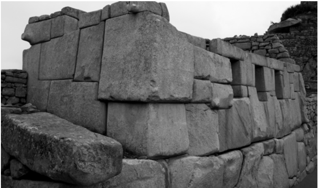
Figura 11. Templo de las Tres Ventanas, 2017.