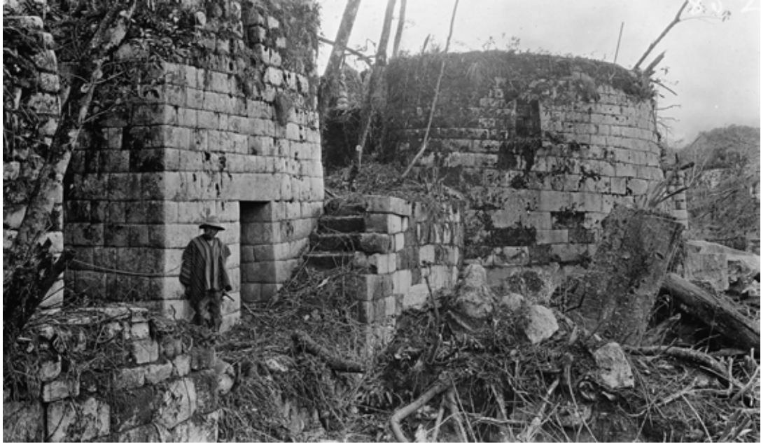
Figura 8. Conjunto del Templo del Sol, setiembre de 1911.