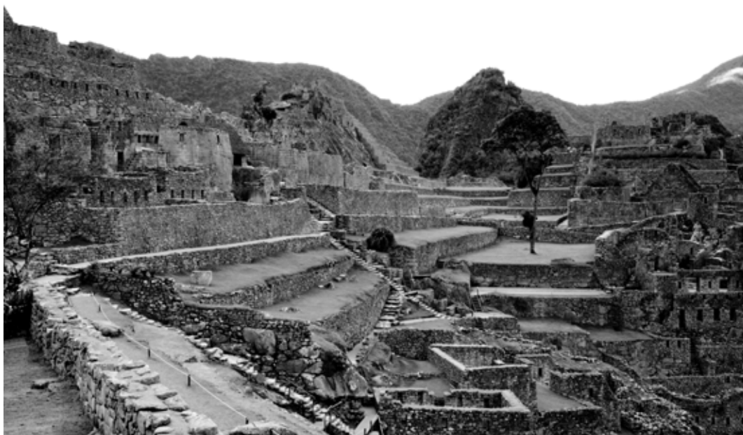
Figura 2. Vista general de Machupicchu, 2017.