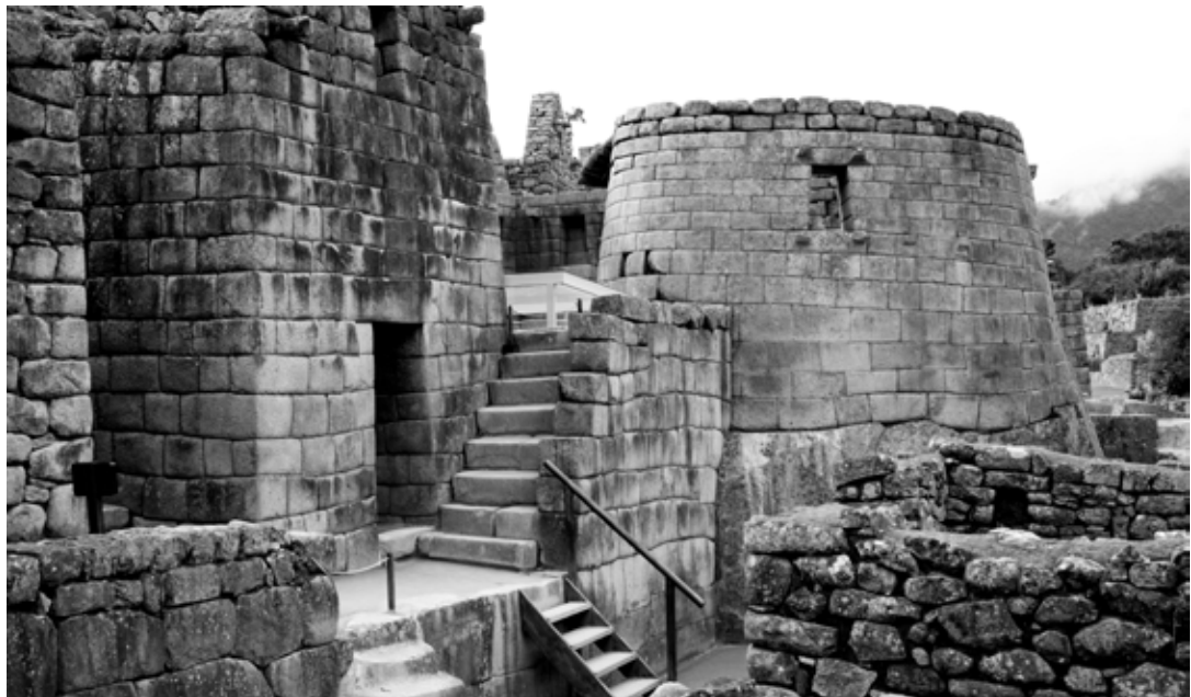
Figura 9. Conjunto del Templo del Sol, 2014.