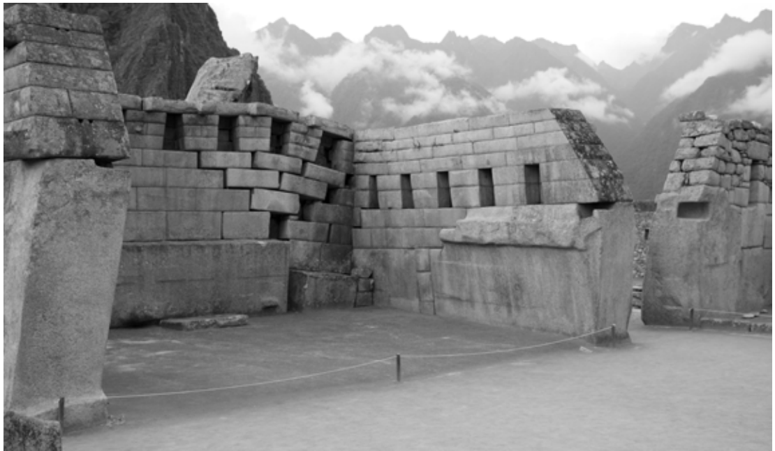
Figura 4. Templo Principal, 2013.