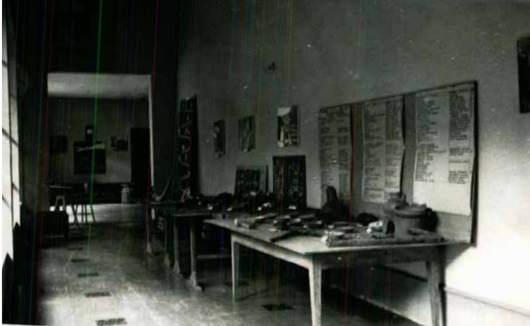
Figura 7. Museo de Sitio Manuel Chávez Ballón, una de las salas de exposición; 1975.

do de apropiación por admiración), que impone que las decisiones de restauración privilegien también un sentido elevado de estética en las intervenciones a nivel de manejo cromático y de texturas en revocos (cubiertas de muros y tratamientos de superficies en general). Otra correlación estaría vinculada al respeto a la condición excepcional del lugar como obra maestra de la humanidad y paisaje cultural prístino que ofrece como llaqta sagrada en relación con su marco geográfico. Este sentido de respeto impone la necesidad de un extremo minimalismo para todo tipo de equipamiento en el área monumental y demanda altísima calidad en la infraestructura de soporte periférico, como la que se plantea con el moderno centro de visitantes que se ubicará en las faldas de la montaña.