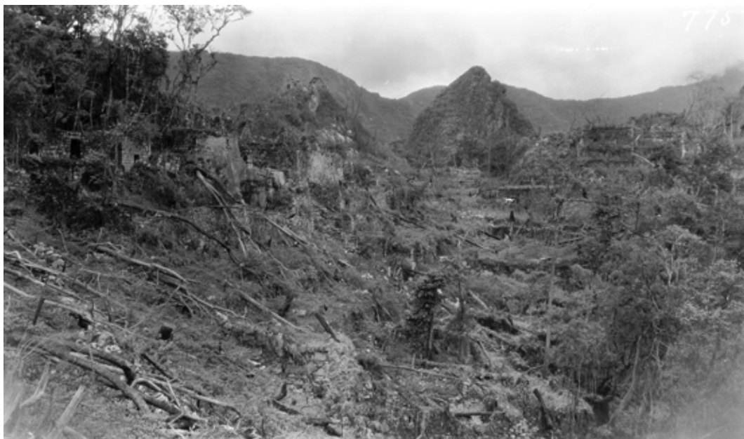
Figura 1. Vista general de Machupicchu. durante las labores de deforestación de la Expedición Peruana de Yale, setiembre de 1911.