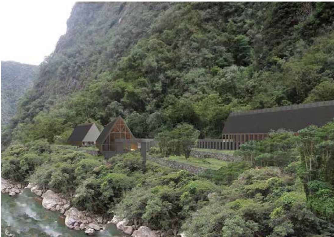
Figura 5. Proyección en 3D del futuro Centro de Visitantes de Machupicchu, que se construirá donde actualmente se ubica el Museo de Sitio Manuel Chávez Ballón y será el nuevo punto de ingreso a la llaqta.

Como síntesis de esta idea, todo parece indicar que la evocación de una “ciudad perdida” que el mundo redescubre siglos después es la opción más adecuada como “imagen objetivo” del proceso de restauración, pues sintetiza todas las etapas de su proceso histórico hasta su abandono a mediados del siglo XVI. E incluso esta es una opción con la capacidad de incorporar en su lectura final otras “pátinas del tiempo” complementarias, que corresponderían a los breves intervalos en los que la llaqta fue visitada (saqueada y deforestada) en tiempos de la Colonia y de la temprana República.