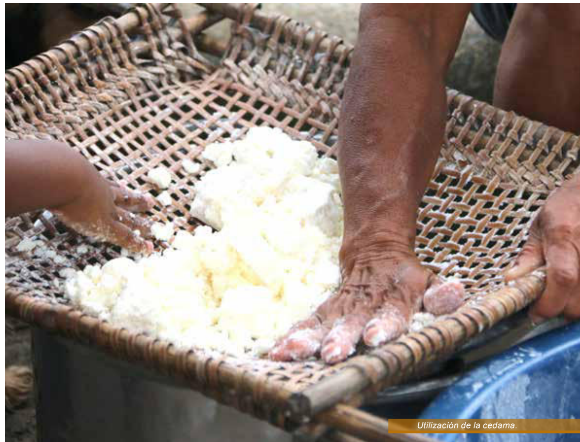
Utilización de la cedama.

Los tejidos ticuna son una muestra más de la excelencia de una cultura viva que lleva más de dos mil años asentada en los mismos territorios (Nimuendajú 1952; Bolian 1975; Goulard 1994; Gómez 2016; Núñez et al. 2018). Esta permanencia prolongada en el mismo espacio geográfico ha permitido al pueblo ticuna acumular conocimientos precisos sobre las dinámicas estacionales y las interacciones naturales existentes en su entorno. El tejido con las fibras del huarumá es una práctica que se inició hace miles