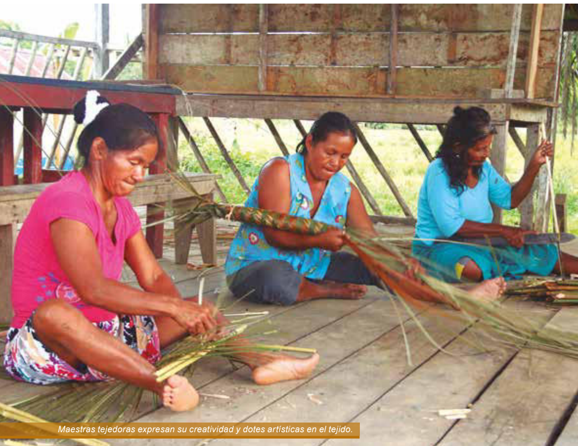
Maestras tejedoras expresan su creatividad y dotes artísticas en el tejido.