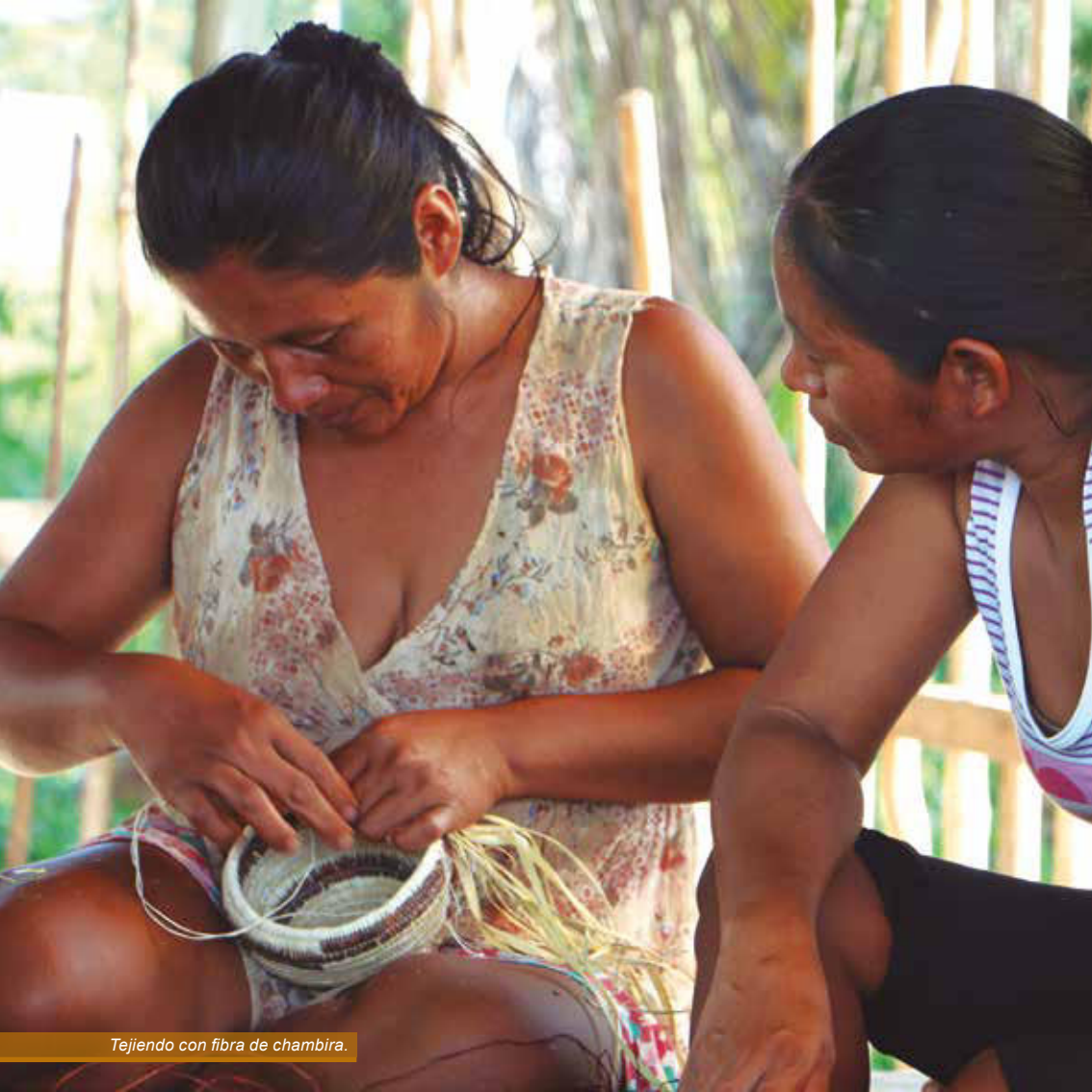
Tejiendo con fibra de chambira.

Y ahora comadre [risas] me olvidé qué decir. Y así de eso se elabora el tipití y este sirve para prensar la masa de la yuca para que se seca. Solamente se usaba tipití para secar la masa.