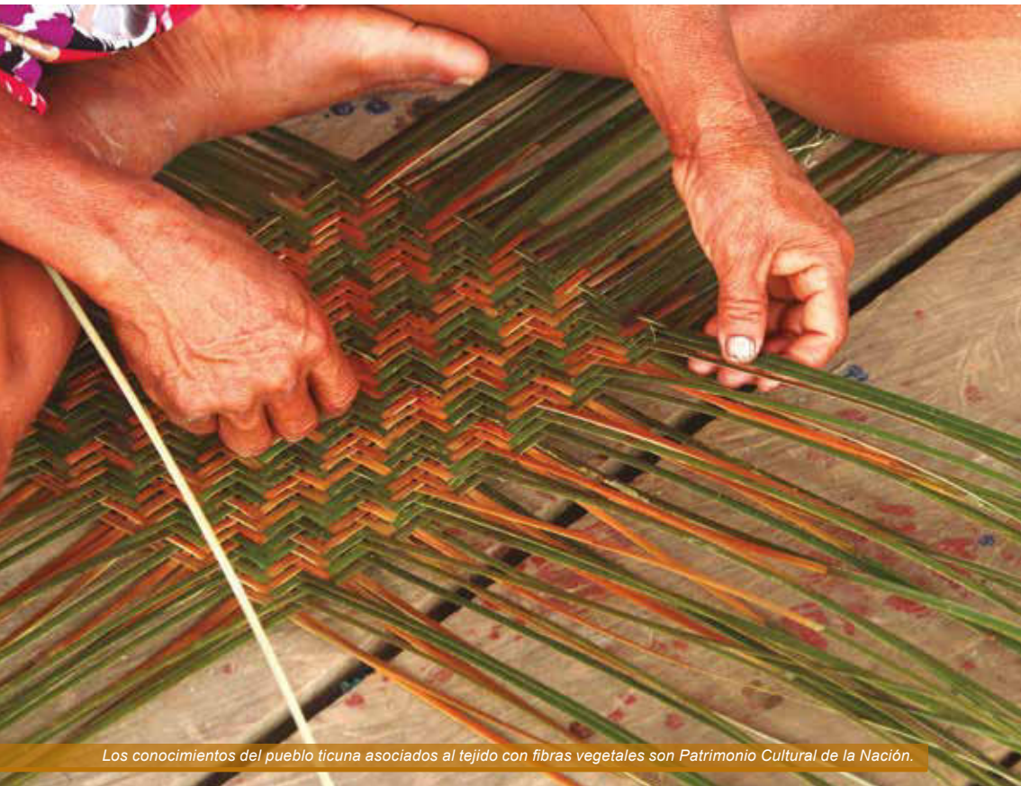
Los conocimientos del pueblo ticuna asociados al tejido con fibras vegetales son Patrimonio Cultural de la Nación.

por tanto, que su elaboración sea responsabilidad exclusiva de las mujeres, debido a la importante función que estas cumplen como gestoras de la soberanía alimentaria en el seno de la familia.