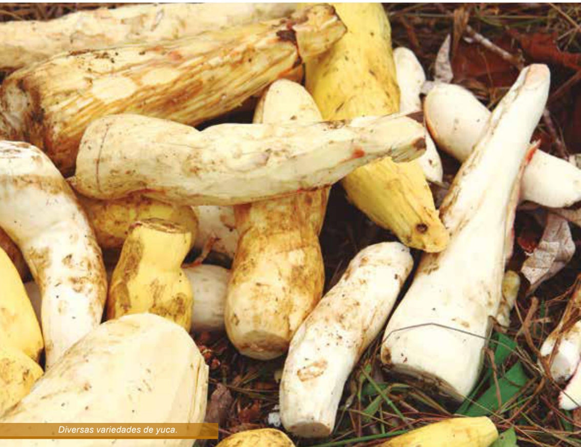
Diversas variedades de yuca.

Las hojas de yuca contienen proteínas y aminoácidos necesarios para la salud. Cock (1985: 43) señala que los valores proteínicos de las hojas de yuca están entre 20 % y 30 %. Giraldo (2006: 18) indica que “la composición nutricional del follaje de hoja de yuca varía en calidad y cantidad, según el tipo de cultivo, época de corte, densidad de siembra y proporción entre hojas (laminar foliar más peciolos) y tallos”. Señala que si solo se utiliza el laminar foliar, su contenido de proteínas puede ser entre 23 % y 28 %, pero incluyendo los peciolos y ramas, este se reduce al 18 %. Lastimosamente, los prejuicios civilizatorios generados por la llamada “modernidad” han llevado a la pérdida de conocimientos y al abandono de prácticas alimenticias tan importantes como esta. De hecho, actualmente los awajún y wampis ya no consumen las hojas de la yuca, aunque se están realizando valiosas iniciativas para reincorporarla a sus hábitos alimenticios.