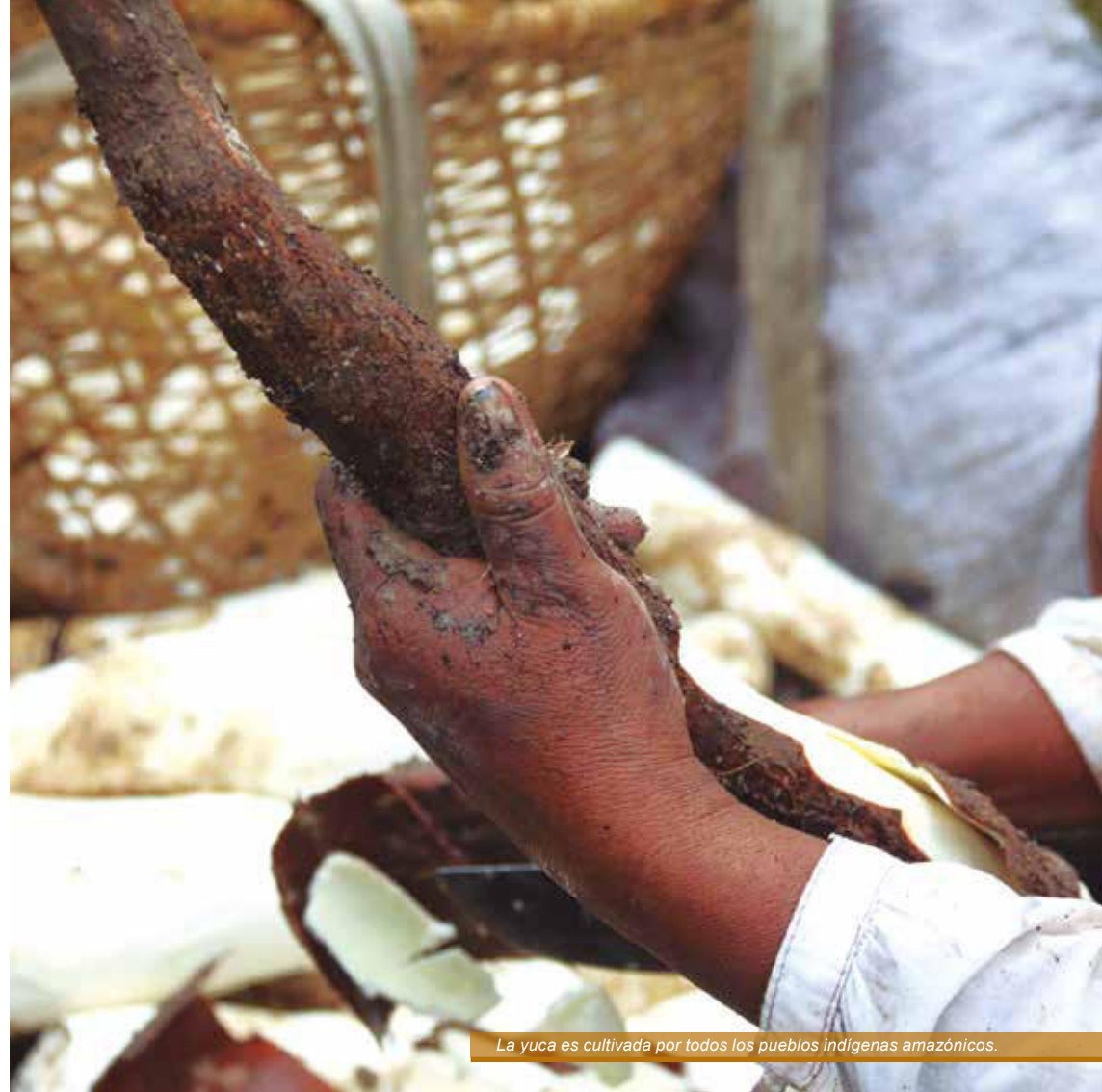
La yuca es cultivada por todos los pueblos indígenas amazónicos.