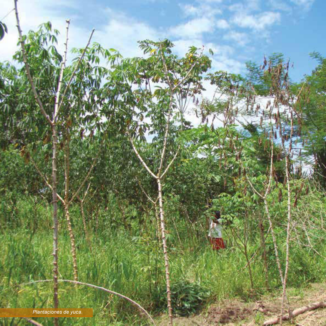
Plantaciones de yuca.