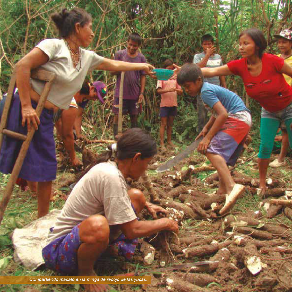
Compartiendo masato en la minga de recojo de las yucas.