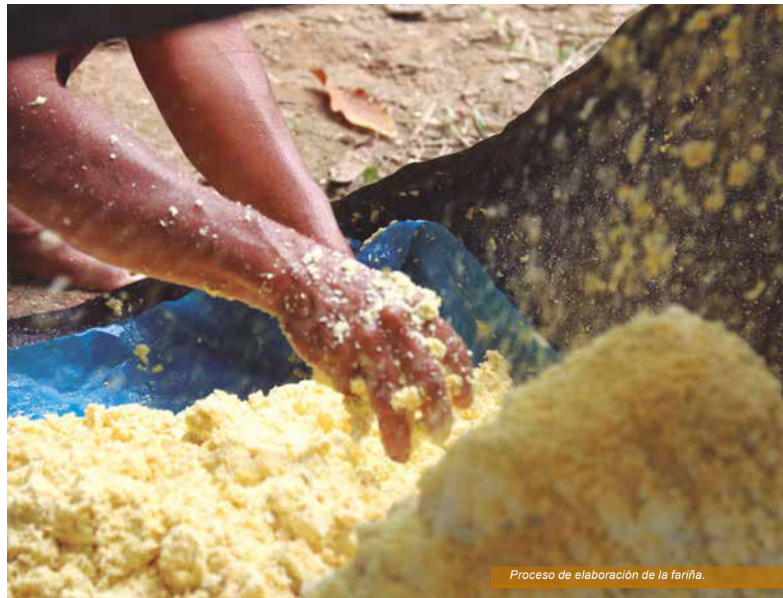
Proceso de elaboración de la fariña.

Aunque la fariña se fabrica para contar con un producto de consumo, las motivaciones para hacerla varían de acuerdo a las zonas. En los lugares inundables tiene por finalidad transformar la yuca cosechada antes de la creciente de los ríos. En cambio, en las zonas no inundables, en las cuales siempre se puede contar con yuca fresca, se fabrica para que sirva como alimento de los mitayeros (cazadores) durante sus incursiones o para personas que deben hacer viajes prolongados por el monte. La fariña podrá ser consumida como acompañante de pescados y carnes, sean asados o en sopas, o preparando aradú, masa que se logra mezclándola con huevos de taricaya crudos. También se elabora como bebida: diluida en agua, se le añade –si se tiene al alcance– limón y azúcar o miel. Se tiene así el refresco llamado shibé en Loreto y Ucayali.