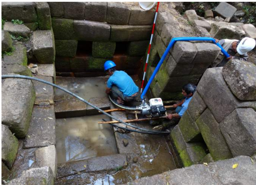
Fig. 4 Fuente Inca

La relación con el agua es más directa en la denominada fuente Inca, que se ubica a corta distancia del ushnu y se vincularía a éste subterráneamente mediante canales. La estructura, excavada por la arqueóloga Araceli Espinoza, se encuentra en una depresión del terreno donde parece confluir varios afluentes subterráneos que habían inundado la fuente (Fig. 4). La planta arquitectónica de la fuente es rectangular, construida con muros de rocas labradas de estilo Inca imperial. Los paramentos internos, con eje de orientación este-oeste, muestran seis hornacinas trapezoidales. El vano de acceso hacia el este, también tiene forma trapezoidal con dos peldaños en el umbral. Una canaleta labrada en la roca deja ingresar el agua por el lado oeste. En el interior existe una poza de base rectangular donde cae el agua que vierte la canaleta, la cual tiene un ducto de desagüe que se dirige a una esquina del umbral. El conjunto se encuentra rodeado por dos muros que presentan la misma orientación este-oeste.