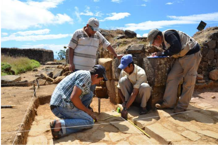
Fig. 6 acclawasi, segunda portada piso y umbral

El informe del equipo de arqueólogos y especialistas, enfatiza la necesidad de emprender acciones de conservación de emergencia para proteger la integridad del patrimonio arqueológico que se viene descubriendo. Una medida usual en esta etapa del trabajo, es volver a cubrir las estructuras y evidencias descubiertas para evitar que el agua, los líquenes, la radiación solar o el flujo de los visitantes, contribuyan al deterioro o perturbación de las evidencias.