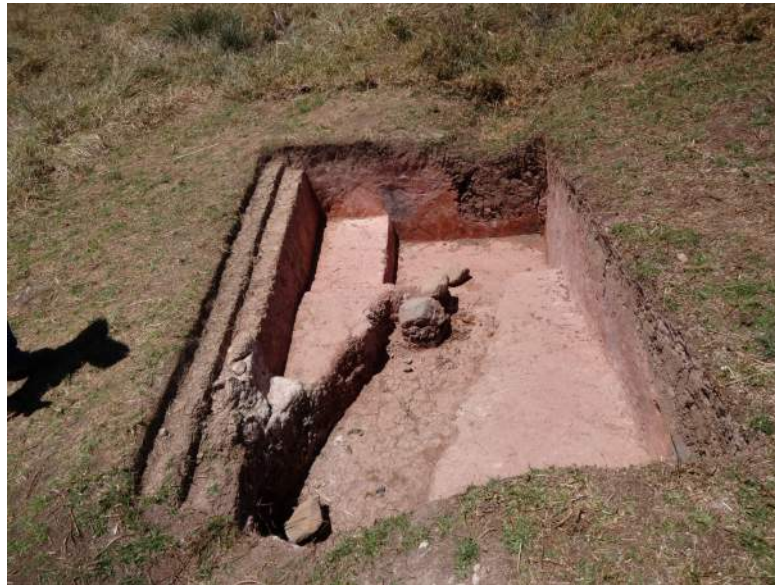
Fig.2 plaza, suelo de color rosado