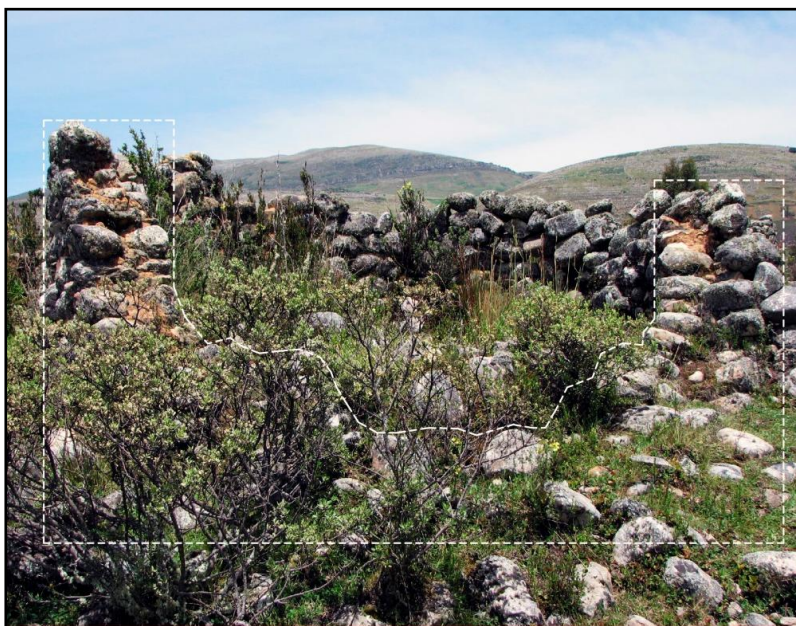
Fig. 04: Una de las pocas colcas que se conservan en Chumipata, nótese la técnica constructiva de los muros similar a los de Muruwain

Se localizan a 6.3 Km al noreste de las colcas de Huánuco Pampa, sobre la misma altiplanicie. Estas se componen de los restos de seis recintos circulares divididos en dos filas de tres cada una y alineados uno frente al otro. La técnica constructiva de los muros es doble con relleno, estos miden 1.5 m de altura y tienen un diámetro de 3.40 m aproximadamente. En este sitio existen algunos elementos simbólicos como huancas, piedras y rocas con hoyos que le otorgan un carácter singular, toda vez que representan un espacio ceremonial.