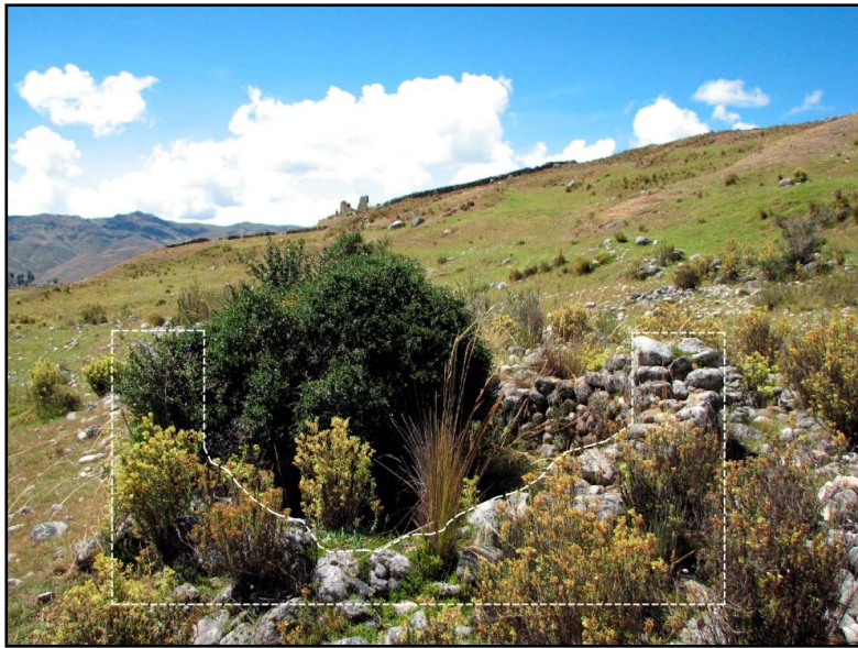
Fig. 03: Una de las colcas de Muruwain, nótese el mal estado de conservación.

El espacio donde se emplazan estos posibles depósitos ha sido aterrazado, pudiéndose observar hasta cinco niveles escalonados. Sobre estas terrazas se observan aún los restos de algunos muros rústicos, de doble paramento con relleno de piedras más pequeñas y barro, que conforman unidades arquitectónicas cuadrangulares y circulares, siendo estas últimas semejantes a las colcas del núcleo urbano de Huánuco Pampa.