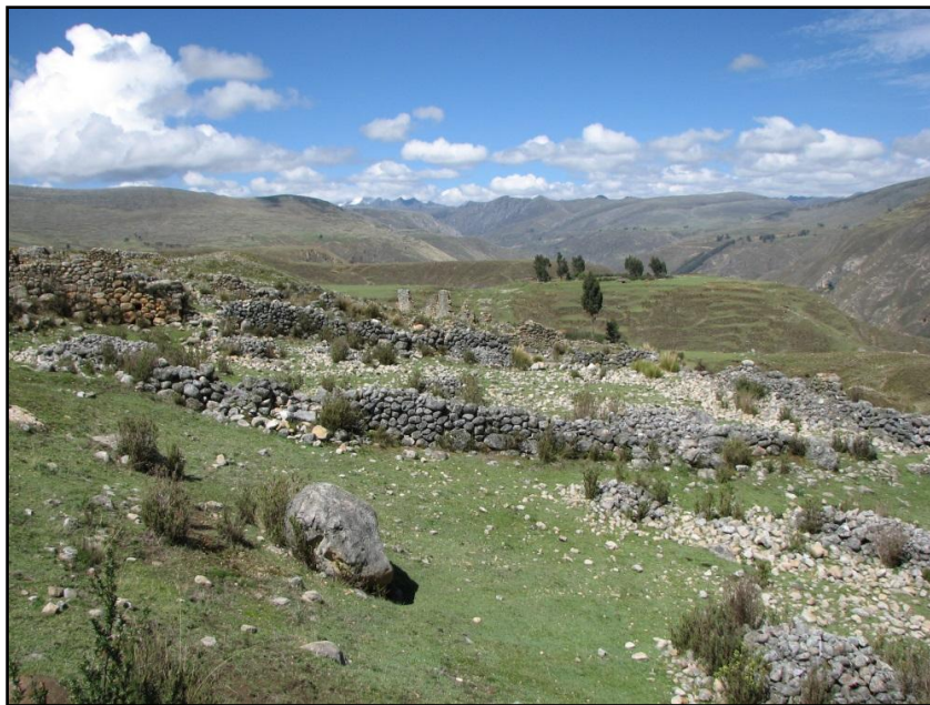
Fig. 05: Vista panorámica de Wisajirkan

Se encuentran a 2.2 Km al norte de las colcas de Huánuco Pampa y a 500 m. al Este de Muruwain , no existiendo actualmente un camino definido que conduzca a este lugar. Los pobladores locales conocen este sitio como Wisajirkan ( Wisa = deformado / jirkan = cerro) el cual deriva de un promontorio de tierra ubicado en la parte alta de este sector.