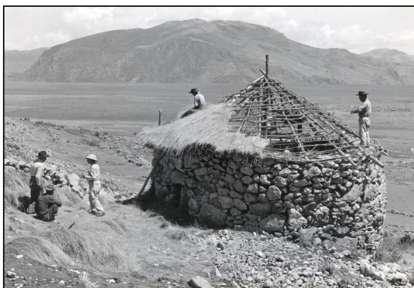
Fig. 02: Techado de una colca circular después de los trabajos de limpieza y consolidación dirigidos por John Murra en Huánuco Pampa (Foto de Luis Barreda Murillo, 1965).

Por otro lado, precisaron además la existencia de más de un tipo de almacenes: “Será bien digamos cómo se guardaba, y en qué se gastaba este tributo. Es de saber que por todo el reino había tres maneras de pósitos, donde encerraban las cosechas y tributos. En cada pueblo grande o chico había dos pósitos en el uno se encerraba el mantenimiento, que se guardaba para socorrer naturales en años estériles. En el otro pósito se guardaban las cosechas del sol y del Inca. Otros pósitos había por los caminos reales de tres a tres leguas, que ahora sirven a los españoles de ventas y mesones” (Garcilaso de la Vega, 1942 [1609]: 23).