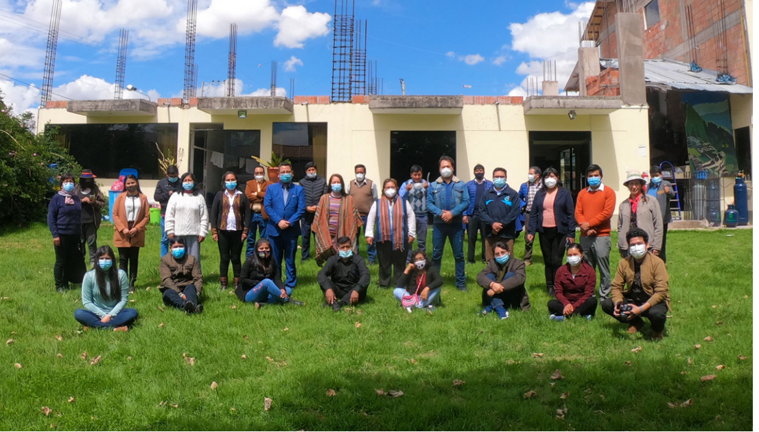
Foto grupal de participantes del taller de validación en Cusco

Finalmente, luego del proceso de validación, el glosario fue revisado por traductores y especialistas a fin de poder elaborar los contenidos complementarios e indispensables para esta publicación.