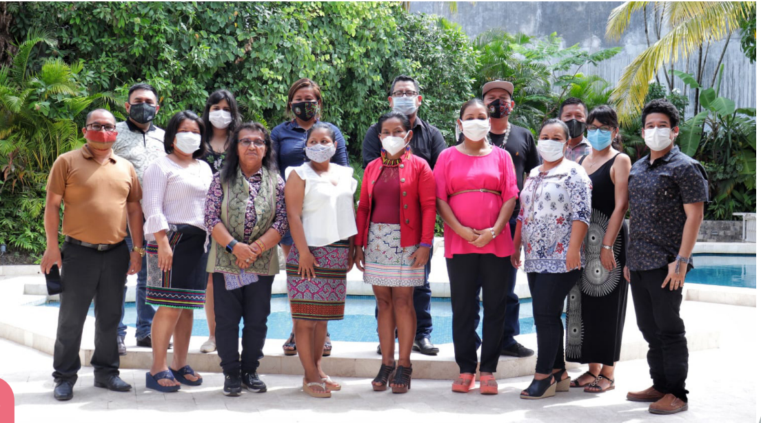
Foto grupal de participantes del taller de validación en Pucallpa