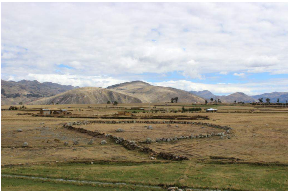
Vista panorámica de la Estructura Arquitectónica N° 03