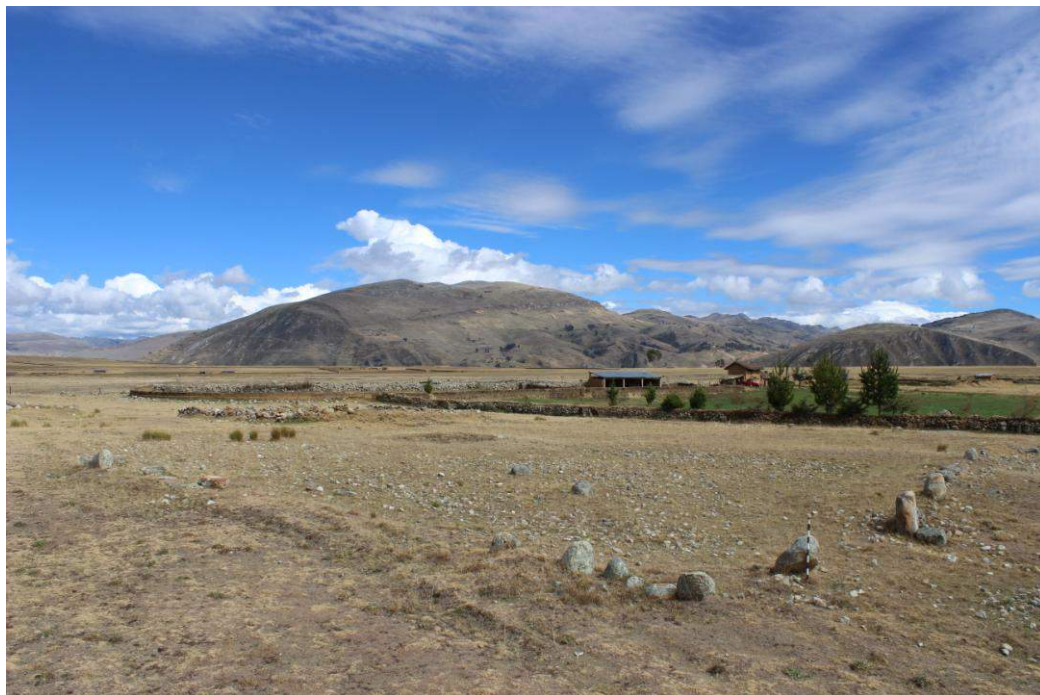
Vista panorámica de la Estructura Arquitectónica N° 01

Se encuentra a 1.3 kilómetros al noreste de Huánuco Pampa y a unos 100 metros al noroeste de una vía afirmada. Esta estructura presenta una planta semicuatrandrangular, cuyo muro sur tiene una longitud de 20.00 metros. y el muro este de 39.70 metros; los muros norte y oeste no se aprecian al haber sido destruidos posiblemente por actividades agrícolas que se desarrollan en la zona. El muro sur está conformado por una alineación de piedras pircadas de manera simple y dispuestas verticalmente, tienen en promedio 0.70 metros de altura por 0.40 metros de ancho y 0.30 metros de espesor, algunas de ellas presentan huellas de desbastado, sobre todo en la parte externa. El muro este presenta piedras similares a las del muro sur, las cuales también se encuentran dispuestas de manera vertical, aunque en algunos segmentos del muro se nota la cabecera de un muro de doble paramento que se extiende entre las piedras colocadas verticalmente, éste doble paramento está compuesto por piedras pequeñas que en promedio miden 0.20 metros de largo, por 0.15 metros de ancho y 0.10 metros de espesor. Es posible que toda la estructura haya estado conformado por piedras grandes, dispuestas de manera vertical a cada cierta distancia, y los espacios vacíos completados con pircados de doble paramento conformados por piedras pequeñas. No se observó material cultural en superficie.