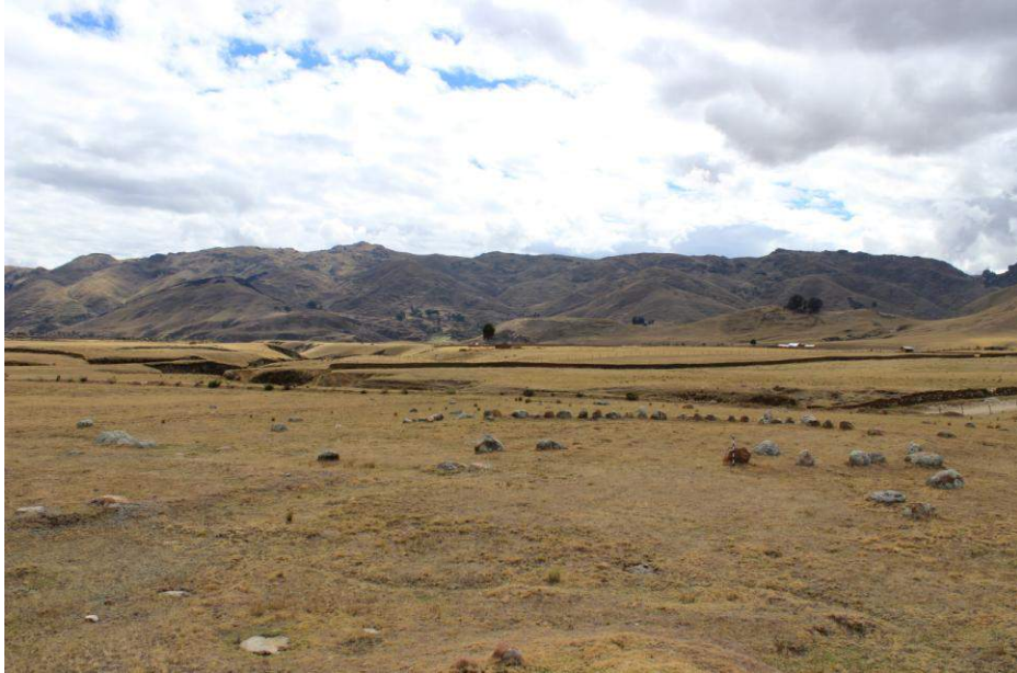
Vista panorámica de la Estructura Arquitectónica N° 02

actividades cotidianas de los pobladores desaparecieron. Los cantos rodados fueron las piedras más utilizadas para la construcción de este corral, algunos de los cuales están desbastados en la parte interna y externa. Actualmente el muro que conforma el corral está compuesto por una sola hilada de piedras. No se observó material cultural en superficie.