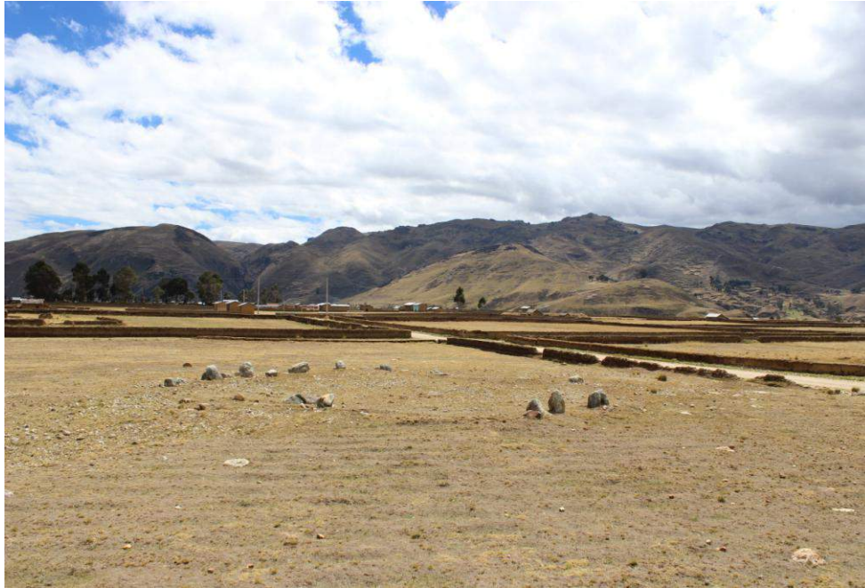
Vista panorámica de la Estructura Arquitectónica N° 08