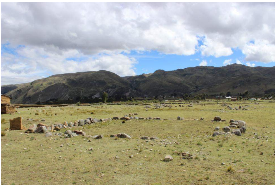
Vista panorámica de la Estructura Arquitectónica N° 14

Se encuentra en el lado noreste de la Estructura Arquitectónica N° 13, es de planta semicuadrangular y mide 20.00 metros de largo por 18.80 metros de ancho. Los muros están definidos por una alineación de piedras de una sola hilada, las cuales miden en promedio 0.60 metros de altura, 0.50 metros de ancho y 0.45 metros de espesor; dichas piedras están dispuestas de tal manera que dejan pequeños espacios entre una y otra para luego ser completados con piedras pequeñas como relleno entre las piedras grandes.