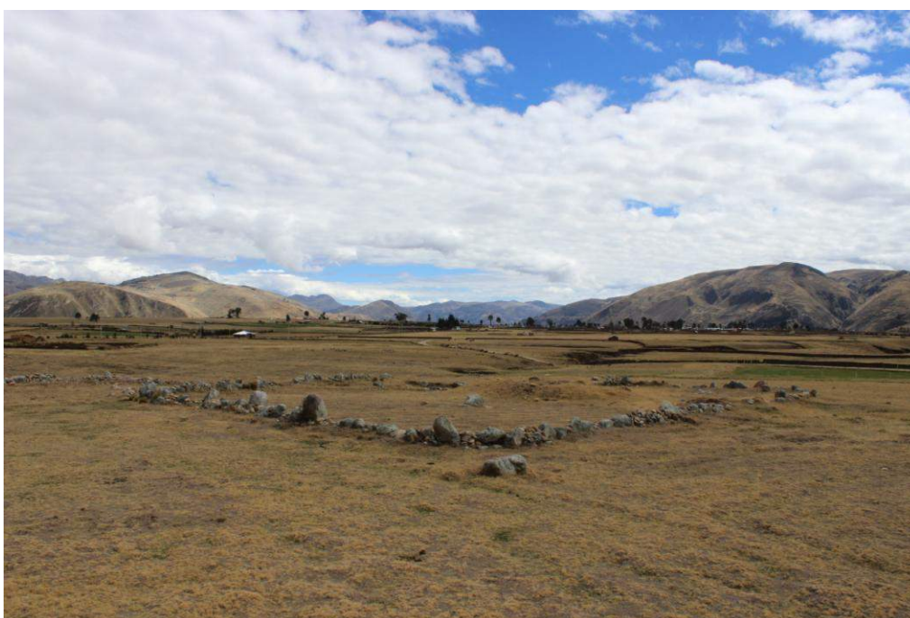
Vista panorámica de la Estructura Arquitectónica N° 04

Se ubica aproximadamente a 1.44 kilómetros al noreste de Huánuco Pampa, presenta una planta semicuatrandrangular, sus muros fueron elaborados empleando una técnica de construcción simple, aunque actualmente solo se observa la primera hilada, estos se componen de grandes piedras de 0.80 metros de altura por 0.50 metros de ancho y 0.40 metros de espesor, los mismas que están dispuestas dejando grandes espacios que en el pasado fueron completados con piedras pequeñas y medianas. Actualmente estos espacios se encuentran cubiertos por pircados modernos, como consecuencia de los trabajos realizados por los pobladores locales con la finalidad de limpiar la superficie del terreno para el desarrollo de actividades agrícolas. No se observó material cultural en superficie.