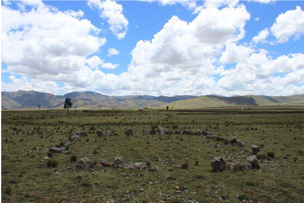
Vista panorámica de la Estructura Arquitectónica N° 17

La mayoría de las piedras de los muros son sedimentarias canteadas que afloran del subsuelo, por otra parte también se conforman de cantos rodados con la cara vista desbastada. La técnica de construcción empleada es simple, las piedras han sido colocadas dejando grandes espacios que fueron rellenos con piedras pequeñas las cuales actualmente se encuentran totalmente colapsadas y dispersas sobre el terreno. El área en general presenta huellas de uso agrícola reciente con la finalidad de cultivar tubérculos. No se observó material cultural en superficie.