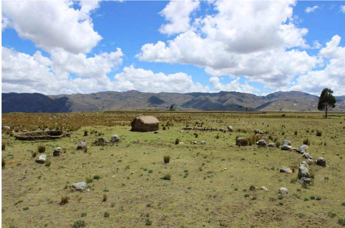
Vista panorámica de la Estructura Arquitectónica N° 18