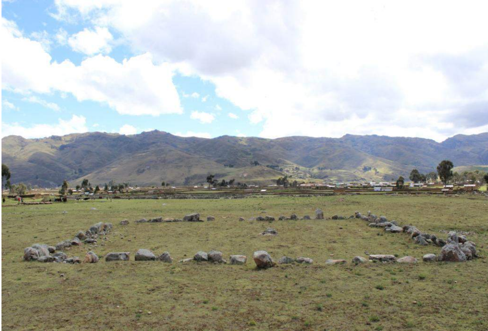
Vista panorámica de la Estructura Arquitectónica N° 16

En comparación a las estructuras anteriores, sus cuatro muros se componen de piedras grandes que en promedio miden 0.90 metros de altura, 0.80 metros de ancho y 0.75 metros de espesor; las piedras están colocadas dejando pequeños espacios entre una y otra, en algunas partes aún se conservan las piedras pequeñas que servían de relleno en los espacios. La técnica de construcción empleada es simple y aparentemente el vano de acceso se encontraba ubicado en el muro este. No se observó material cultural en superficie.