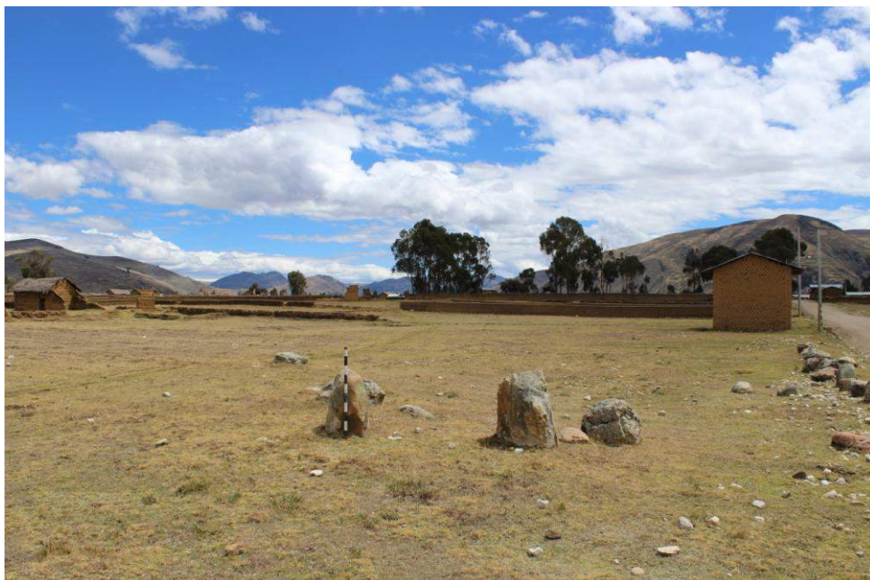
Restos del vano de acceso de la Estructura Arquitectónica N° 09

Se ubica a 2.5 kilómetros al noreste de Huánuco Pampa y próxima al centro poblado de Guellaycancha. Esta estructura debió tener una planta circular como la mayoría de las demás estructuras, sin embargo, actualmente se encuentra solo una alineación de tres piedras canteadas y los restos de un posible vano de acceso.