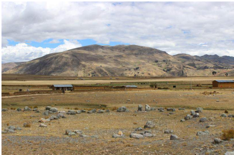
Vista panorámica de la Estructura Arquitectónica N° 05

La técnica constructiva es simple; actualmente se conserva solo la primera hilada, la cual está compuesta por piedras grandes de 0.50 metros de altura por 0.40 metros de ancho por 0.30 metros de espesor, con la cara vista desbastada en algunos casos. Entre cada piedra se encuentran espacios que fueron cubiertos con algún tipo de relleno. No se observó material cultural en superficie.