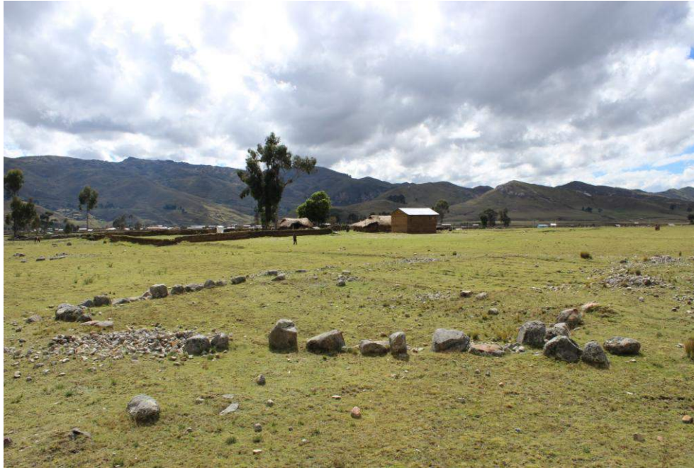
Vista panorámica de la Estructura Arquitectónica N° 13

pequeñas, que posiblemente colapsaron con el tiempo, los factores ambientales (intensas lluvias) y actividades humanas, ésta última hipótesis se sustenta en la presencia de gran cantidad de pequeñas piedras junto a los muros como resultado de la limpieza del terreno para el desarrollo de actividades agrícolas. No se observó material cultural en superficie.