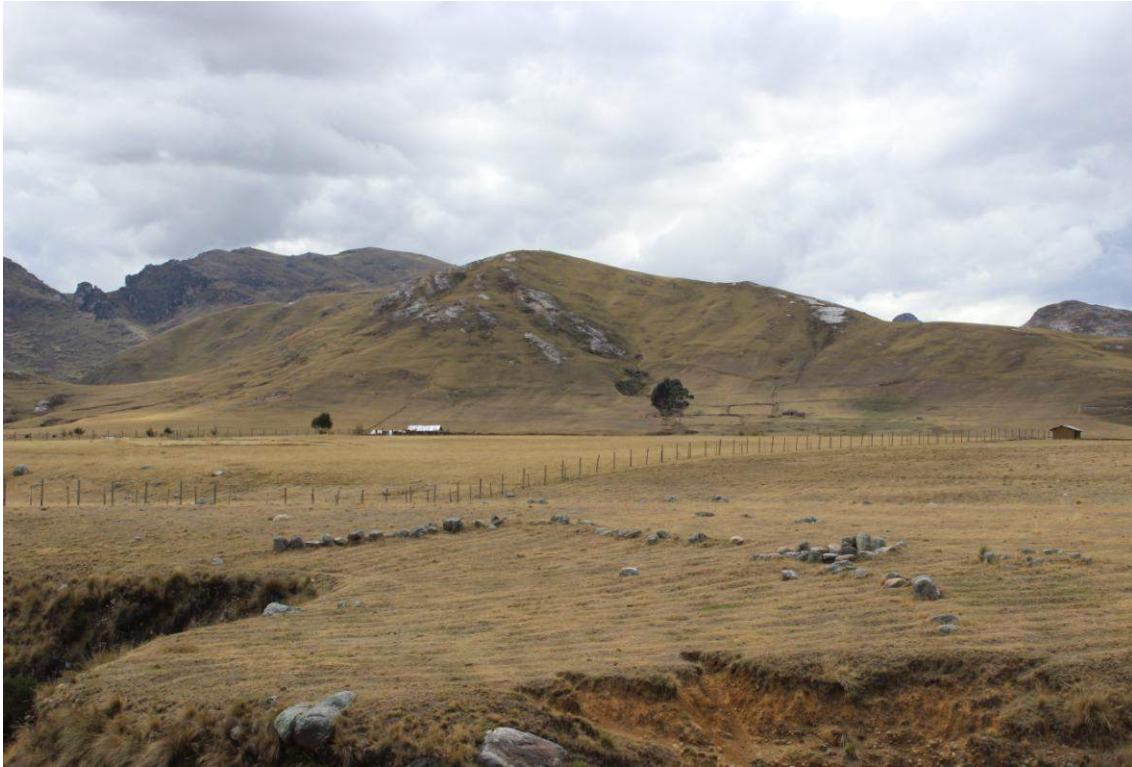
Vista panorámica de la Estructura Arquitectónica N° 07