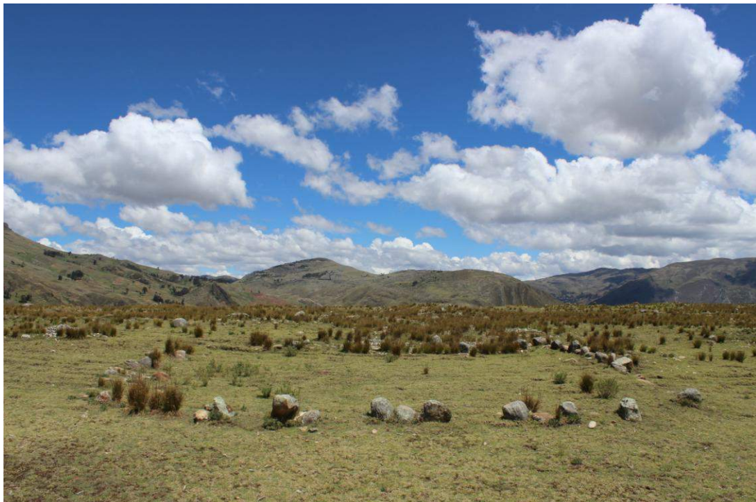
Vista panorámica de la Estructura Arquitectónica N° 19

Se encuentra a aproximadamente a 40.00 metros al noroeste de la Estructura Arquitectónica N° 20, es de planta semicuadrangular y mide 17.80 metros de largo por 16.40 metros de ancho, está conformado por cuatro muros compuestos por alineaciones de piedras de una sola hilada con espacios pequeños entre cada piedra, las cuales originalmente debieron contener piedras pequeñas o material perecedero (como la champa).