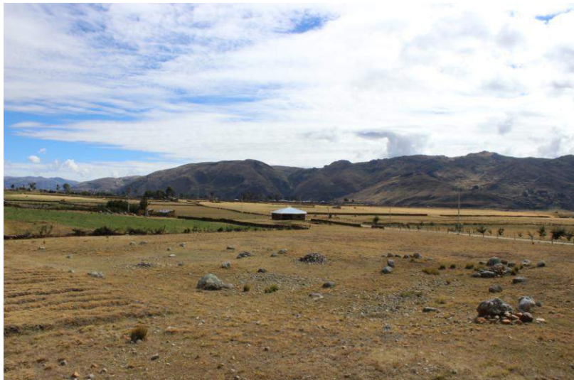
Vista panorámica de la Estructura Arquitectónica N° 10

Se encuentra a 1.4 kilómetros al noreste de Huánuco Pampa y a 50 metros de una vía afirmada. Esta estructura presenta una planta semicuatrandrangular compuesta por tres recintos, cuyos muros son simples, es decir, constan de un solo paramento. Debido al mal estado de conservación de los muros solo se notan algunas piedras alineadas, que en promedio miden 0.60 metros de altura por 0.40 metros de ancho y 0.30 metros de espesor. Algunas de estas piedras presentan desbastado en la cara vista interna y externa. No se observó material cultural en superficie.