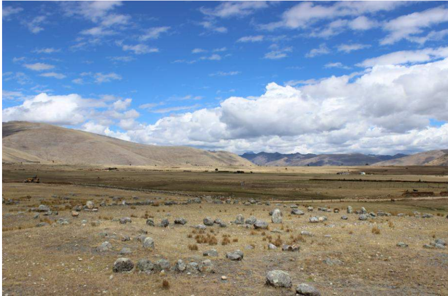
Vista panorámica de la Estructura Arquitectónica N° 06

El muro que la conforma está compuesto por una sola hilada de piedras grandes de 0.60 metros de altura, por 0.40 metros de ancho y por 0.30 metros de espesor; la mayoría de las mismas son cantos rodados que en algunos casos presentan con la cara vista desbastada. Entre estas piedras se encuentran espacios que fueron cubiertos con algún tipo de relleno.