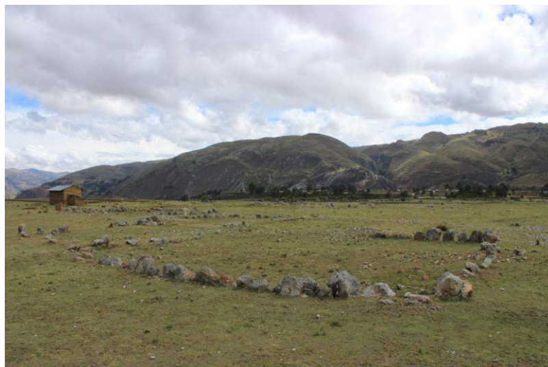
Vista panorámica de la Estructura Arquitectónica N° 11

Se ubica a 2.4 kilómetros al noreste de Huánuco Pampa y en el extremo sur de una concentración de estructuras similares. Presenta una planta semicuatrandrangular con muros simples y esquinas curvas, tiene 18.60 metros de largo por 17.20 metros de ancho, aunque actualmente solo se observa la primera hilada. Los muros sur y este se encuentran mejor definidos al conservar muchas de sus piedras originales, lo cual permite apreciar las esquinas sureste, suroeste y noroeste.