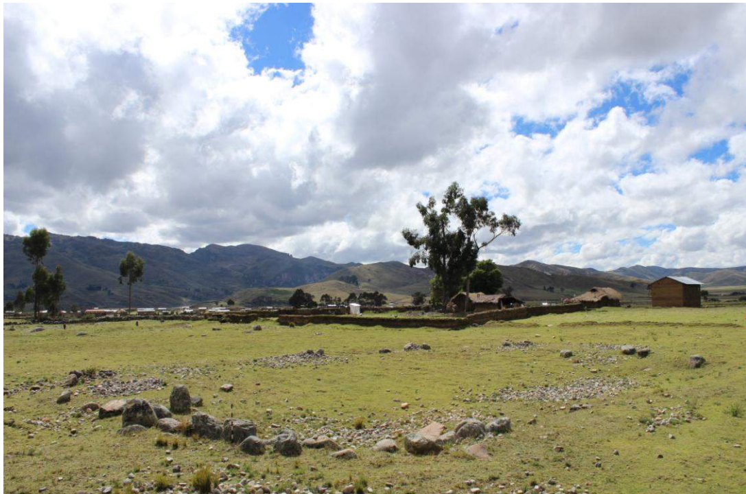
Vista panorámica de la Estructura Arquitectónica N° 15

Para construir este corral se ha realizado una pequeña modificación en el terreno, extrayendo tierra para nivelar el suelo, producto de dicha extracción se nota un pequeño desnivel en el lado oeste, el lado interno de la unidad arquitectónica queda en un nivel inferior en comparación al lado externo. Al interior de la estructura se observó gran cantidad de piedras pequeñas que posiblemente formaban parte del relleno entre los pequeños espacios dejados al colocar las piedras grandes. No se observó material cultural en superficie.