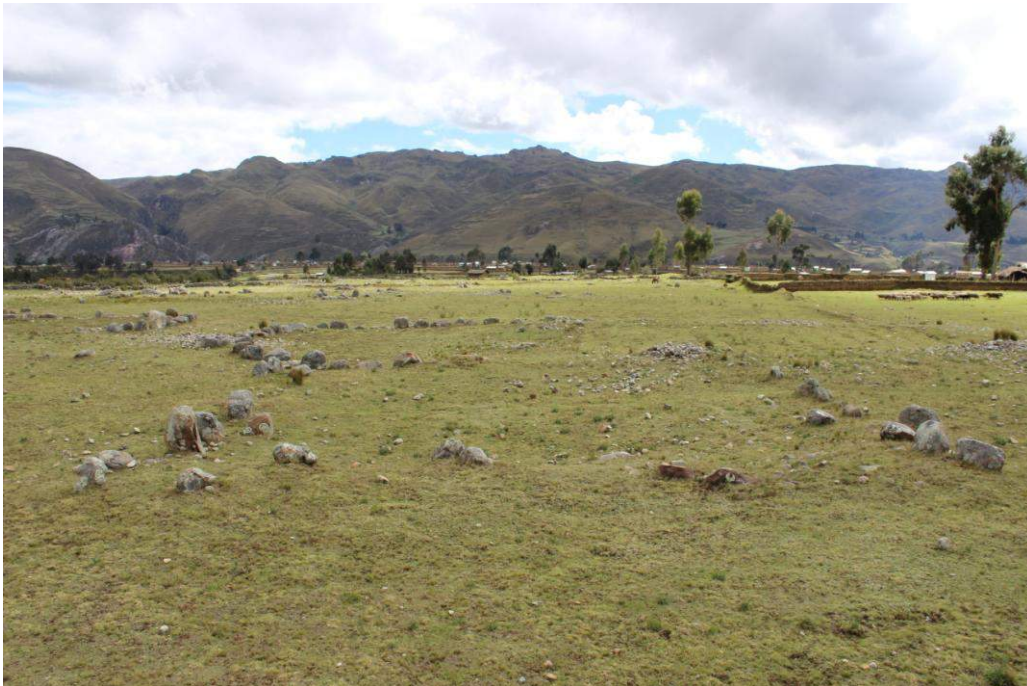
Vista panorámica de la Estructura Arquitectónica N° 12

Se encuentra contigua al lado norte de la estructura arquitectónica N° 11, es de planta semicuatrandangular con un ligero hundimiento en la parte central; mide 12.20 metros de largo por 11.80 metros de ancho, la técnica constructiva de los muros es simple y están compuestos por piedras medianas que en promedio miden 0.50 metros de altura por 0.40 de ancho y 0.35 metros de espesor. Los muros se encuentran bastante deteriorados, solo se notan las alineaciones de las piedras, alejadas unas de otras, dichas alineaciones se encuentran casi cubiertas por pequeñas piedras y tierra, a consecuencia de la actividad agrícola. No se observó material cultural en superficie.