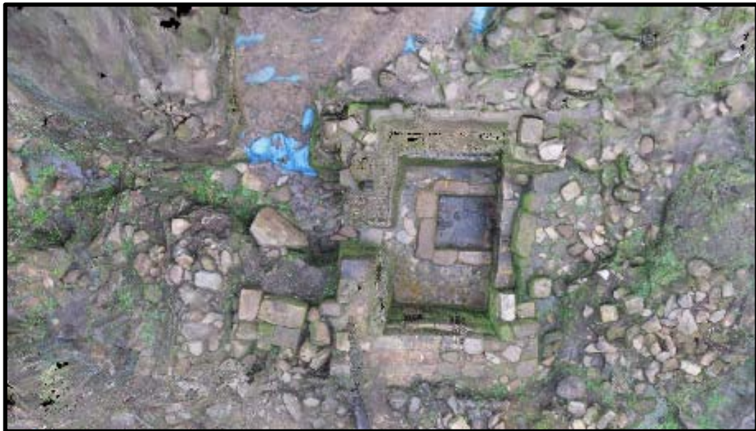
Figura 10. Ortomosaico de la fuente Inca procesado usando Agisoft Photoscan ®. Composición: Abel Traslaviña.

Luego de este proceso de conservación integral de la Fuente Inca y la implementación de puesta en valor mediante infraestructura en el contexto de un circuito de visitas, la fuente podrá ser visitada y admirada (Figura 11).