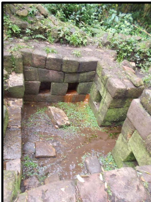
Figura 04: Trabajos de intervención el 2013 en la Fuente Inca.