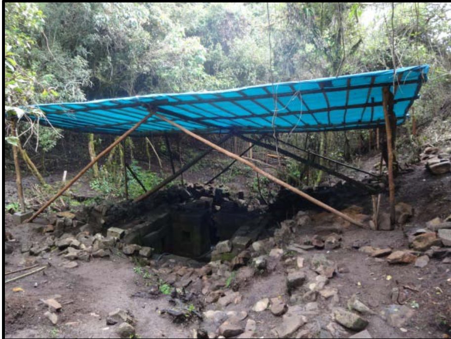
Figura 08. Fuente Inca con cobertura.

Próximamente, se desarrollará en Aypate un programa de investigación con un componente de conservación, el cual permitirá realizar excavaciones arqueológicas, conservación, restauración, puesta en valor, orientando todo ello a la puesta en uso social del monumento y los sectores que lo integran. En el Sector 15, se desarrollará un proceso de conservación integral siguiendo los siguientes pasos: