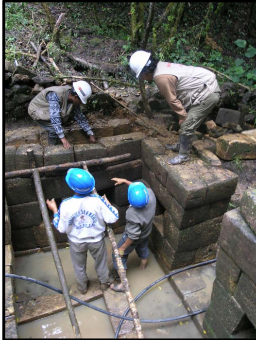
Figura 06: Apuntalamiento durante el proceso de conservación de la Fuente Inca