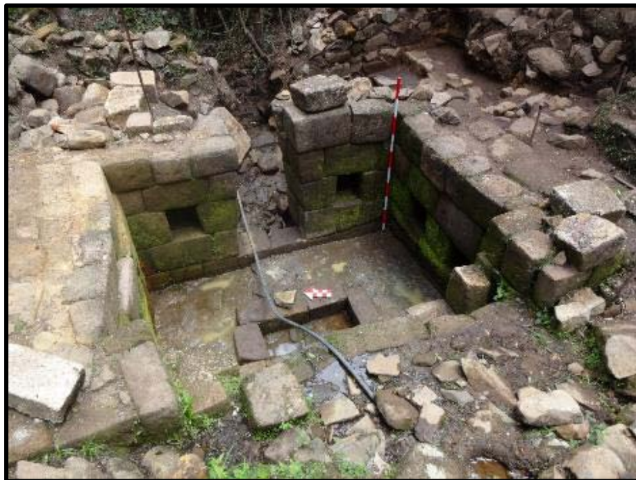
Figura 07: Luego del proceso de intervención de la fuente inka