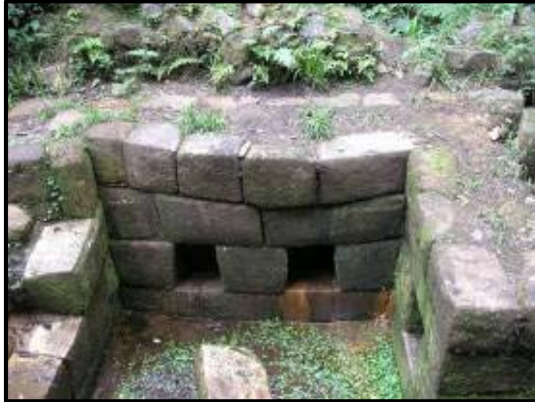
Figura 05: Muro norte pandeado de la Fuente Inca.

A continuación, se describe el procedimiento seguido para solucionar el pandeo del muro norte: