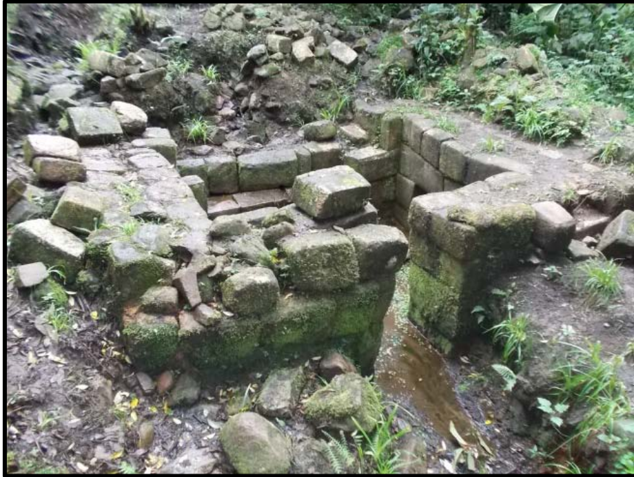
Figura 02: Fuente Inca, antes de su intervención el 2012.