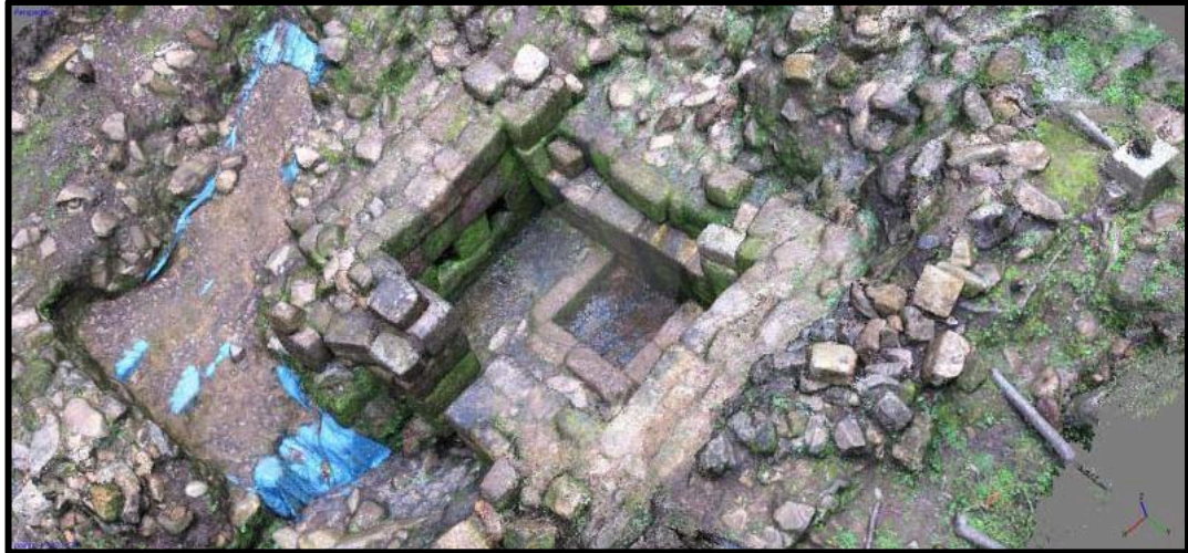
Figura 09. Modelo digital de elevaciones Inca procesado usando Agisoft Photoscan ®. Composición: Abel Traslaviña.