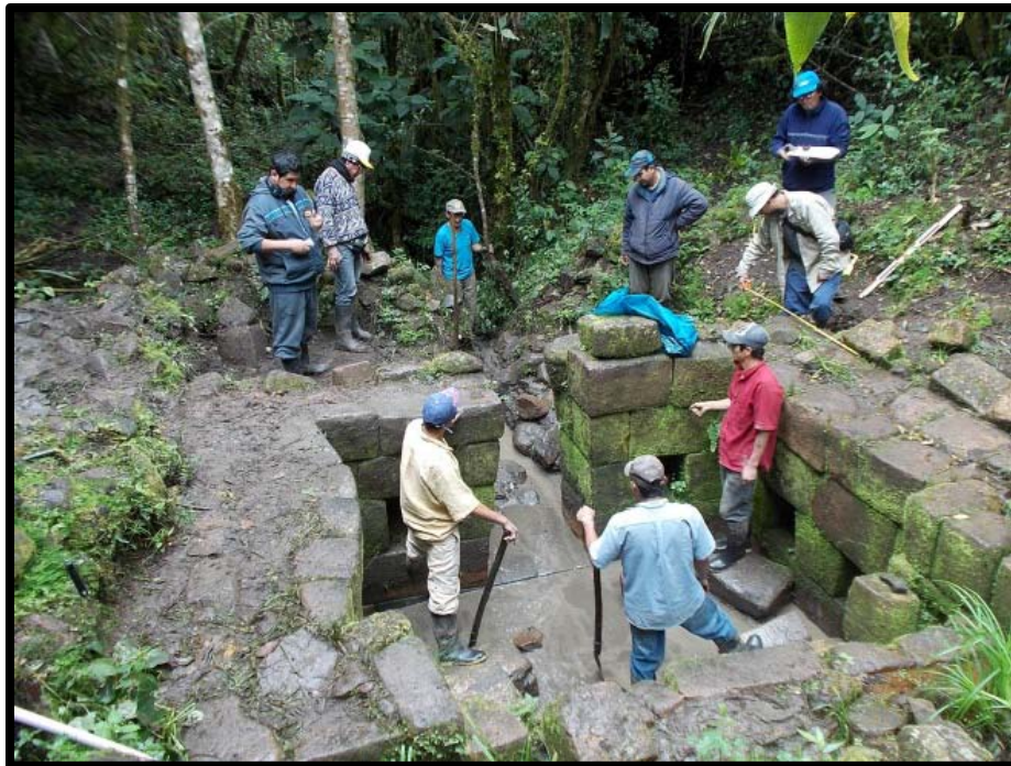
Figura 03: Fuente Inca, durante su intervención el 2012.