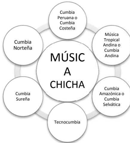
Gráfico N° 1 Vertientes de la música chicha