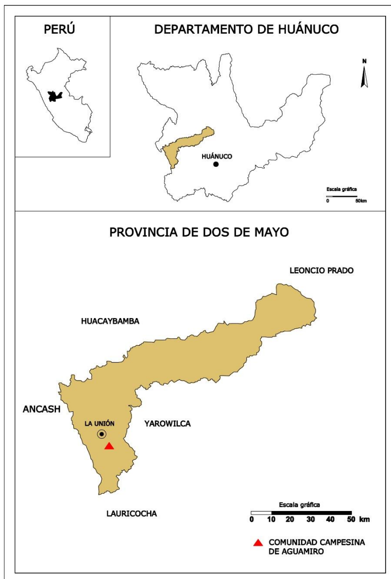
Fig. 01: Plano de ubicación de la Comunidad Campesina de Aguamiro. Tomado de Ordóñez 2013.

mismos que se originan en algunos puquios o manantiales que también suelen ser considerados jirkas , destacando el Huachag y el Chuchupuquio .