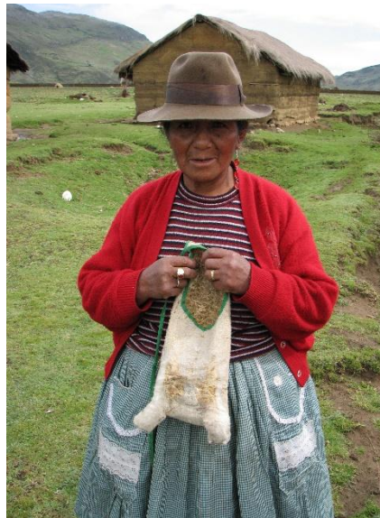
Fig. 04: Comunera mostrando su wallqui o bolsa de piel de conejo que contiene en su interior su ylla .