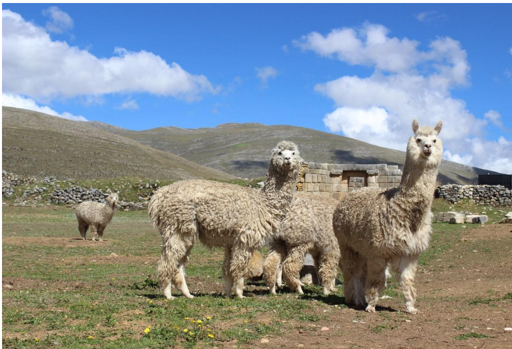
Fig. 02: Alpacas en Huánuco Pampa que forman parte de un plan de reintroducción de camélidos gestionado por el Proyecto Integral Huánuco Pampa el año 2013.

Entonces, considerando que, en épocas prehispánicas y en los primeros años de la conquista, existieron en las proximidades de Huánuco Pampa grandes recuas de camélidos, se propone, en base a los datos etnográficos de otras regiones (Flores 1977, Condori y Gow 1982, Taipei 1991, Delgado de Thays 1965), que los habitantes de este centro administrativo - religioso inca y de los alrededores, dedicados entre otras actividades al pastoreo, desarrollaron creencias mágico - religiosas asociadas a su crianza.