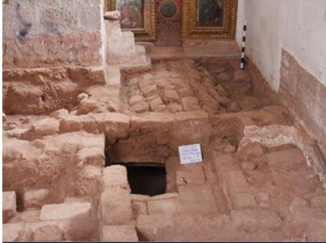
Cripta N° 2