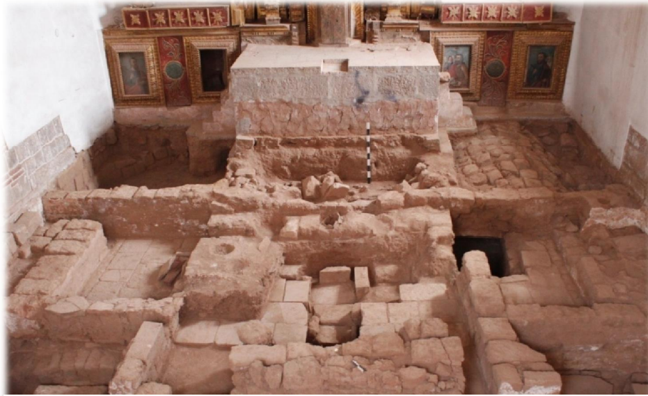
Criptas N° 02, 03 y 04, Sector A, Sub Sector Presbiterio