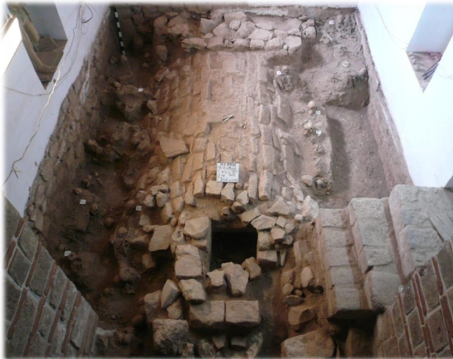
Cripta N° 01, Sector A, Sub Sector Capilla Virgen de las Nieves