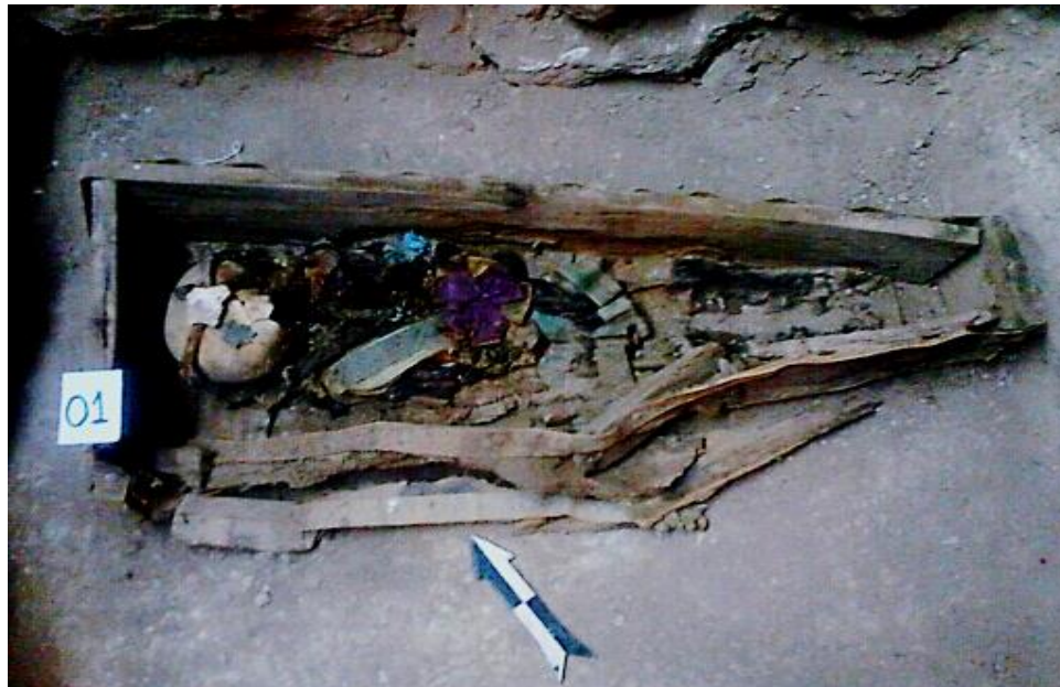
Sector: A, Sub Sector: Baptisterio, entierro de sub adulto 1.5 años de edad, probablemente de sexo femenino por el atuendo que llevaba en el momento de su inhumación, se hallaba en un ataúd de madera de forma rectangular irregular.