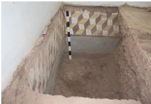
Evidencia de pintura mural a superficie UE-50