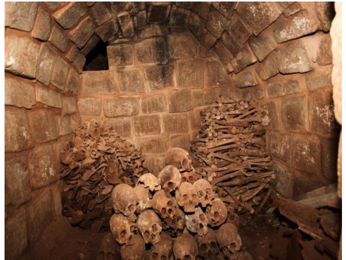
Criptas colectivas que corresponden a familias importantes de la Villa San Francisco de Asís de Maras