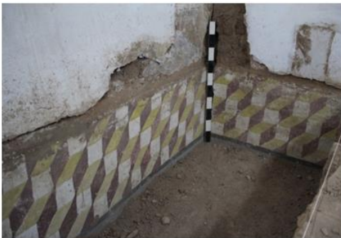
Evidencia de pintura mural a superficie UE-51