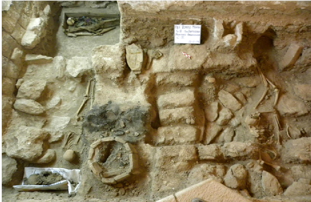
Sector: A, Sub Baptisterio: Presbiterio, entierros cristianos asociados a un "horno", en cuyo interior se observa material calcinado que corresponde a huevos de gallina con material calcinado en el interior.