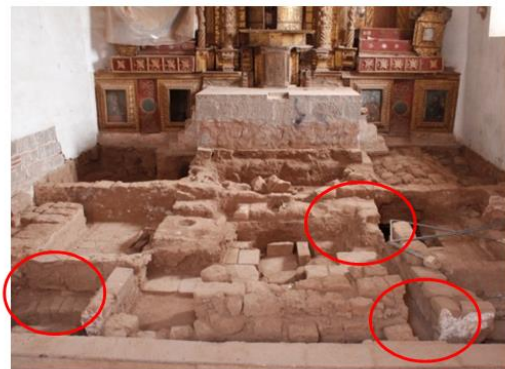
Vista general de las Criptas N° 2,3 y 4