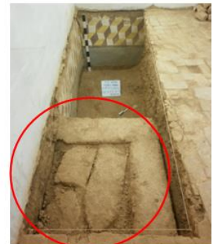
Evidencia de altar soterrado UE-50