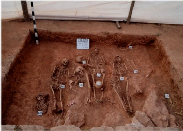
Sector: B, Sub Sector: Cruz Misional, entierros colectivos

Como se menciona en la cita, muchas veces los deudos vendían o donaban sus terrenos, ganados, etc. tal de tener la gracia de enterrarse en el Templo y estar más cerca a Dios.