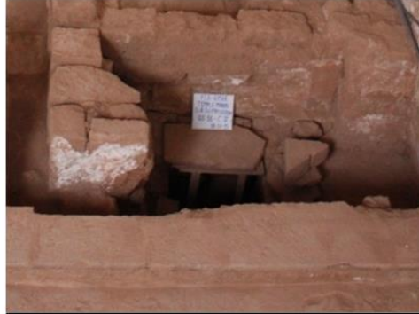
Cripta N° 3