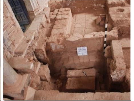
Cripta N° 4