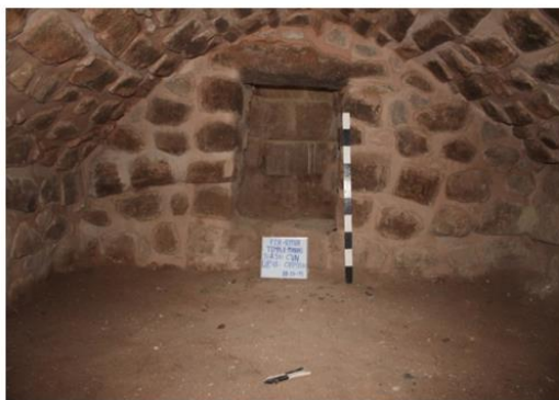
Interior Cripta N°1

Sector: AA Sub sector: Capilla Virgen de las Nieves, Presbiterio UE: 16,48 y Monitoreo Arqueológico.