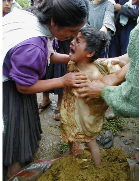
Un niño más grande recibe la misma "inoculación".