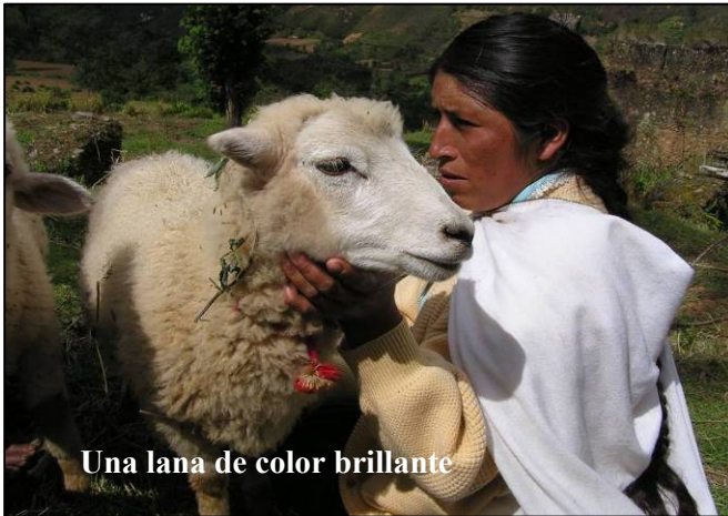
Una lana de color brillante

refrenan al Cerro son de dos tipos: los primeros son semillas de ruda, 13 ajos y azufre, cuyo olor es desagradable para el Cerro. El segundo tipo es la semilla de wayrush ‘huairuro’ que por su color rojo brillante y su mancha negra resulta atractiva para el Cerro al punto que lo distrae y ya no ve al niño. 14 Con esta doble protección, un niño tiene más posibilidad de sobrevivir los años más vulnerables de su infancia y de convertirse metafóricamente en un awkis ‘una persona mayor’ de tres o cinco años, que ya puede andar sin caerse.