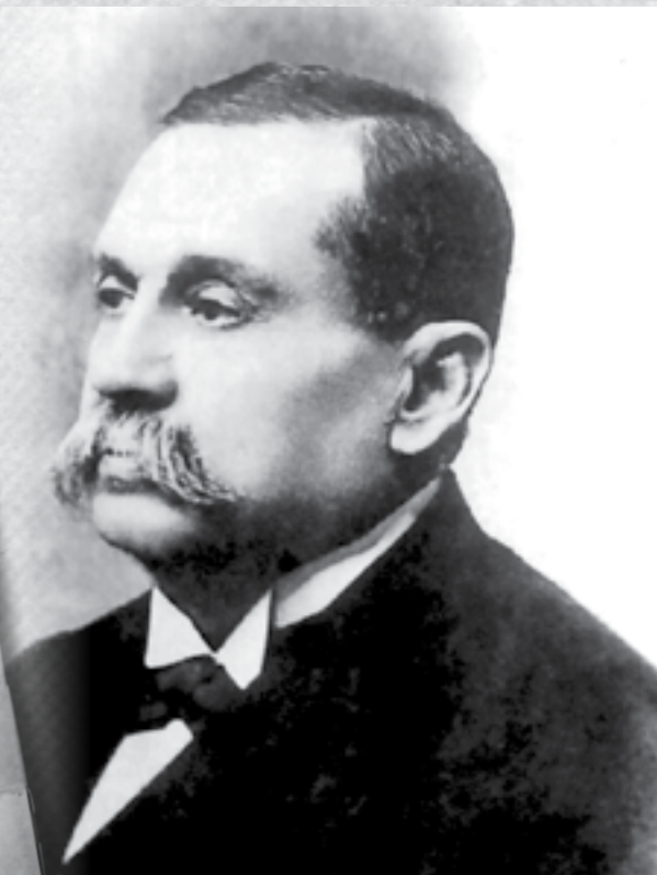
Guillermo Billinhursts, fue elegido Presidente Constitucional con el apoyo de la clase obrera en 1912.

Esta imagen es una recreación del documento original.