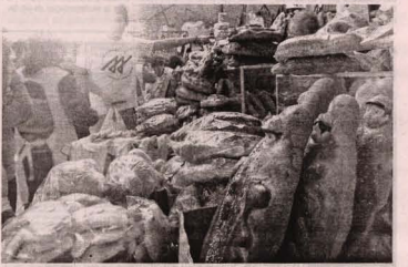
■ UNA TRADICIÓN latinoamericana.