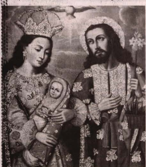
MARIA Y JOSÉ, padres de Jesús.

(Conferencia ofrecida en Radio Filarmonía (Lima) el 7 de diciembre de 2017)