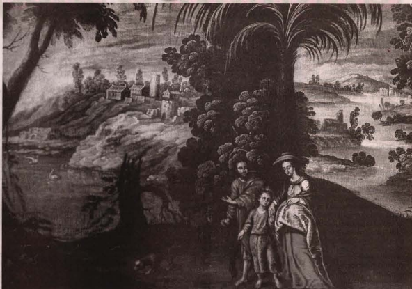
EN NAVIDAD SE RECORDA el nacimiento del Niño Jesús.

Existió una relativamente importante industria de figuras navideñas no solamente en los lugares mencionados, sino en el Cuzco, Arequipa y Lima, entre otros lugares del Perú. Allí no solamente producían las imágenes del Misterio y los Reyes Magos, sino gran cantidad de pequeñas figuras, generalmente de pasta y tela encolada, policromadas, que representaban pastores y ovejas y otros animales, así como vendedores callejeros, funciona-