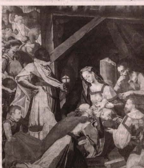
CADA LOCALIDAD tiene una interpretación similar a este acontecimiento.