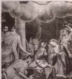
EL NACIMIENTO INTENTA retratar la llegada de Cristo al mundo.