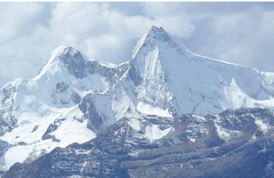
Apu Pariacaca, Lima

cultural que tienen o que tuvieron con el espacio. Tales vinculaciones constituyen referentes de su identidad, convirtiéndose en objetos de culto y veneración. En este tipo de paisaje predominan los elementos naturales destacados y/o singulares del entorno, como nevados, montañas, lagos o lagunas y abras. Al interior de estos paisajes se expresa un conjunto de manifestaciones físicas a nivel de infraestructura (asentamientos, redes comunicativas, centros ceremoniales), a nivel de actividad humana (peregrinos, sacerdotes del culto). Tenemos tres clases de asociaciones: