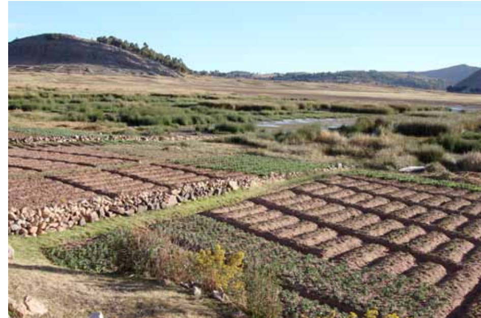
Sistema de camellones en Huancané, Puno

Los paisajes vivos de la costa sur (Paracas-Nazca-Ica), se desarrollaron bajo un sistema de acceso al agua a través de fuentes en el subsuelo, que permitió obtener el recurso hídrico para una agricultura permanente en un ecosistema naturalmente