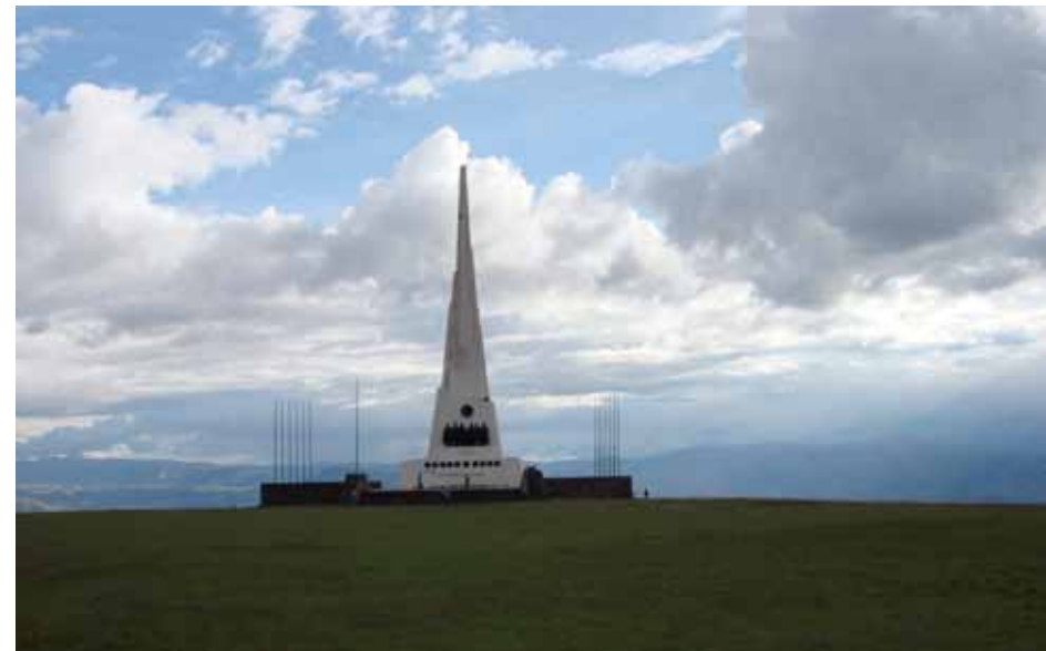
Pampa de la Quinua, Ayacucho

a imágenes santorales, este es el caso del nevado de Pariacaca o las lagunas de las Huingas. Estos han mantenido su sacralidad particular, asociada a un culto prehispánico.