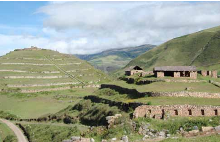
Complejo de Sondor, Apurímac

En el Perú, la principal manifestación de paisajes relictos esta compuesta por bienes inmuebles de patrimonio arqueológico, que expresan tanto ocupación permanente como uso temporal. Existe una diversidad de formas de manifestación del patrimonio arqueológico en un paisaje relicto, muchos de ellos asociados a elementos sagrados del territorio. Así, diversos