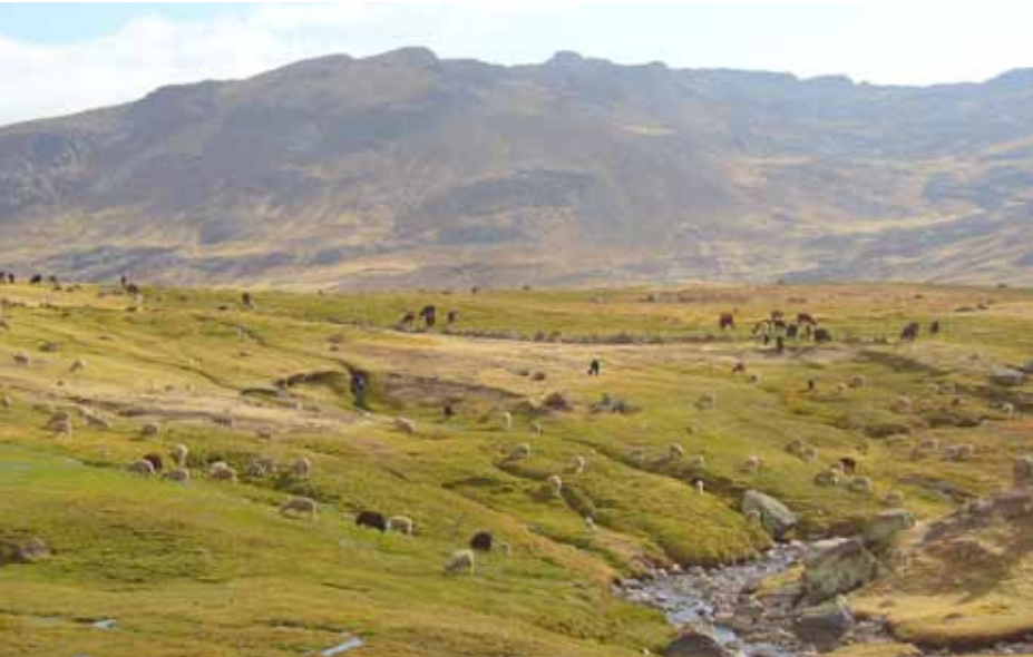
Pastizales en Yauyos, Lima

en zonas rurales, siendo ocupados por sociedades agricultoras y ganaderas que emplean prácticas de aprovechamiento de los recursos, de acuerdo a los diversos pisos altitudinales. Este beneficio continuo se debe al uso sostenible de la tierra, consecuencia de prácticas ancestrales organizativas y tecnológicas.