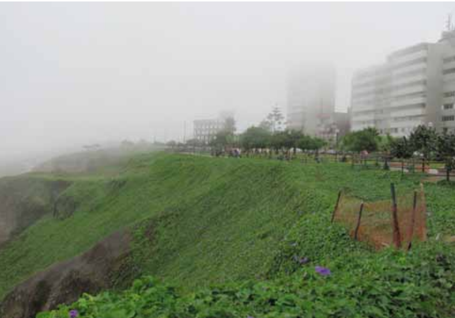
Costa Verde, Lima

Esta categoría supone la existencia de construcciones humanas, estéticamente reconocibles y relacionadas con edificaciones, conjuntos monumentales, etc. En nuestro país esta categoría constituyen los conglomerados urbanos, las plazas, ciudades y áreas de espacios públicos, varias de ellas de origen