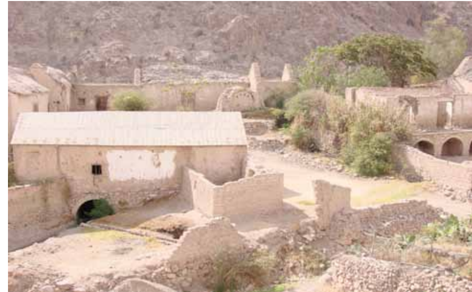
Molinos de Torata, Moquegua

paisajes de orden relicto constituyen espacios sagrados, que en algún momento perdieron significado o culto social.