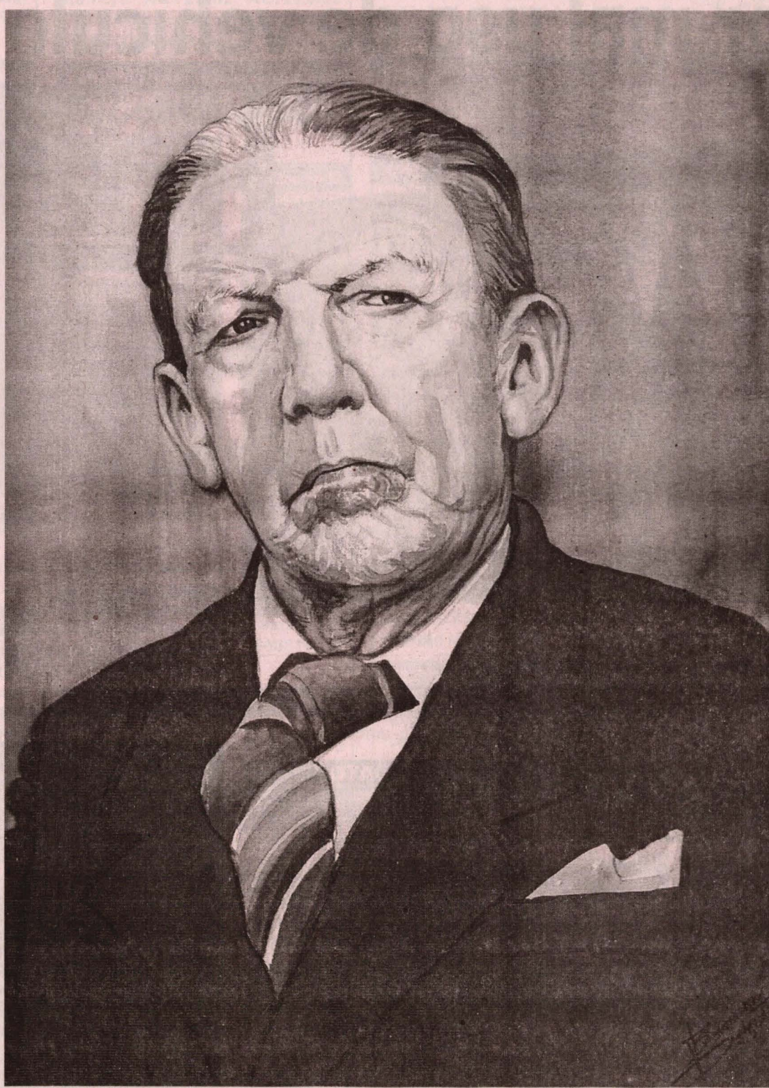
● FRANCISCO MOSTAJO fue uno de los caudillos de la "Arequipa revolucionaria".

dominantes en ese tiempo y protestó por la falta de una verdadera libertad de cultos en el Perú. Eso le creó innumerables problemas y fue marginado por los más conservadores y religiosos.