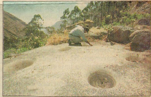
Esta es otra roca tallada con cinco huecos que aparentemente corresponde a un calendario astronómico inca.

tros alimentos", afirmaron los comuneros.