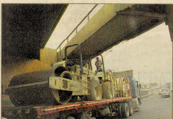
EN DELITO FLAGRANTE. El camión no pasa y la pala mecánica se puede dañar. Los operarios del tráiler deciden romper parte de la infraestructura.

no les importó arremeter, comba en mano, contra una viga de concreto armado para que el pesado vehículo continuara con su viaje.