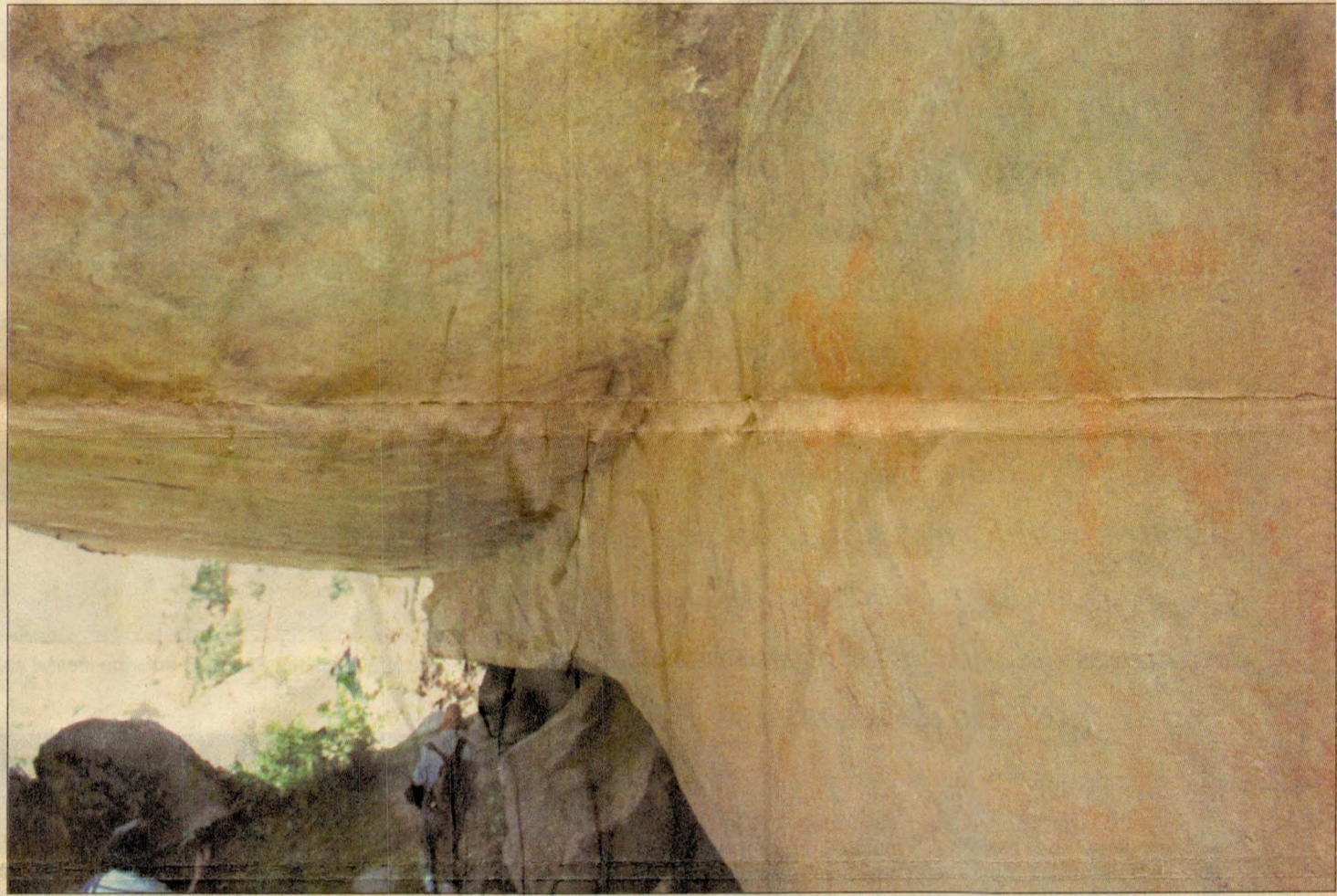
En las pinturas rupestres que se observan a la vera del camino preínca en la quebrada de Tupe existen representaciones de figuras humanas, así como camélidos andinos.

"Las andenes y sistemas de canales en los cuales cultivamos nuestros productos han sido construidos por nuestros antepasados. Nosotros sólo estamos aprovechando esta maravillosa obra para cosechar nues-