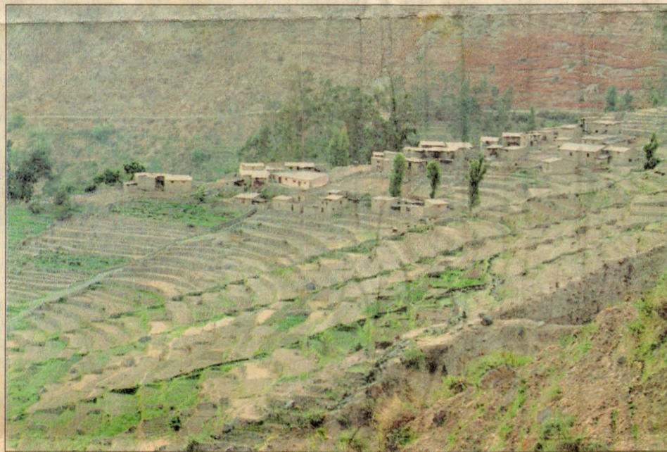
El anexo de anexo de Ayza se encuentra sobre andenerías incaicas que actualmente vuelven a ser usadas por los pobladores.