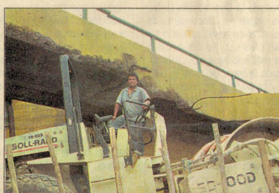
LA VIGA DESTROZADA. Aproximadamente la 1:30 p.m., la destrucción continúa. Una cámara de El Comercio incomoda a los 'destruidores' del puente Alipio Ponce, quienes esconden la comba.