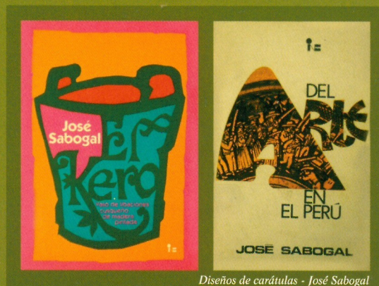
Diseños de carátulas - José Sabogal