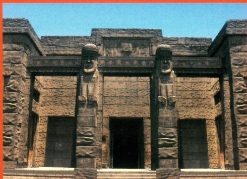
Fachada del Museo Nacional de la Cultura Peruana