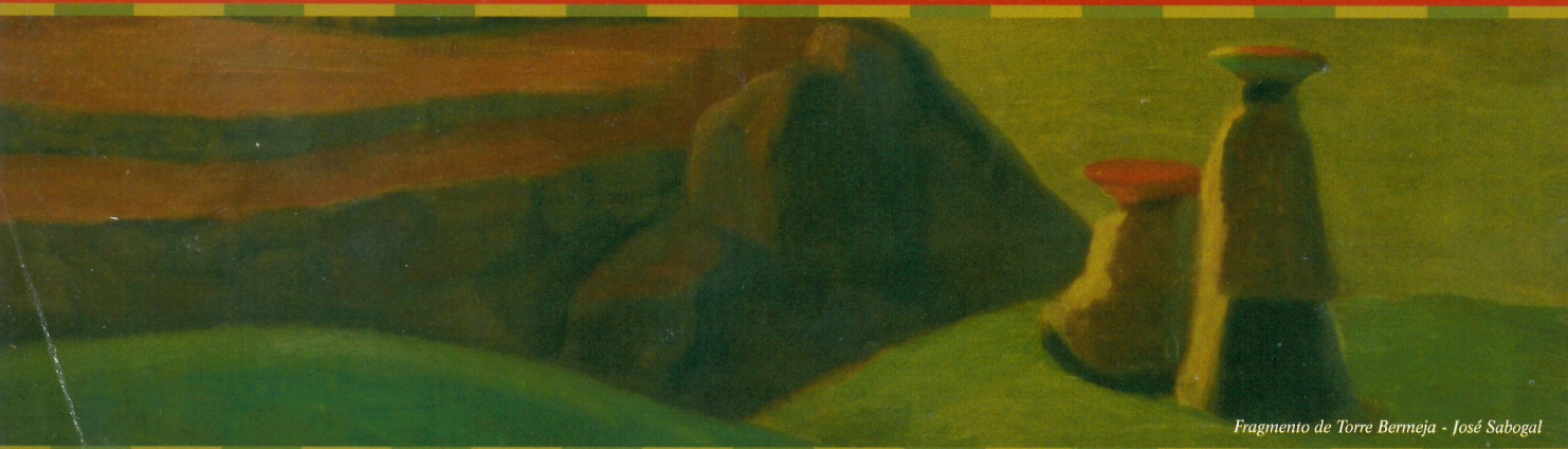
Fragmento de Torre Bermeja - José Sabogal