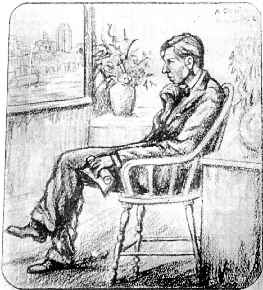
JOSE CARLOS MARIATEGUI - EN ROMA.