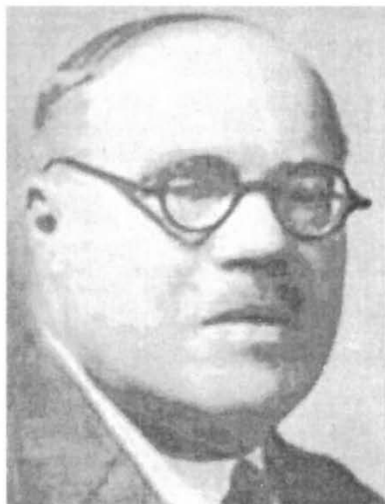
Francisco García Calderón

En El Perú Contemporáneo el lector puede percibir rápidamente el sentido integral que su autor quiere imprimir a sus páginas. De igual modo, dos décadas después, en 1928, Mariátegui, joven también, con 32 años de edad, publicaría la que sería la obra más importante de nuestro pensamiento social y político: los 7 ensayos. Mariátegui y García Calderón tienen algunos rasgos comunes que los aproximan. Uno, se trata de dos autores precoces; otra, es la admiración por la cultura francesa; otra más, la predilección del ensayo como vínculo de