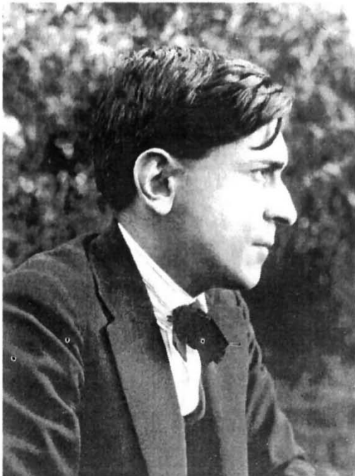
José Carlos Mariátegui

En diferentes oportunidades, Jorge Basadre fue enfático en señalar que 7 Ensayos de Interpretación de la Realidad Peruana de José Carlos Mariátegui tiene un antecedente directo en el libro que Francisco García Calderón escribió en francés y publicó en París, El Perú Contemporáneo . En 2007 se cumple un siglo de este libro, uno de los fundadores del pensamiento social peruano, y que se inscribe en el objetivo de renovación de los estudios peruanistas que había iniciado la generación del novecientos, luego de la derrota sufrida en la Guerra del Pacífico. Con 24 años apenas, García Calderón exhibía una prodigiosa cultura humanista, y no oculta la leal admiración que sentía por la producción intelectual francesa.