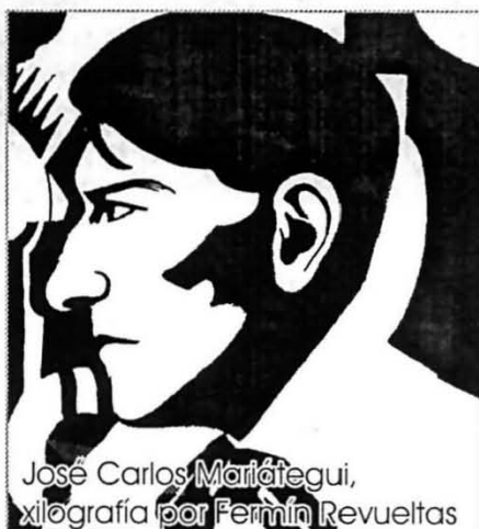
José Carlos Mariátegui, xilografía por Fermín Revueltas