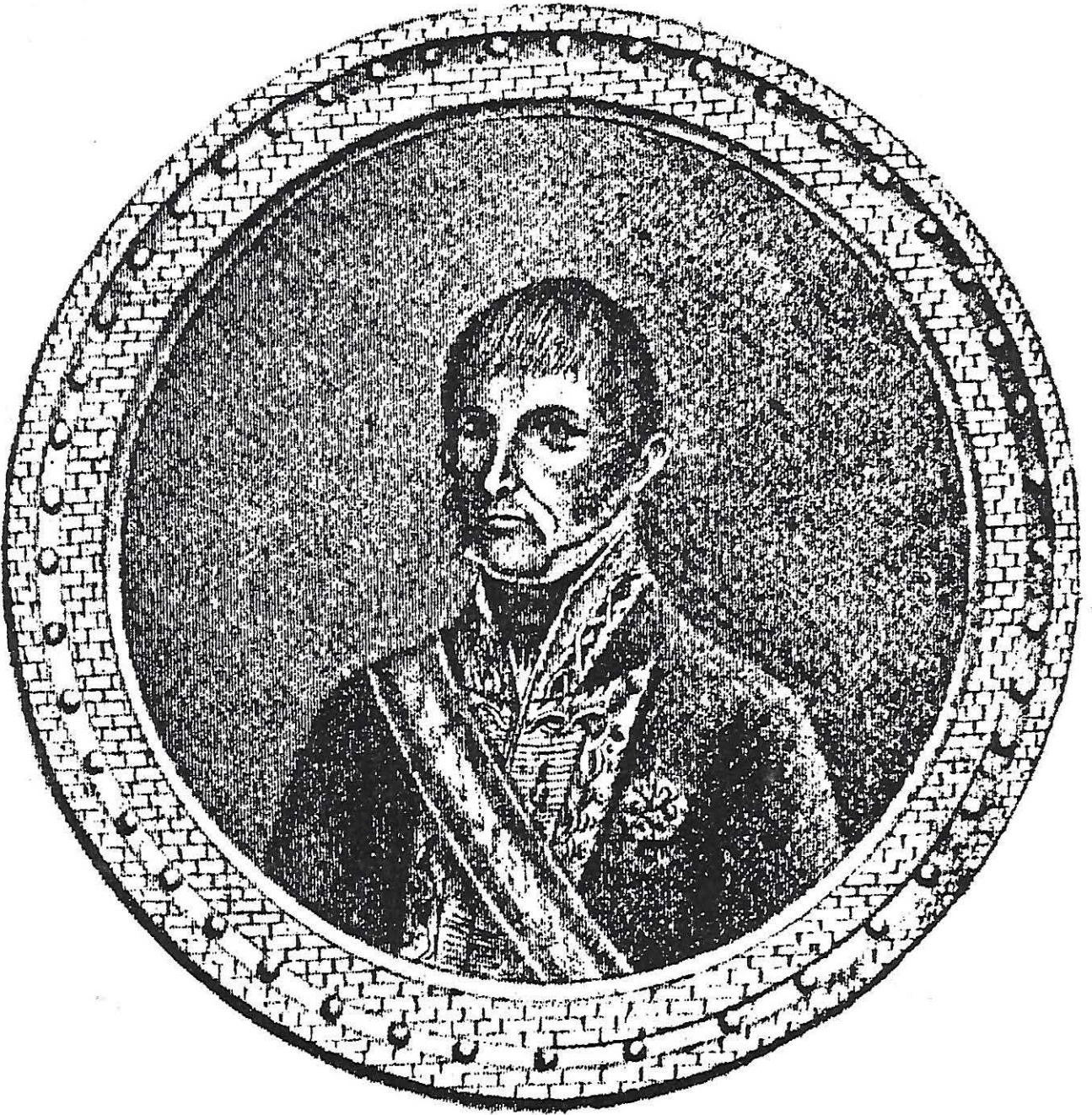
D. Joaquín Pezuela, penúltimo Virey del Perú, según el grabado de Cabello (1,816)