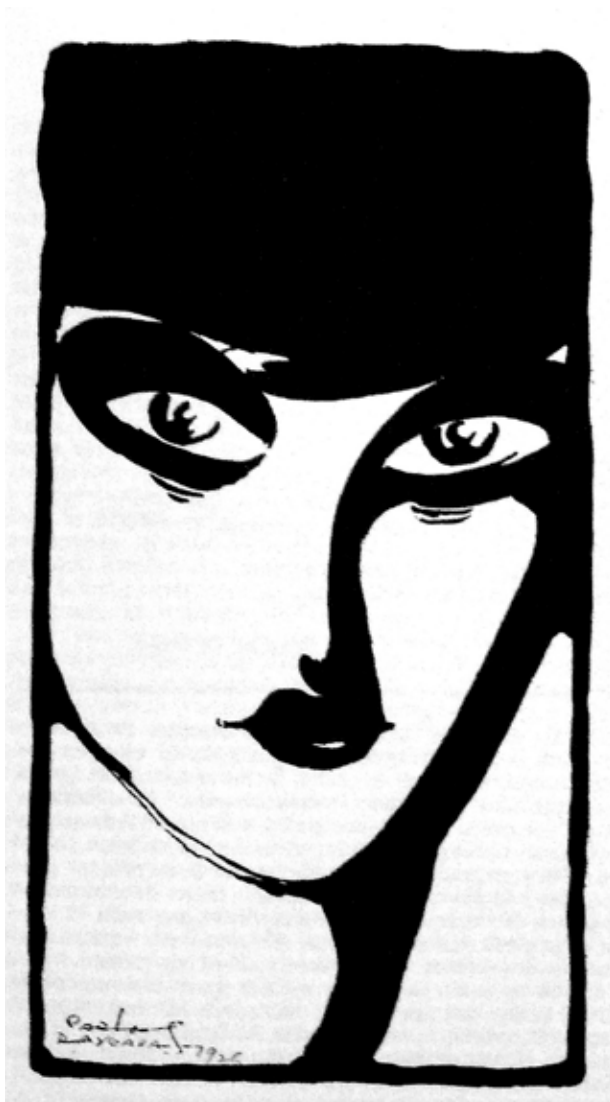
Ilustración de Carlos Raygada

En su discurso encontramos de manera recurrente opiniones sobre la relación entre los sexos, la maternidad, la política y la literatura. La referencia a