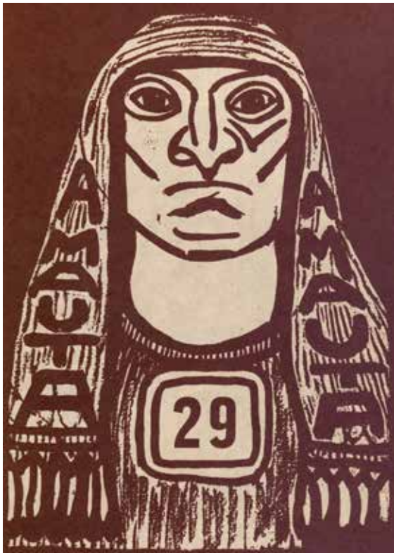
Portada de la Revista Amauta N° 29