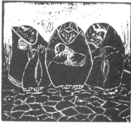
"Hilanderas", madera de Julia Codesillo

tado natural de acaparamiento de las cosas excelentes y puras del mundo. Para María Wiese, constituye un derecho la posibilidad de soñar y ser amados. Y, sin embargo, dice, casi todos los métodos trazados para estudiar al niño carecen de fuego vital, son rígidos análisis hechos sin la "inteligencia del corazón".