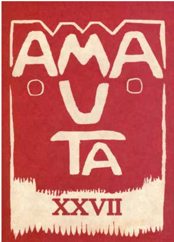
Portada de la Revista Amauta N° 27

En sus publicaciones, la gráfica ocupa un papel importante ya que significa la creatividad de nuevas imágenes que se basan en el mundo andino, el modernismo y vanguardismo. Esta visión deja una mezcla de estilos diferentes en los diseños por lo que se podría descifrar su naturaleza ecléctica.