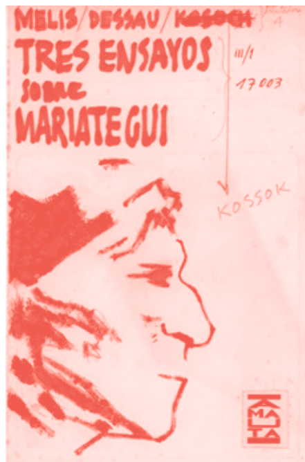
Boceto de portada para la publicación: "Mariátegui: tres estudios".