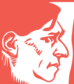
José Sabogal José Carlos Mariátegui ca. 1947, Xilografía.