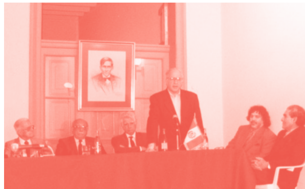
César Miró, Estuardo Nuñez, Leopoldo Zea, Antonio Melis, Roland Forgues y Anibal Quijano, durante la inauguración de la Casa Museo José Carlos Mariátegui, Lima, junio 1994.