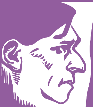
José Sabogal José Carlos Mariátegui ca. 1947, Xilografía.

“Los pueblos de América española se mueven en una misma dirección. La solidaridad de sus destinos históricos no es una ilusión de la literatura americanista. Estos pueblos, realmente, no sólo son hermanos en la retórica, sino también en la historia...”