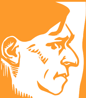
José Sabogal José Carlos Mariátegui ca. 1947, Xilografía.