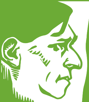
José Sabogal José Carlos Mariátegui ca. 1947, Xilografía.

El espíritu del hombre es indivisible; y yo no me duelo de esta fatalidad, sino, por el contrario, la reconozco como una necesidad de plenitud y coherencia. Declaro, sin escrúpulo, que traigo a la exégesis literaria todas mis pasiones e ideas políticas, aunque, dado el descrédito y degeneración de este vocablo en el lenguaje corriente, debo agregar que la política en mí es filosofía y religión.