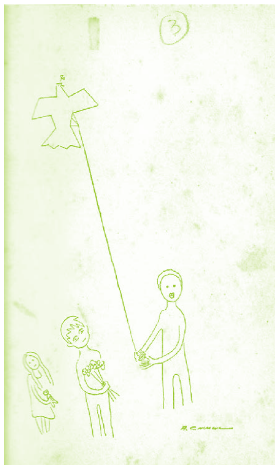
Dibujo de Arturo Corcuera, para el poema el amor Libro Gidomat, Pág. 31, poesía en prosa, Lima -1964. Juan Cristóbal