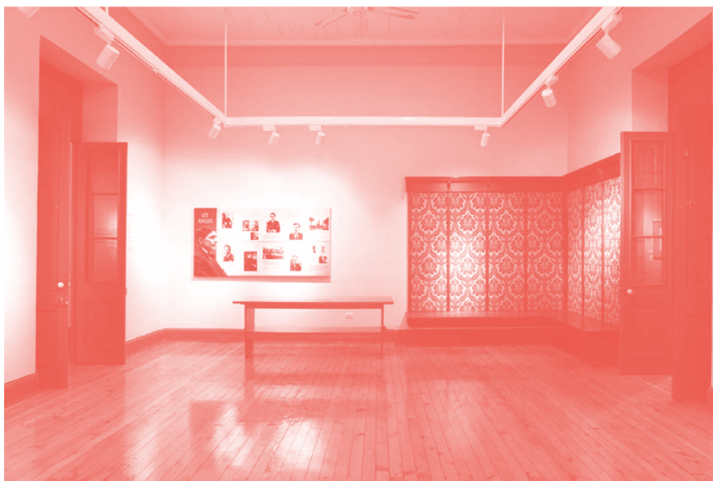
Espacio de la Casa Rincón Rojo.