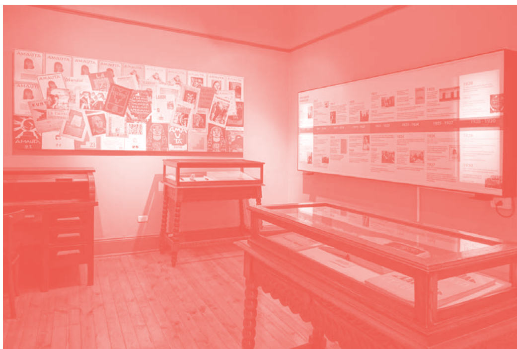
Esta habitación servía de depósito para las publicaciones de Mariátegui.