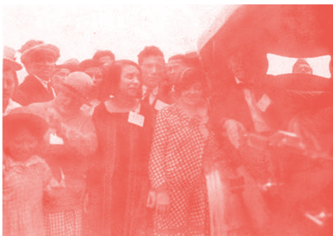
José Carlos Mariátegui en la Fiesta de la Planta en Vitarte.