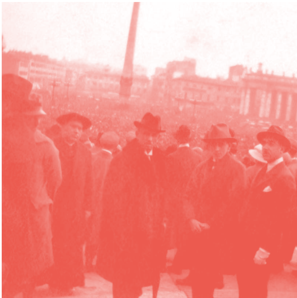
José Carlos Mariátegui, con amigos en el Vaticano.