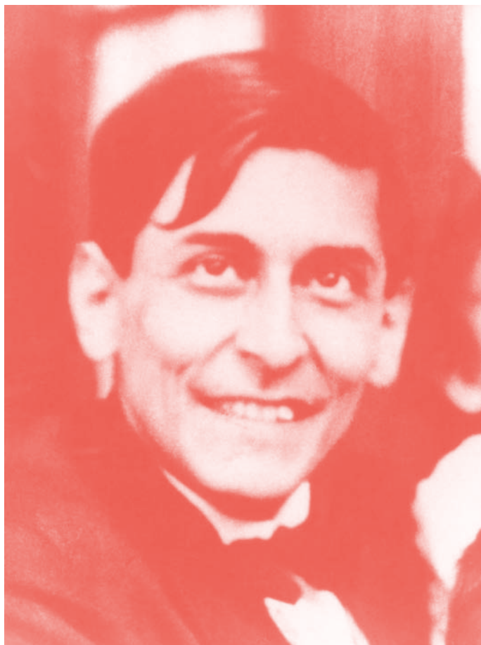
José Carlos Mariátegui.

Si queremos aludir desapasionadamente el tema de sus ideas políticas; debiéramos situarnos en tres momentos de su vida y de su obra. El primero, por cierto tiene que ver con sus inicios, lo que podríamos llamar su definición cardinal, su toma de posesión ante el mundo y la vida. Eso ocurrió en 1917, cuando José Carlos contaba 23 años. La revolución rusa, cambió su percepción radicalmente. a partir de ese fenómeno, hacia enero de 1918, pudo decir categóricamente "asqueado de la política criolla, me oriente resueltamente hacia el socialismo". Pero no fue el socialismo libresco, de academia, el que lo sedujo. Fue el revolucionario, el de la lucha social, el de la confrontación de clases y el de la conciencia obrera. Por eso, su identificación, estuvo estrechamente vinculada a su actitud ante el accionar de los trabaja-