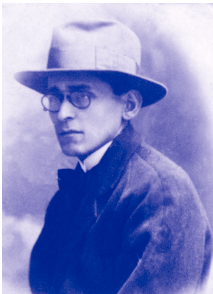
José Carlos Mariátegui.

Con José Carlos Mariátegui los peruanos pudimos conocer la realidad de la escena mundial y peruana en una época donde las ideas oscurantistas primaban en el país. La posibilidad de pensar el Perú de una manera distinta, gracias a los dos primigenios libros del Amauta y a su labor periodística, nos permitió una transformación truncada por cerrados dogmatismos contrarios a la absoluta apertura de ideas que él propugnaba. El Amauta prosigue siendo un principio y un fin, una meta por alcanzar en el Perú.