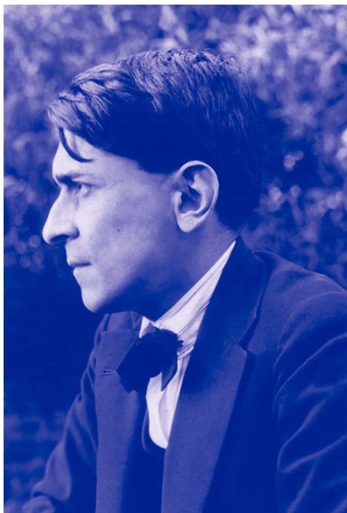
José Carlos Mariátegui.

(*) Fragmento del "Estudio Preliminar" de Invitación a la vida heroica. José Carlos Mariátegui. Textos esenciales. Lima, Fondo Editorial del Congreso del Perú, 2005. pp. XXIII-XXXVI.