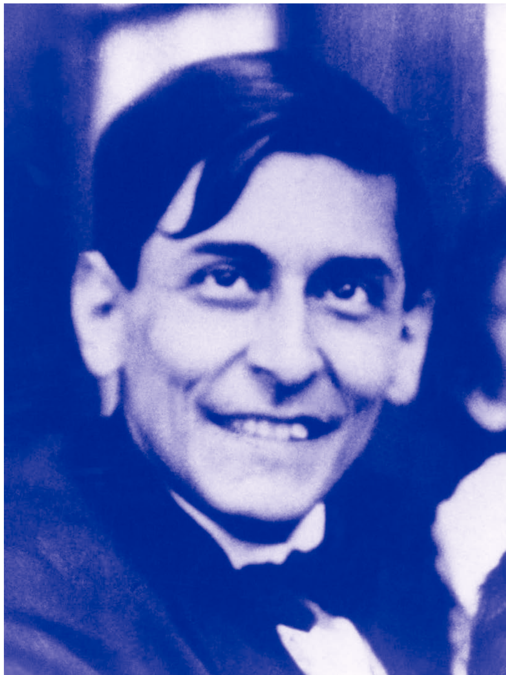
José Carlos Mariátegui.