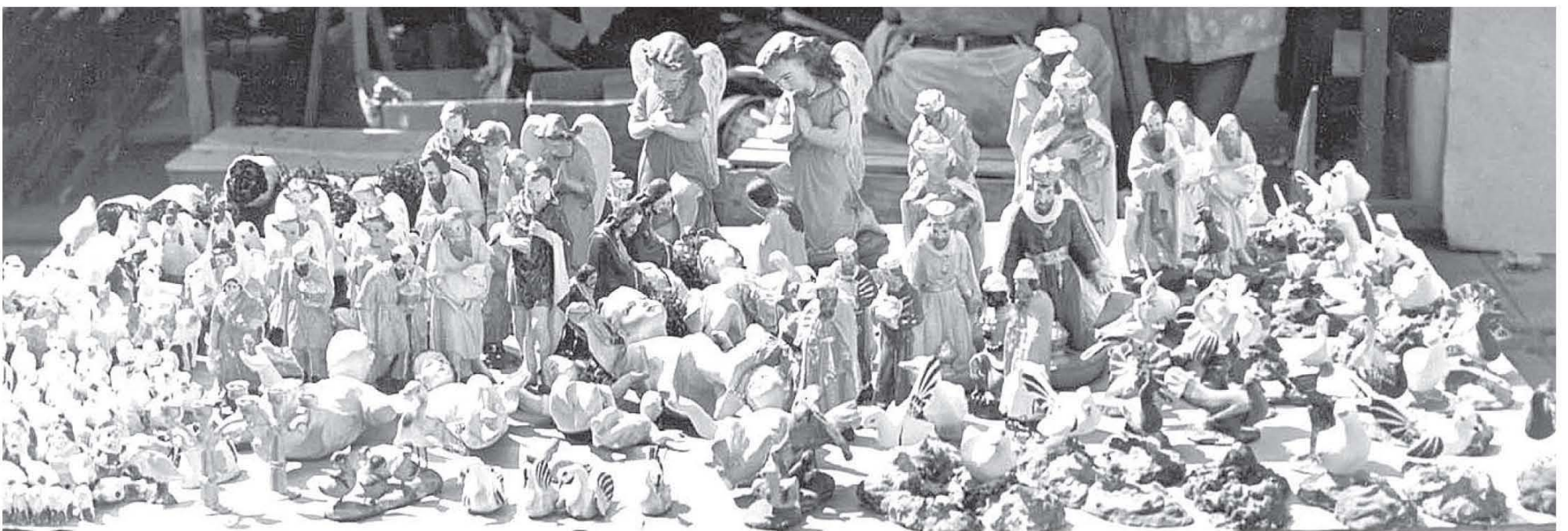
• NAVIDAD Lima 1940.