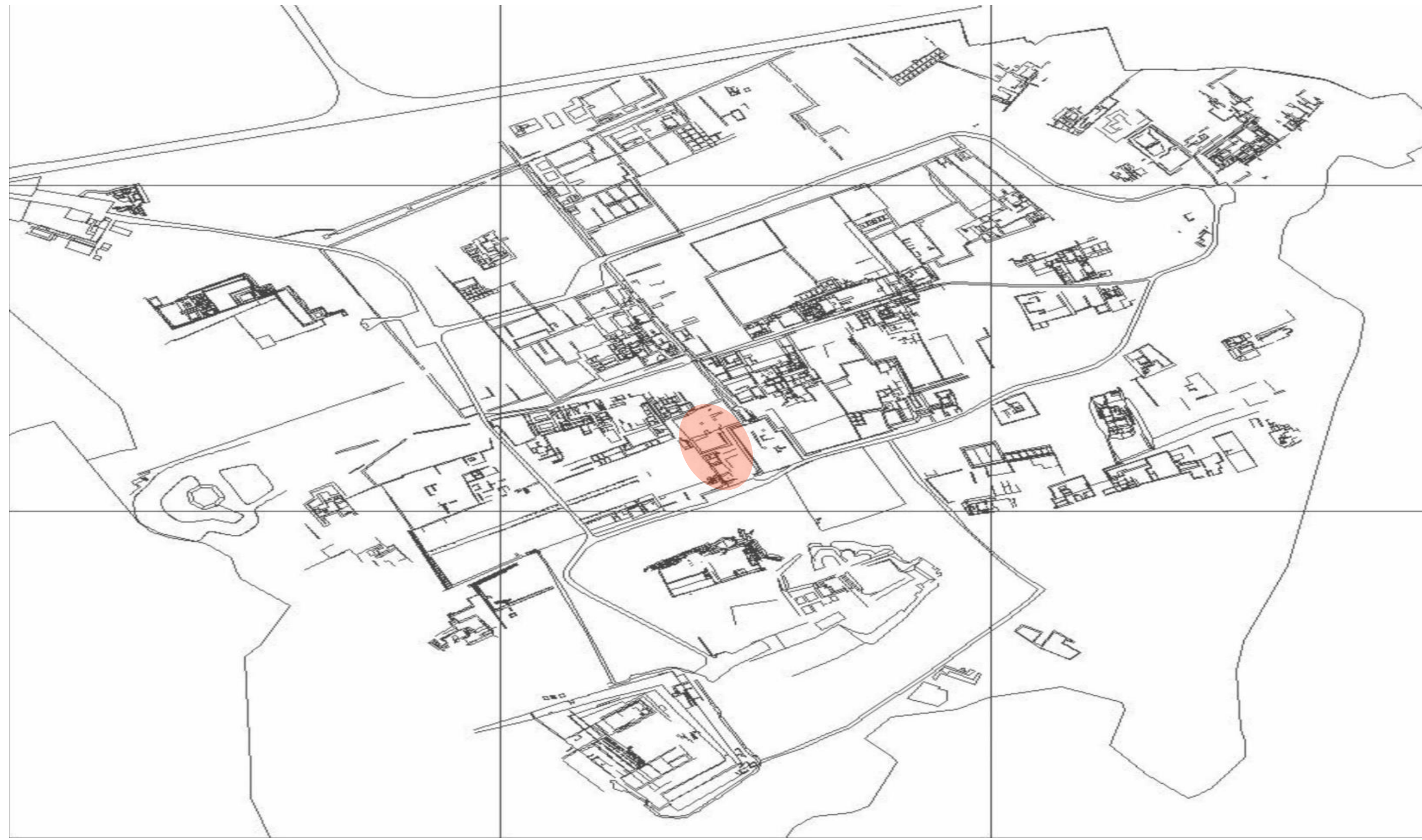
Ubicación de la PCR 13 dentro del santuario arqueológico de Pachacamac.

La muestra corresponde a tres partes anatómicas que conservan tejido momificado y, presentan tatuajes lineales, geométricos y zoomorfos. Para el estudio de estos tatuajes se utilizó la fotografía digital infrarroja y el análisis de microscopía electrónica de barrido (MEB).