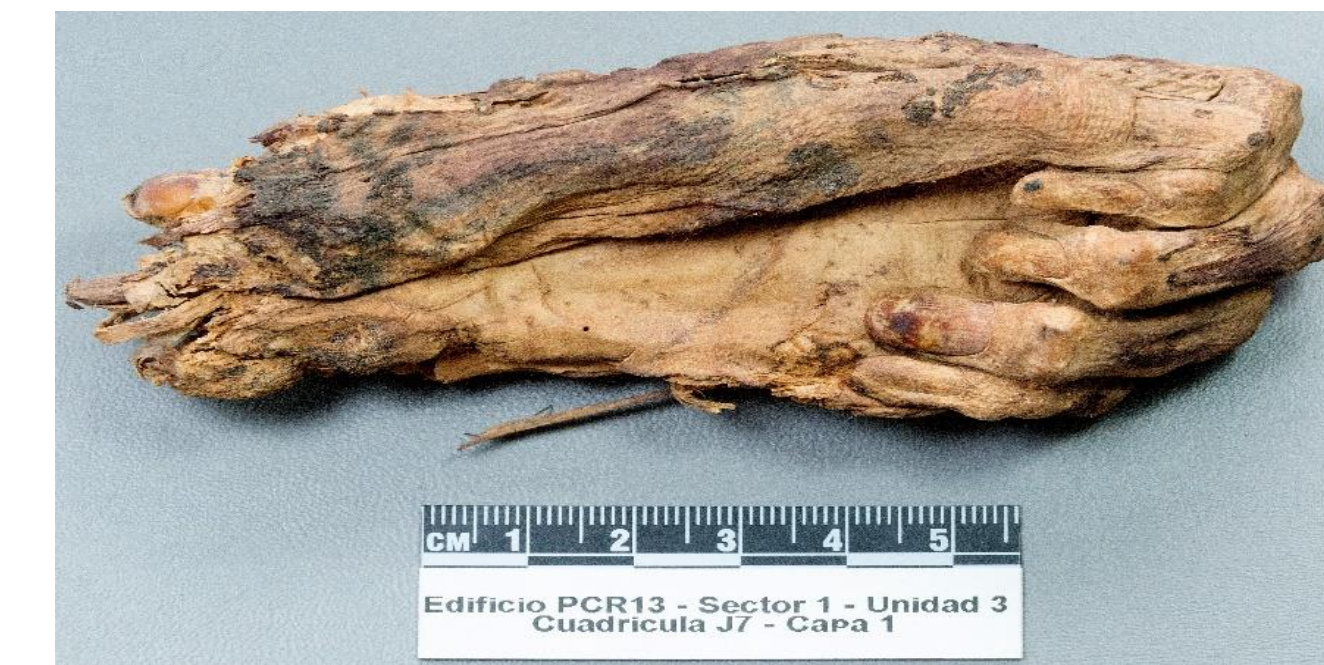
Vista general de la mano izquierda