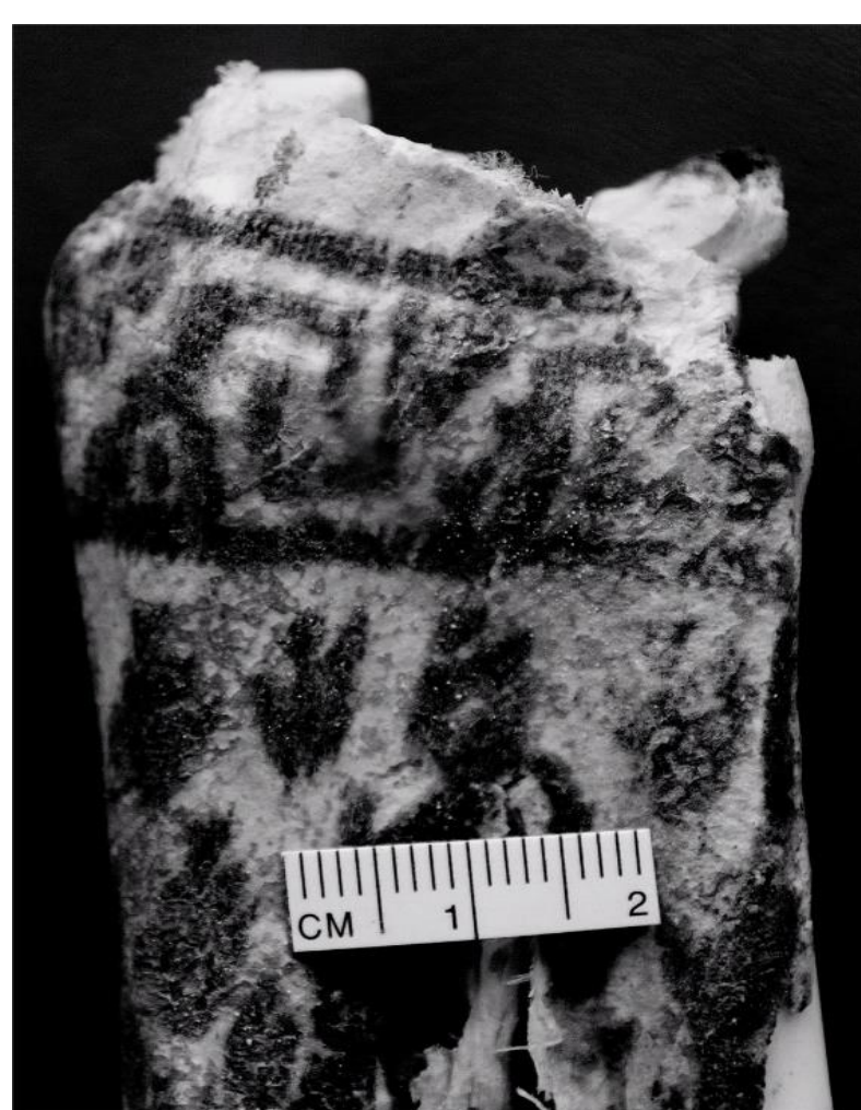
4 a y b Fotografía infrarroja del antebrazo derecho. Se observan el diseño de peces, líneas y figuras escalonadas

Queda pendiente comparar estos diseños con los presentes en la cerámica, textiles y otros soportes, para determinar si son parte de una tradición local o foránea.