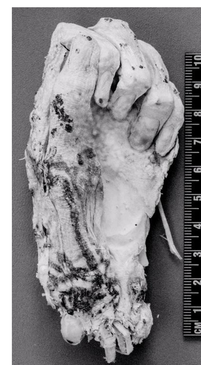
5 a y b. Fotografía infrarroja de la mano izquierda. Se observan el diseño de líneas en el dedo pulgar