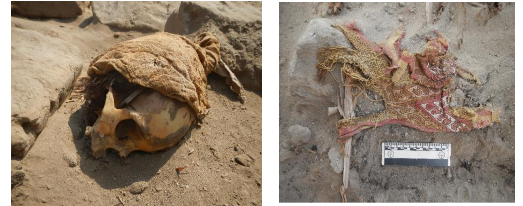
1. Vista general del patio delantero de la PCR 13 2. Cráneo de un individuo adulto recuperado de las excavaciones 3. Textil con decoración de la Capa 1.