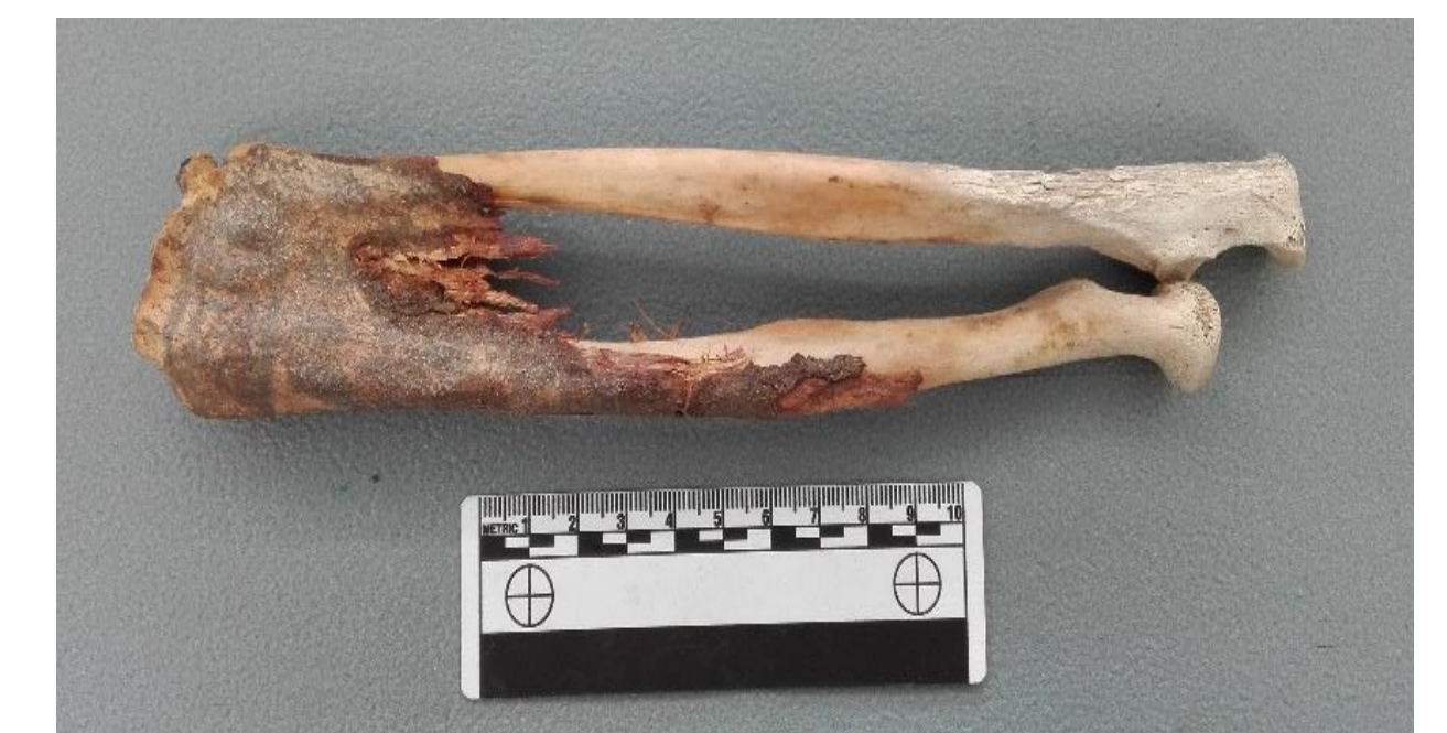
Vista dorsal del antebrazo derecho.