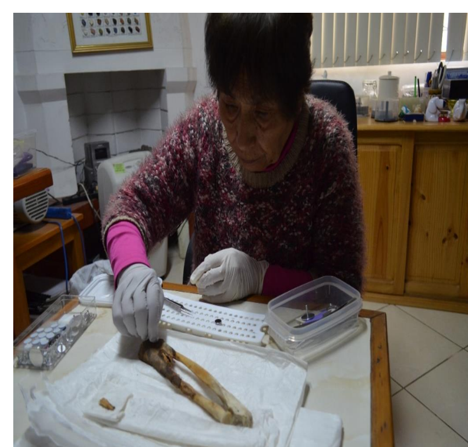
Toma de muestras del tejido momificado del antebrazo derecho

La composición química elemental del pigmento es de origen orgánico y durante los análisis se identificó la presencia de "cinabrio" (compuesto químico) que podría estar ligado al tratamiento mortuario de los individuos y no como parte del compuesto del tinte del tatuaje.