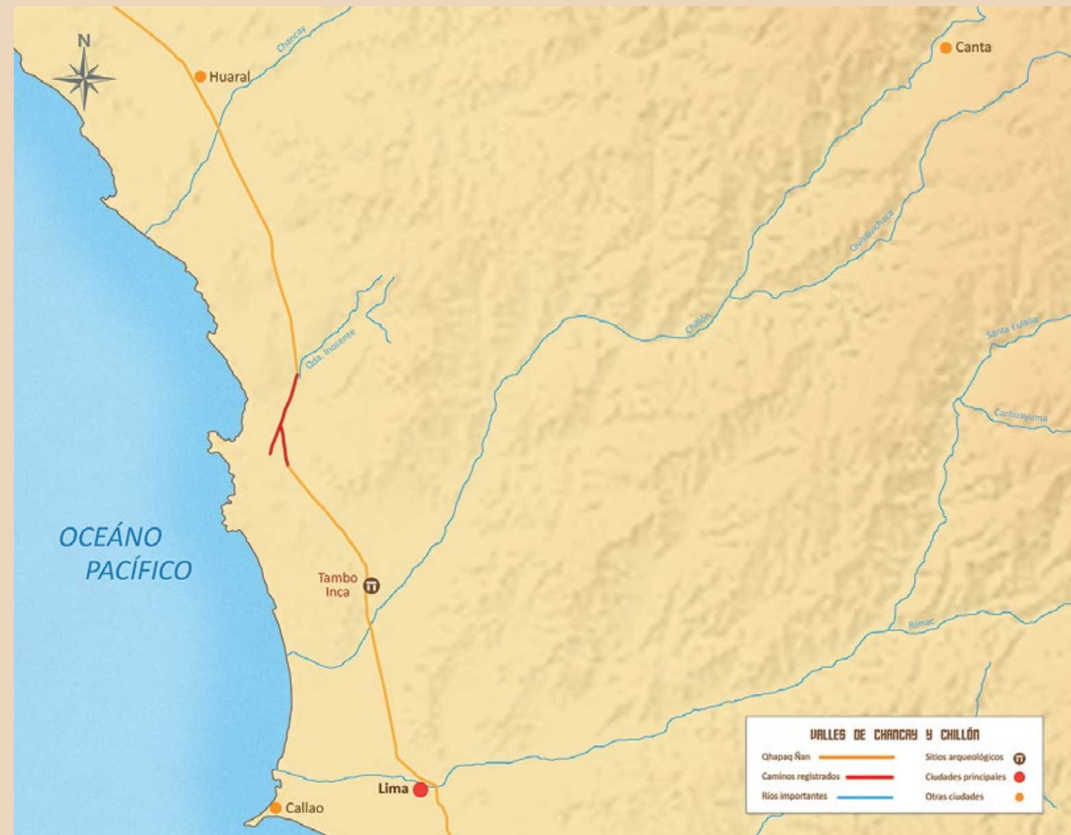
Camino de los Llanos entre los valles de Chancay y Chillón, Lima