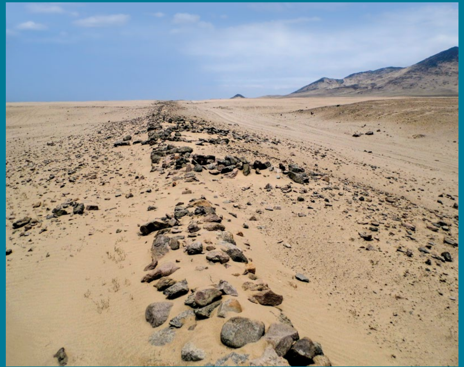
Camino de los Llanos en pampa El Alto, que bordea las estribaciones del cerro Campana, principal adoratorio Chimú entre los valles de Chicama y Moche, La Libertad