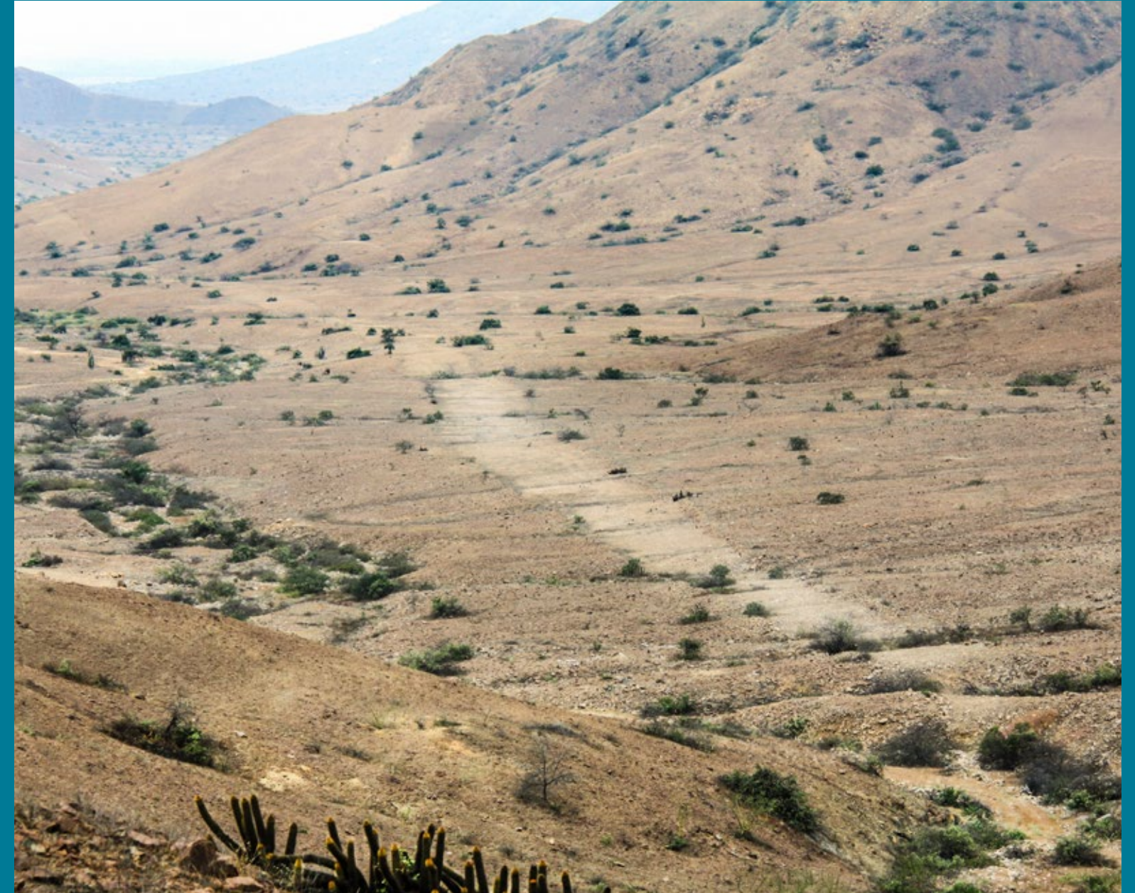
Camino de los Llanos en un paso natural entre los cerros Plácido, cerro Cóndor y cerro El Gigante. Ferreñafe, Lambayeque