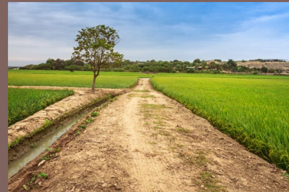
Camino en Playa Hermosa, ubicado sobre la margen izquierda del río Tumbes