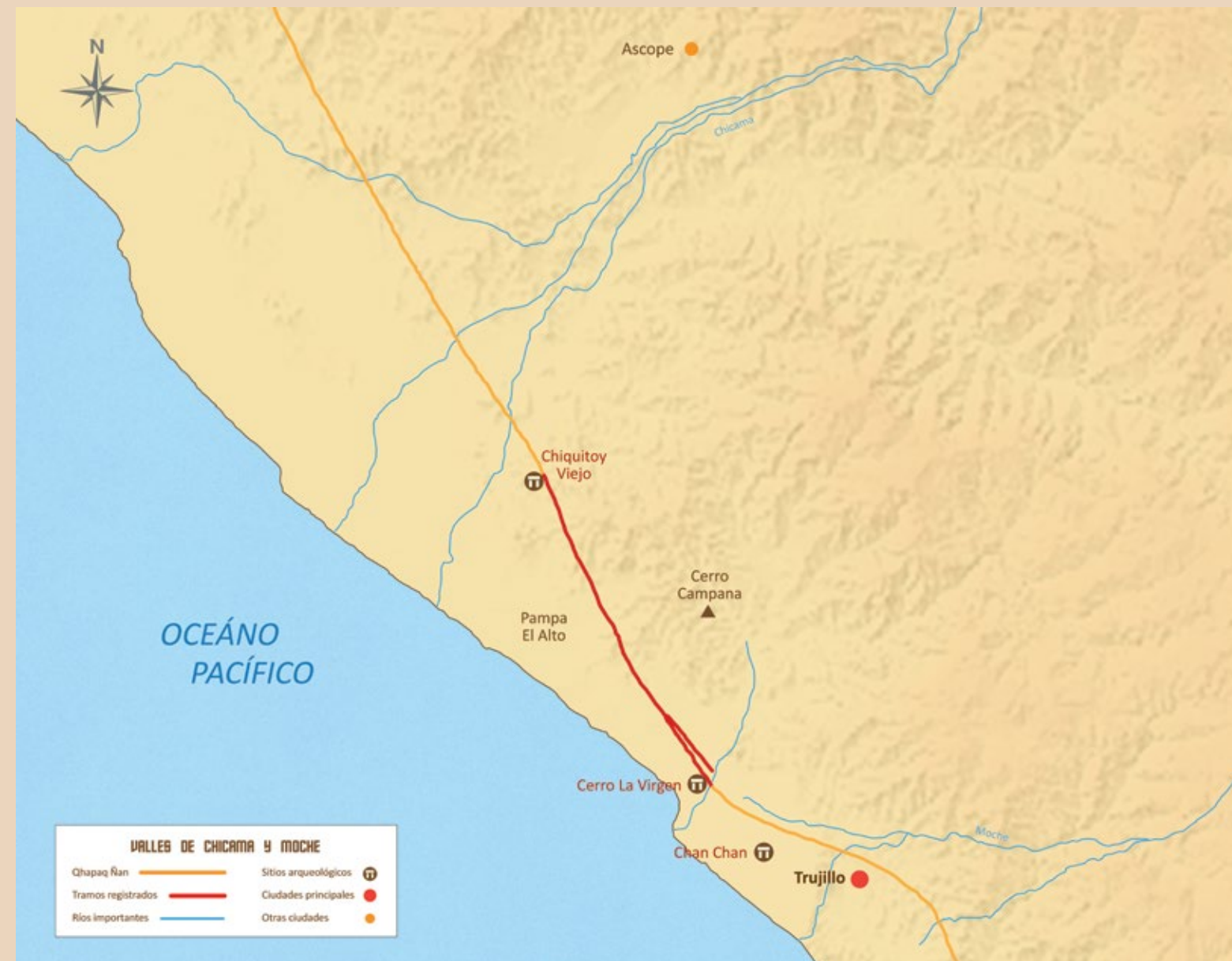
Camino de los Llanos entre los valles de Chicama y Moche, La Libertad