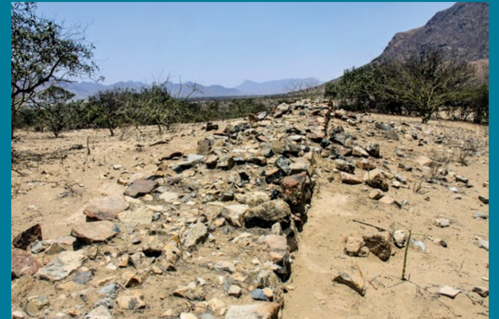
Muro del Tambo Real, Lambayeque