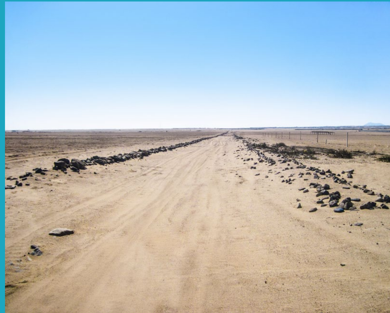
Camino de 25 metros de ancho definido por muros laterales. Quebrada Río Seco, La Libertad