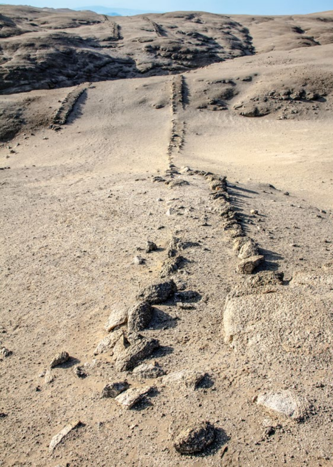
Detalle de muro del camino en cerro Antival, Casma, Ancash