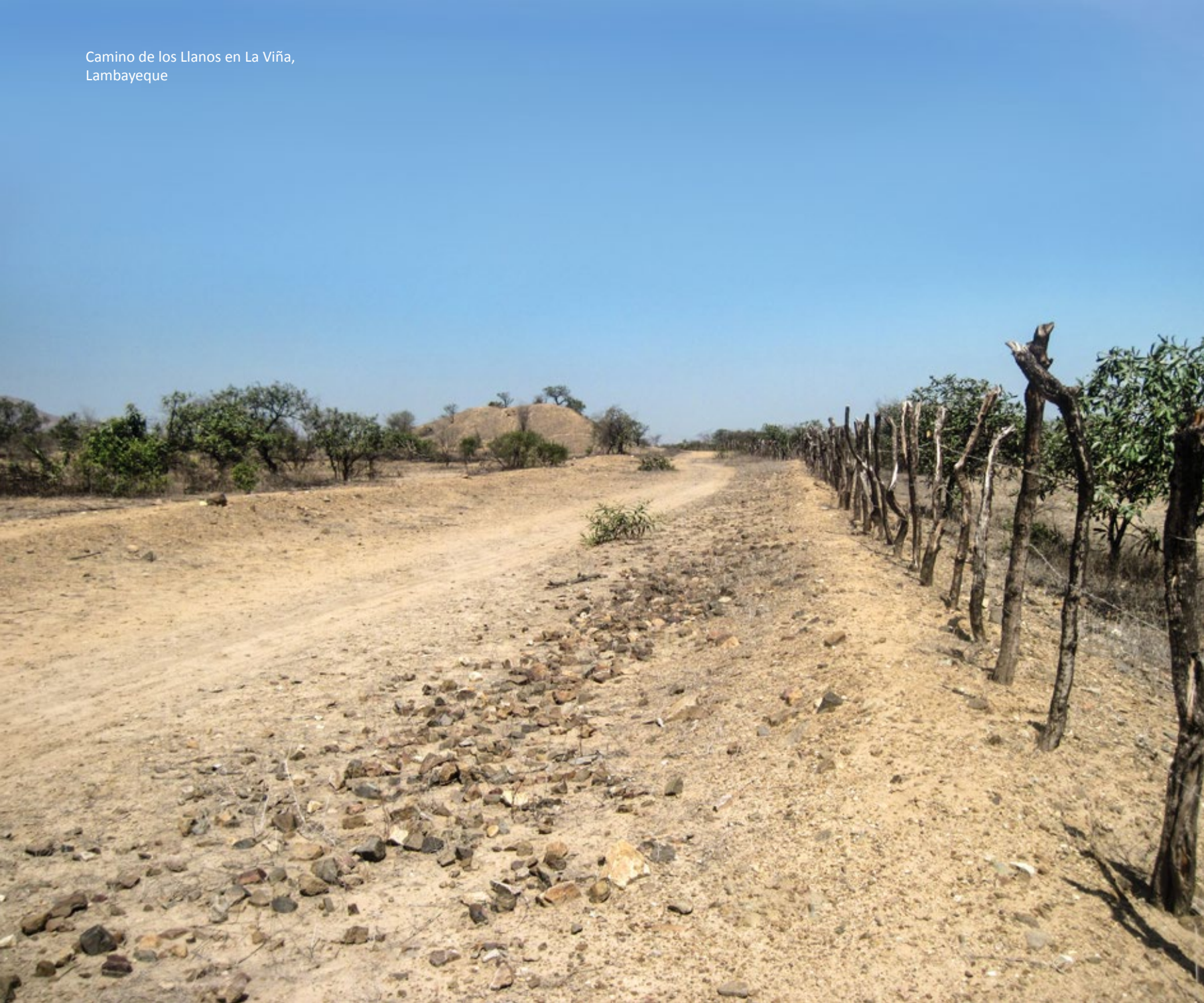
Camino de los Llanos en La Viña, Lambayeque