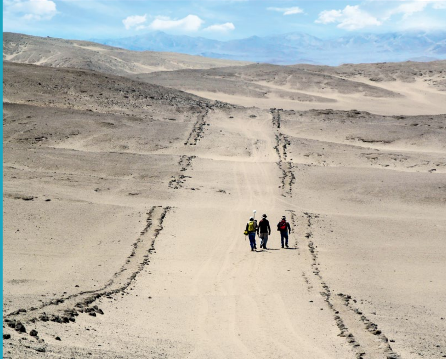
Calzada del Camino de los Llanos encerrado por muros en cerro Antival, Casma, Ancash