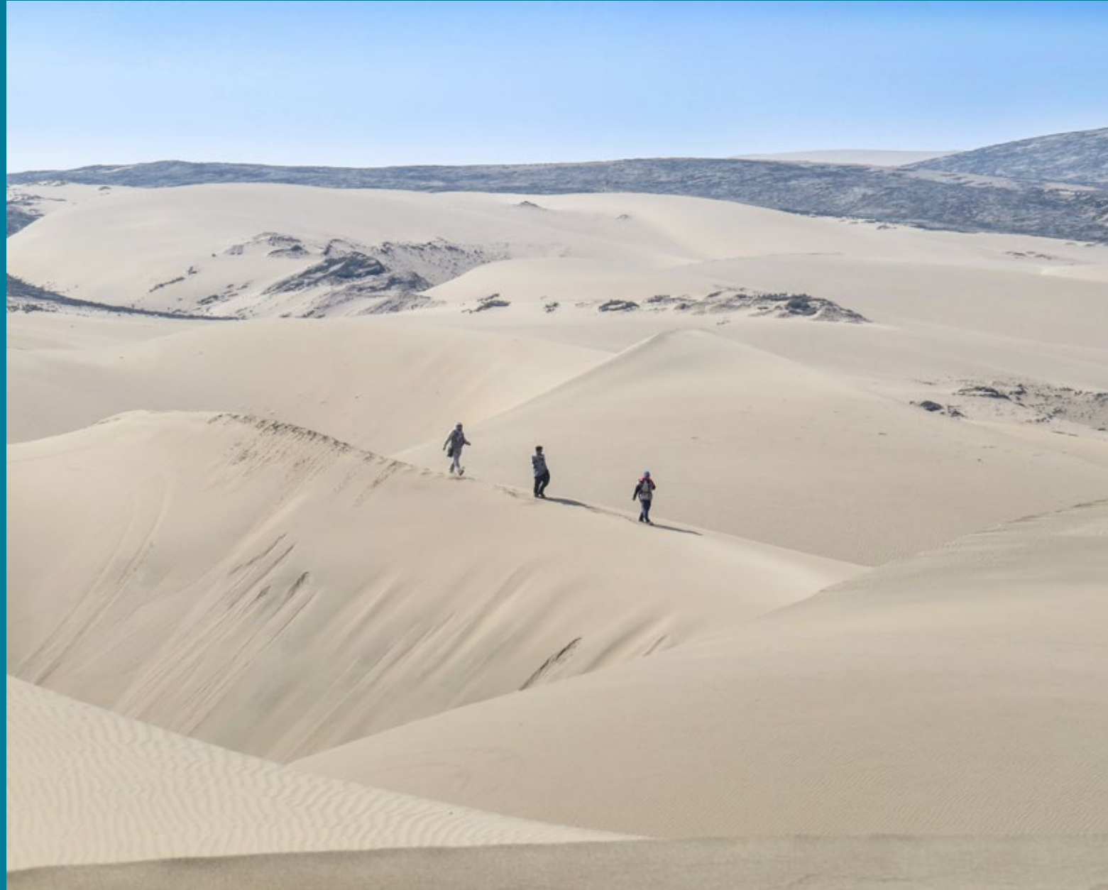
Parte de la ruta del camino cerca de quebrada Inocentes, que comunicaba Ancón con el valle de Chancay, hoy cubierto por médanos.