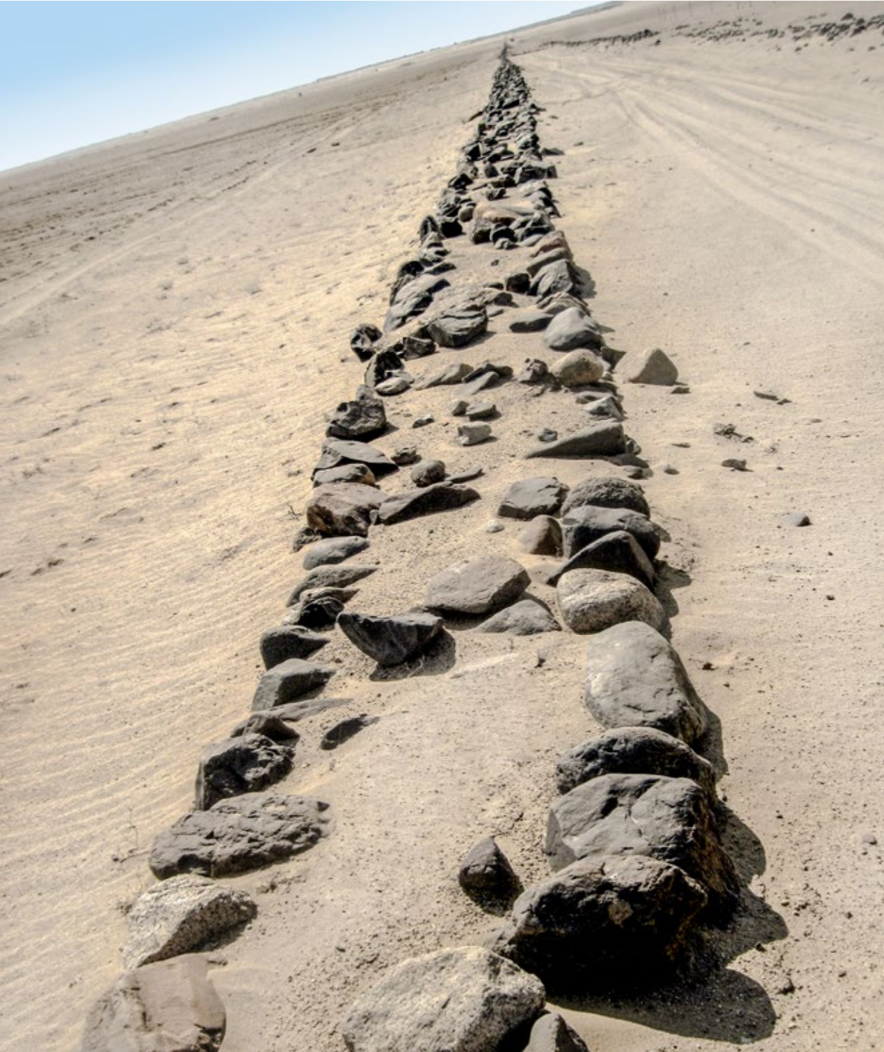
Detalle del muro que delimita los bordes del camino entre Chicama y Moche, La Libertad