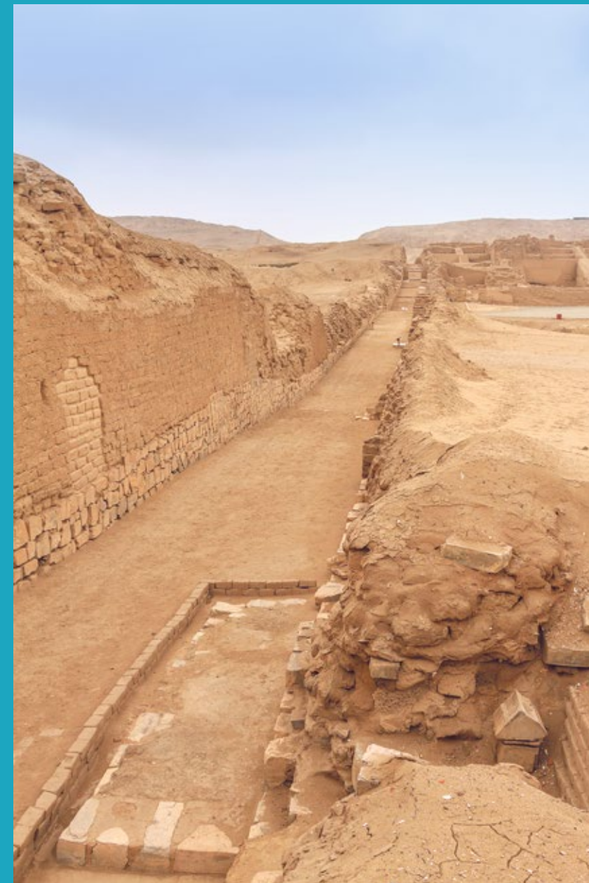
Calle Norte-Sur en Pachacamac, Lima

La referencia escrita más temprana del camino que ingresa al Santuario de Pachacamac es narrada por Miguel de Estete (1533), quien acompañó como veedor a Hernando Pizarro custodiado por una comitiva de hispanos y dignatarios incas, con el objetivo de acelerar el envío del oro del rescate de Atahualpa. Hoy se conserva la calle Norte-Sur por donde ingresaban los peregrinos al Santuario. Se ubicaba en la confluencia de los dos caminos, el Camino de los Llanos y el camino transversal a la sierra. A través de esta calle, los peregrinos podían ingresar a los conjuntos de pirámides con rampa y participar en los rituales que eran realizados en las plazas del Santuario.