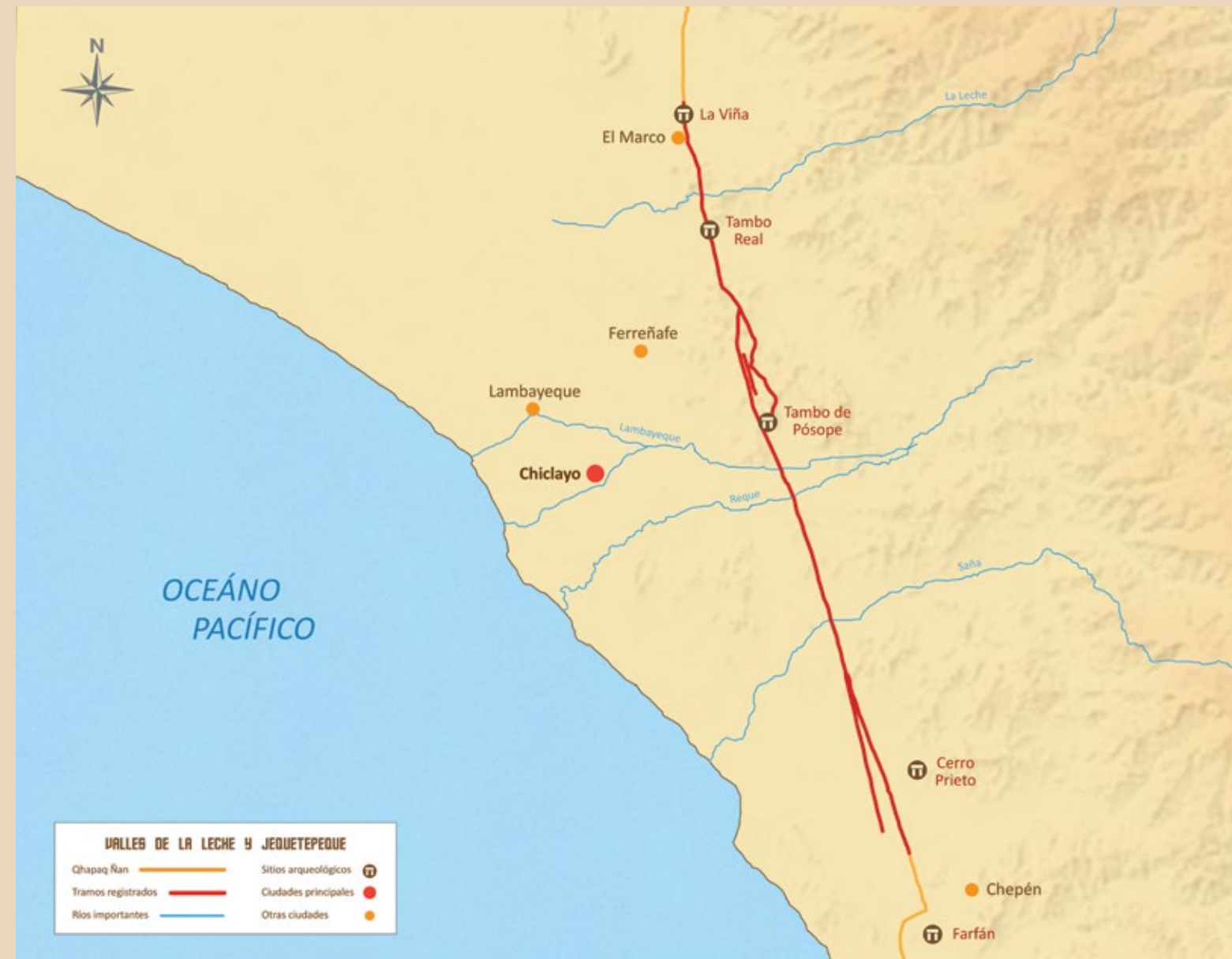
Camino de los Llanos entre los valles de La Leche y Jequetepeque en el departamento de Lambayeque

Desde el Centro Poblado El Marco, el camino se proyectaba hacia el sur para cruzar el río La Leche y continuar hacia Tambo Real, asentamiento de gran extensión que funcionó como un gran centro de producción de alfarería Inca-Chimú y como centro de control de los caminos transversales que descendían del valle alto de La Leche. En Tambo Real el camino se proyecta hacia el sur, conservando elementos formales como una calzada de tierra de aproximadamente 8 metros de ancho con muros laterales y muros de contención que se adaptan al relieve llano y desértico del terreno costero. Uno de los caminos transversales que salía de Tambo Real se proyectaba de este a oeste, desde el complejo arqueológico de Batan Grande hacia Túcume.