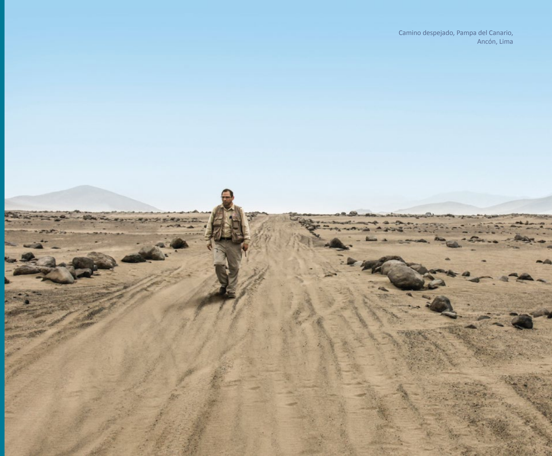
Camino despejado, Pampa del Canario, Ancón, Lima