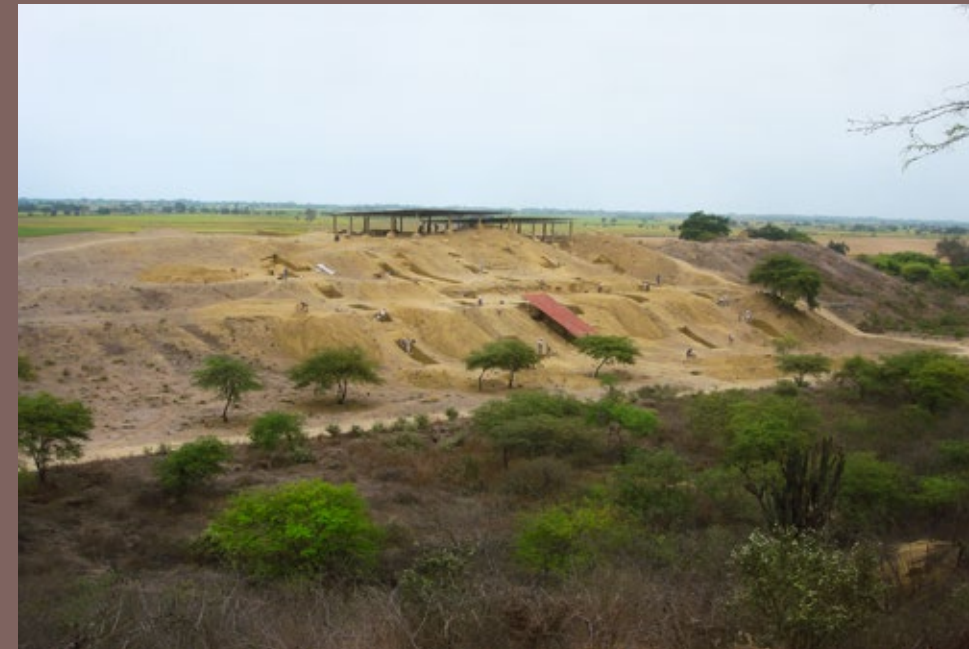
Vista del centro administrativo inca Cabeza de Vaca, Tumbes