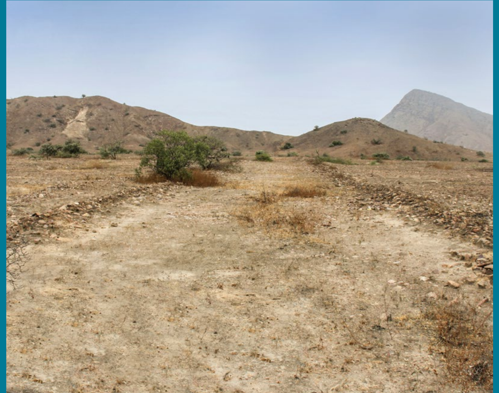
Camino delimitado con muros laterales en la quebrada Río Loco, Lambayeque