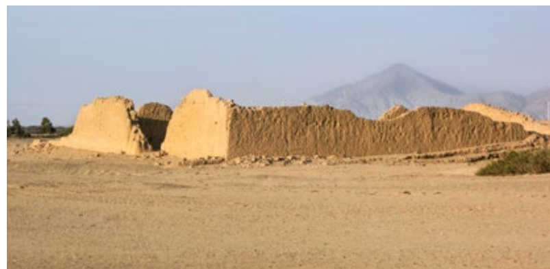
Estructura principal de Chiquitoy Viejo, asociado al camino. Valle de Chicama, La Libertad

En pampa El Alto, el camino adquiere un ancho promedio de 15 metros y alcanza hasta 25 metros en el extremo norte del valle de Moche, donde junto a un camino secundario de 8 metros de ancho, ingresa a Cerro la Virgen.