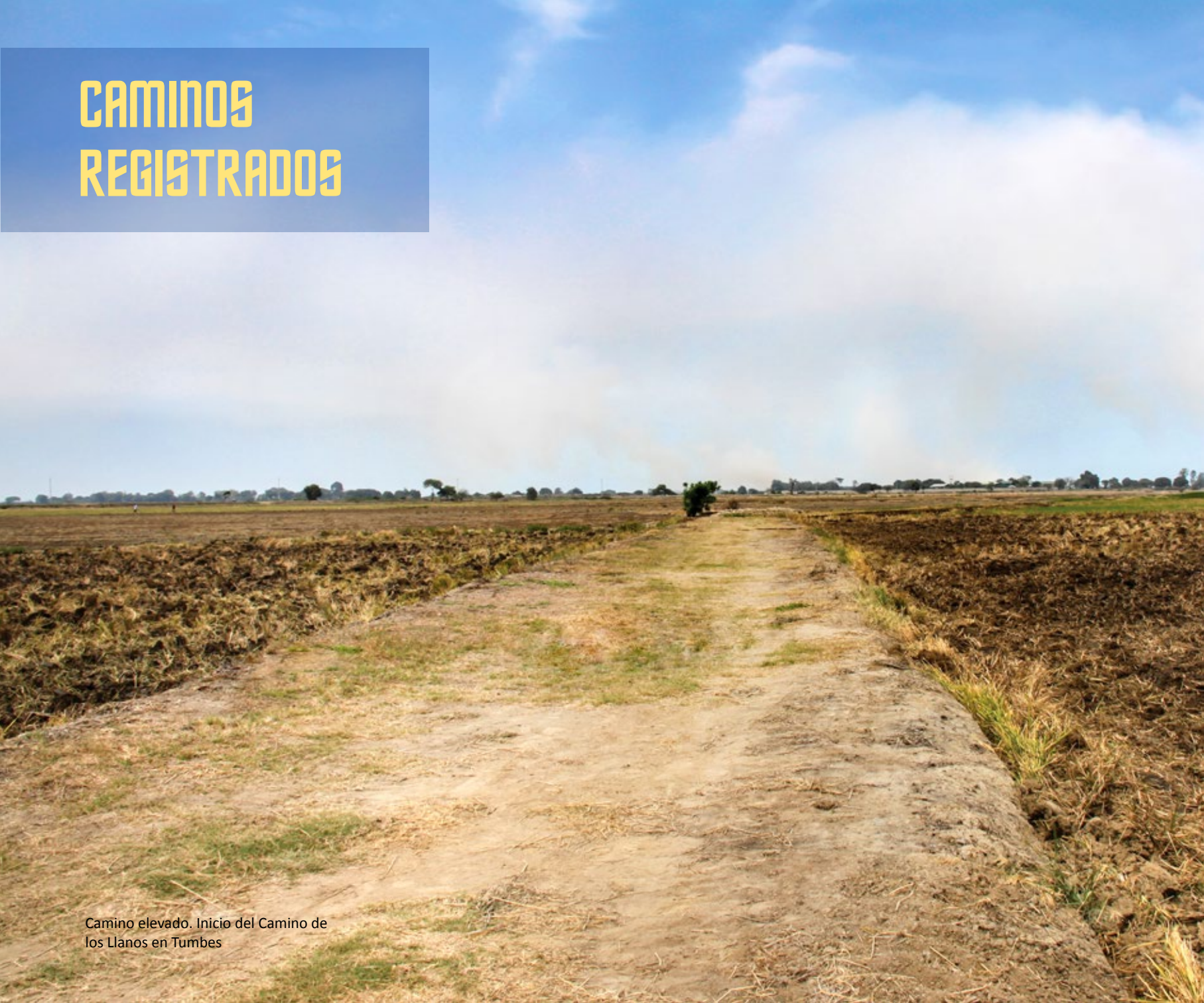
Camino elevado. Inicio del Camino de los Llanos en Tumbes