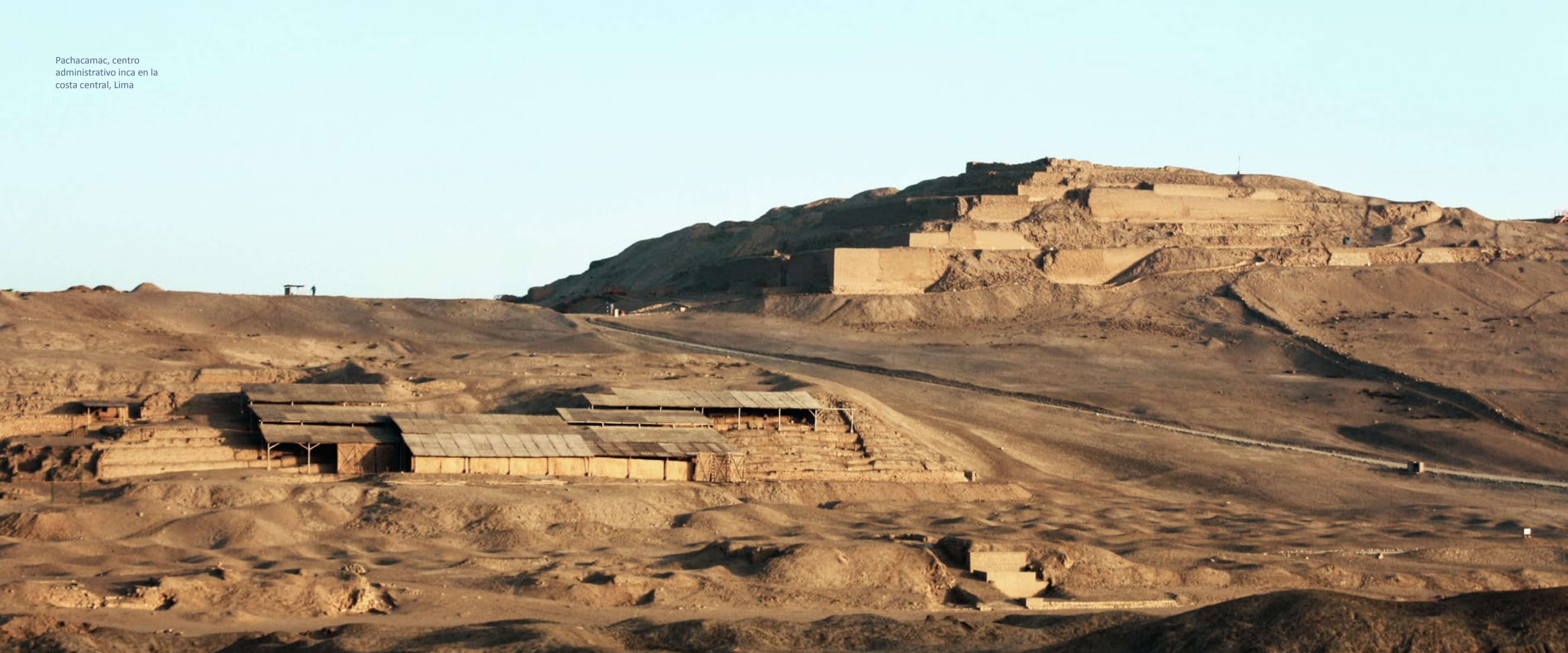
Pachacamac, centro administrativo inca en la costa central, Lima