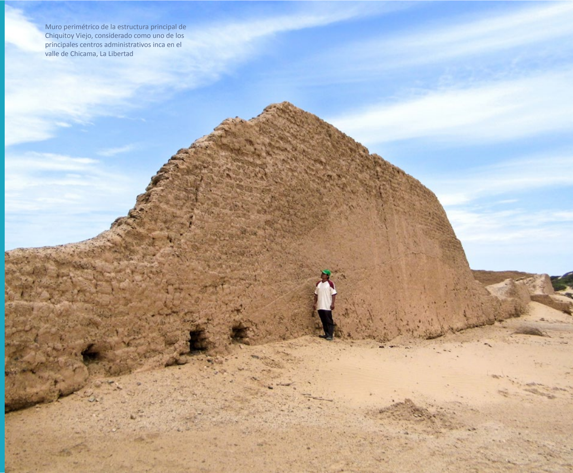
Muro perimétrico de la estructura principal de Chiquitoy Viejo, considerado como uno de los principales centros administrativos inca en el valle de Chicama, La Libertad