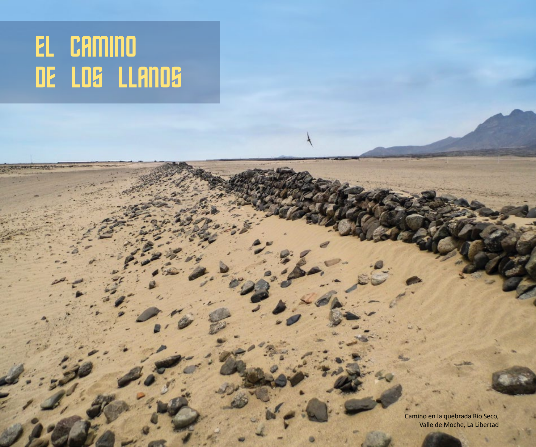
Camino en la quebrada Río Seco, Valle de Moche, La Libertad

E l Camino de los Llanos se extendía por toda la franja de la costa peruana, proyectándose desde el actual departamento de Tumbes hacia Tacna, alcanzando una longitud aproximada de 2,220 kilómetros.