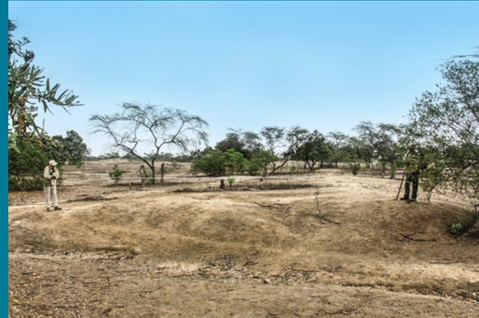
Camino elevado que se proyecta desde La Viña hacia el centro poblado de El Marco, Lambayeque