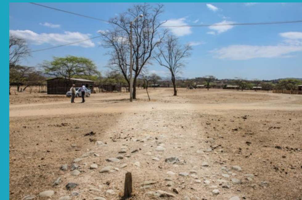
Calzada empedrada en Rica Playa, Tumbes