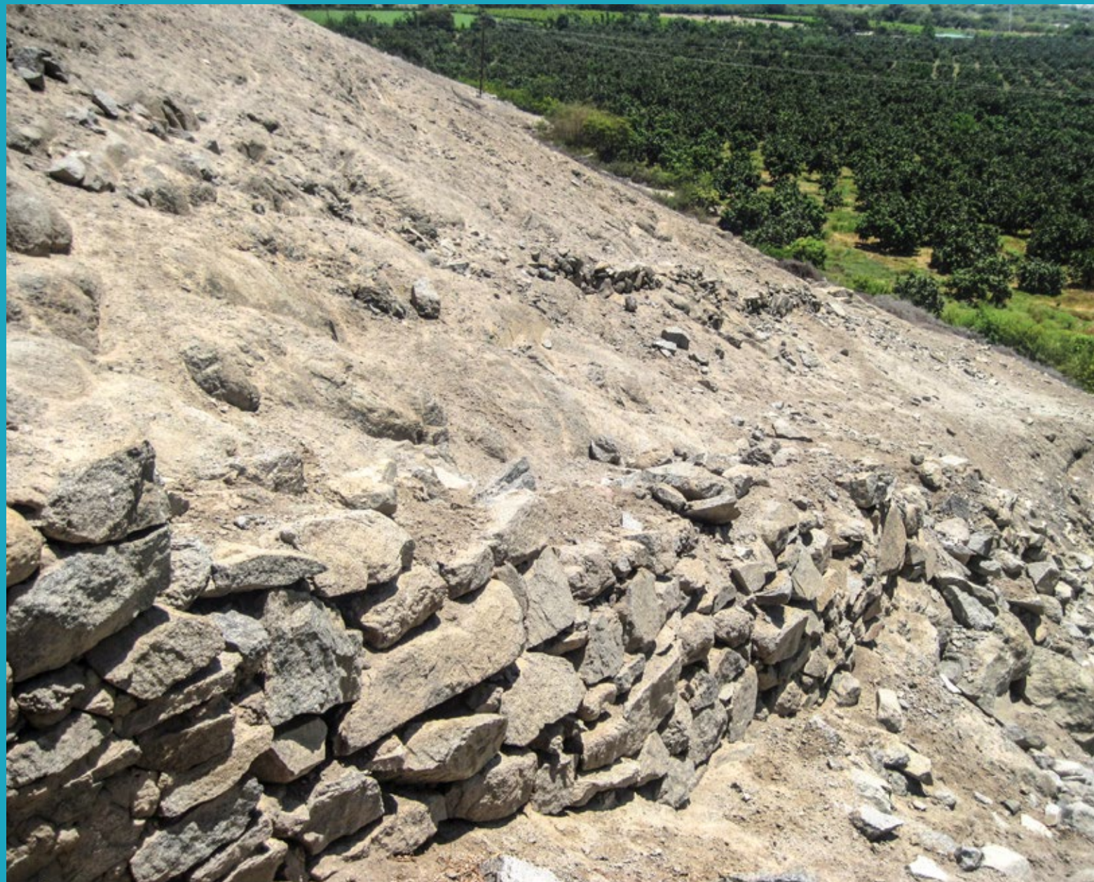
Muro de contención en el camino al sur de Cerro Pampa Afuera. Casma, Ancash