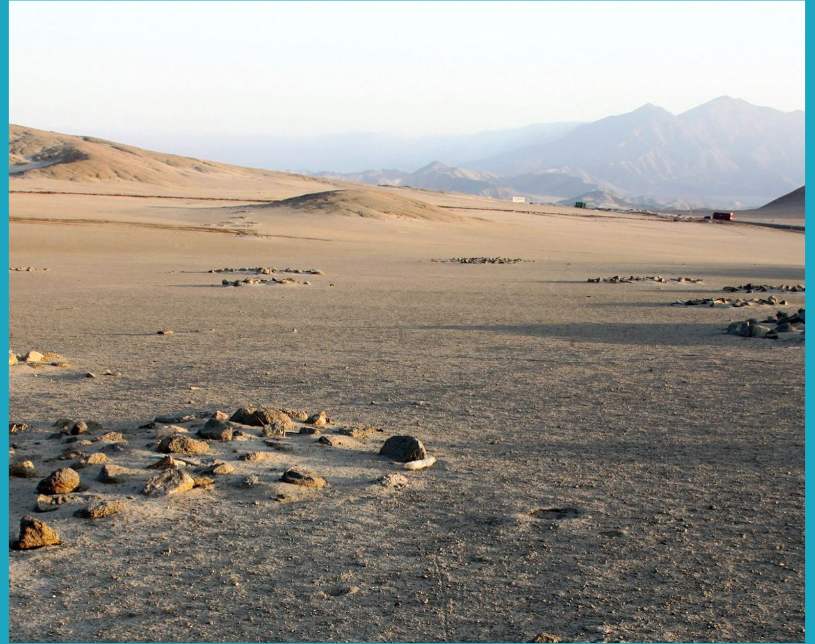
Cúmulos de piedras para construcción del camino en Pampa Antival, Casma, Ancash