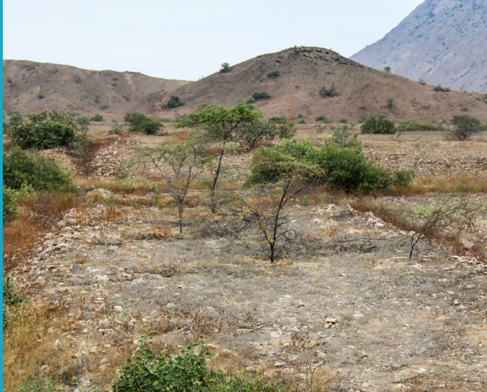
Camino elevado en la quebrada Río Loco, Lambayeque