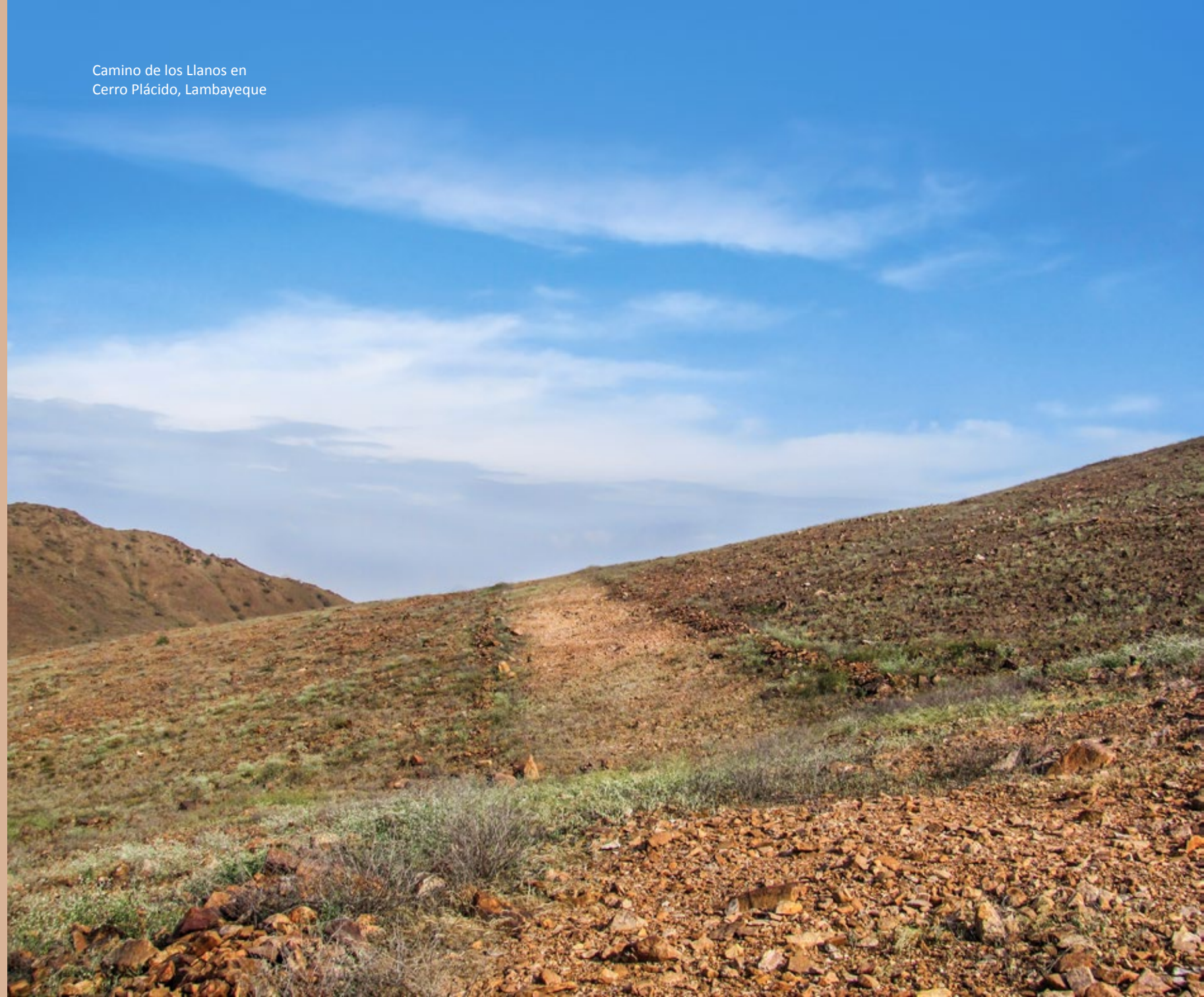
Camino de los Llanos en Cerro Plácido, Lambayeque