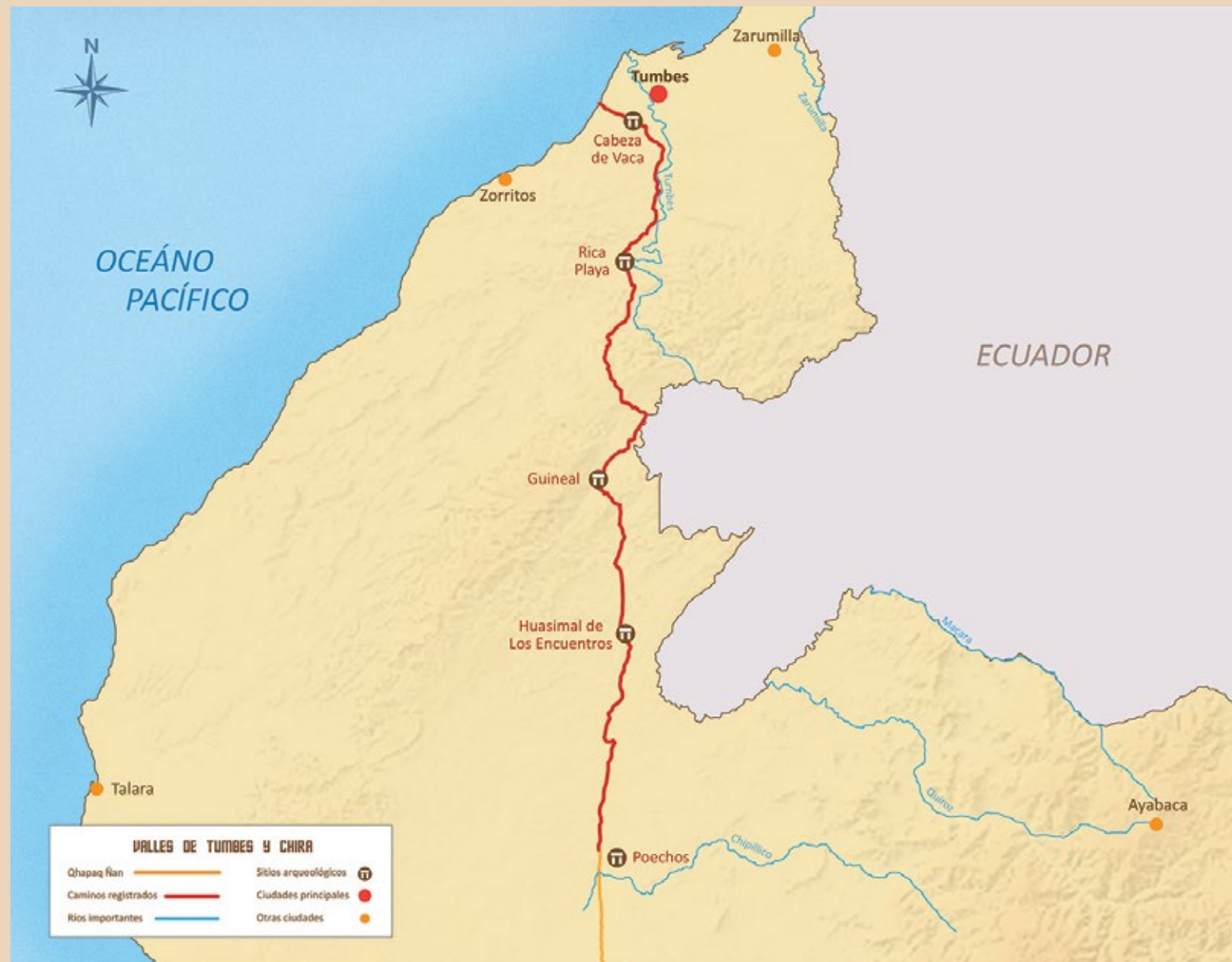
Camino de los Llanos entre los valles de Tumbes y Poechos, regiones de Tumbes y Piura