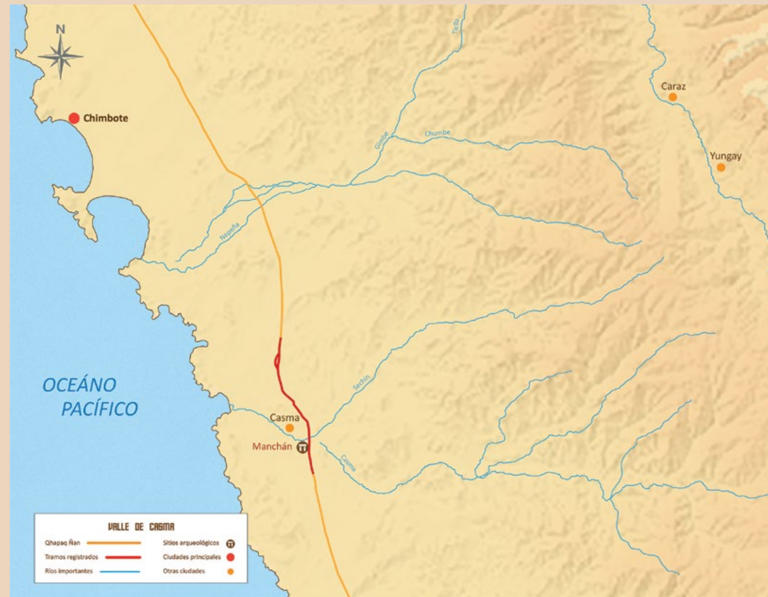
Camino de los Llanos entre los valles de Nepeña y Casma, Ancash

Las evidencias actuales indican que la construcción de este camino habría quedado inconclusa, ya que se encuentran cúmulos de piedras que yacen al lado de los muros del mismo en toda su trayectoria. De acuerdo con los especialistas, este camino es el único registrado con estas características en los andes centrales.