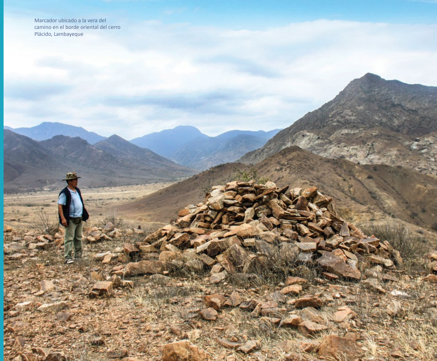
Marcador ubicado a la vera del camino en el borde oriental del cerro Plácido, Lambayeque