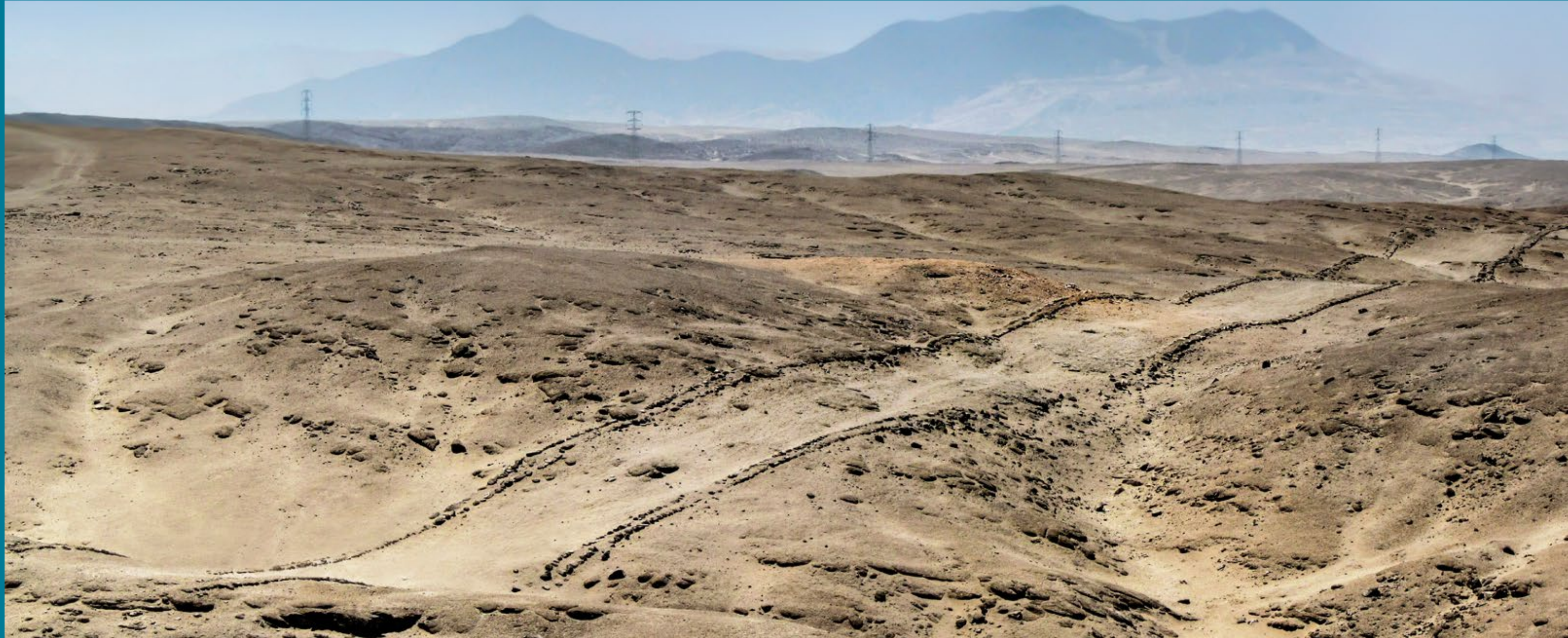
Camino sobre cerro Antival en proyección hacia el valle de Culebras, Casma, Ancash