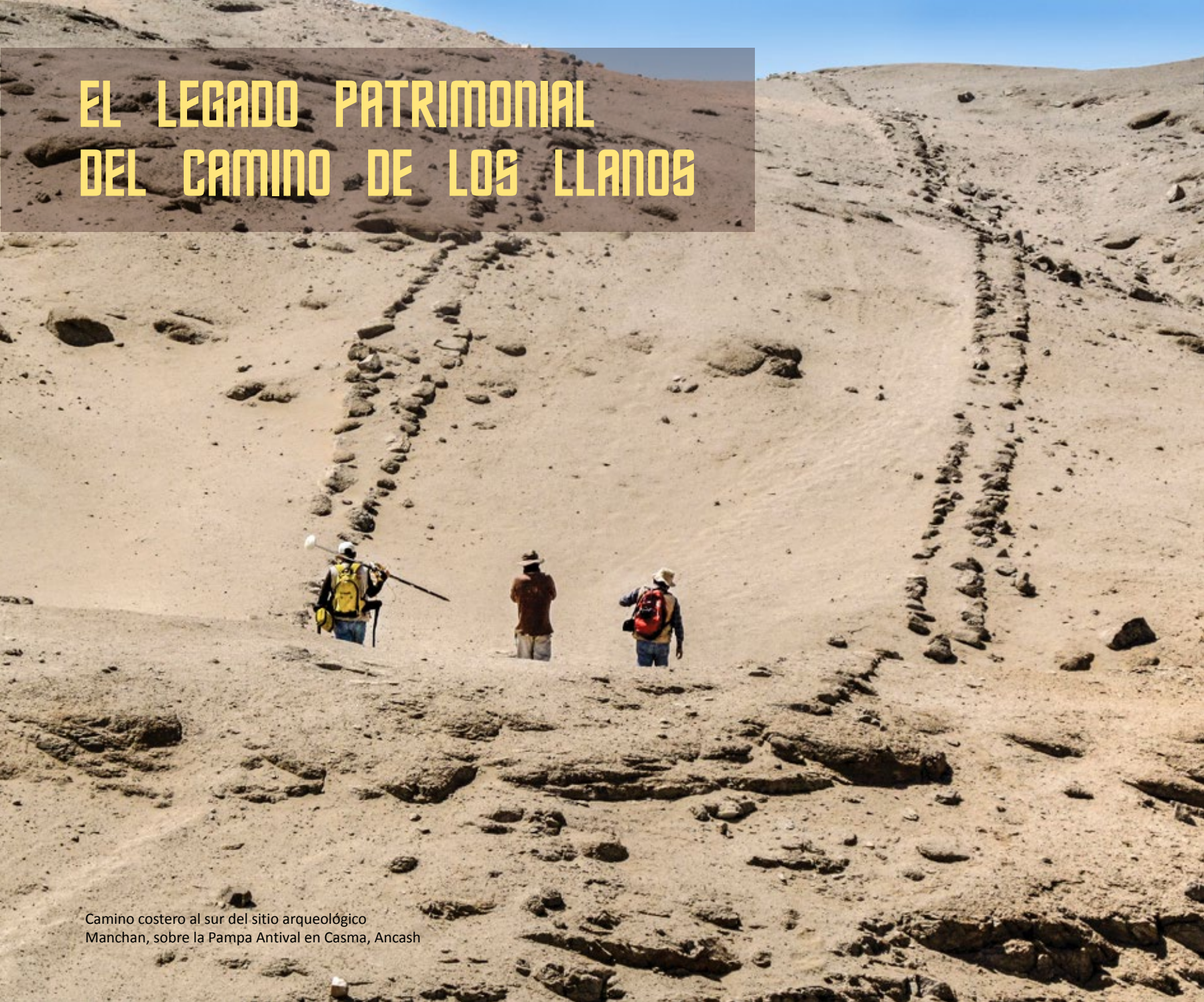
Camino costero al sur del sitio arqueológico Manchan, sobre la Pampa Antival en Casma, Ancash

Después de conquistar Quito, el Inca Túpac Yupanqui mandó construir el Camino de los Llanos por la franja costera que, partiendo de Tumbes, se proyectaba hacia los valles sureños, dominando el área ocupada por otras sociedades prehispánicas como los Chimú, Chancay e Ychsma.