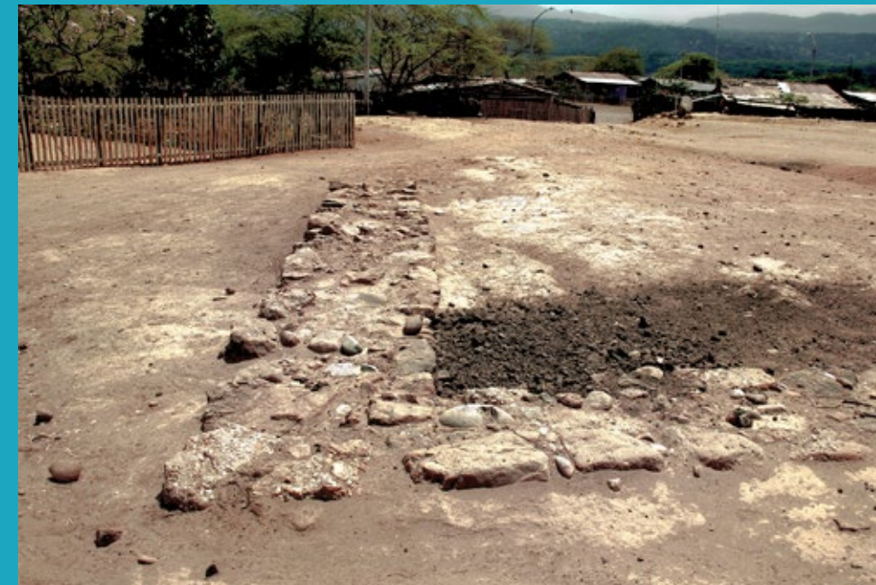
Parte del muro del tambo de Rica Playa, Tumbes

El camino se proyectaba hacia las estribaciones de la cordillera de los Amotapes, sobre una topografía accidentada. Actualmente esta área está incluida en el Parque Nacional Cerros de Amotape, establecido para preservar dos ecosistemas únicos en el Perú: el bosque seco ecuatorial y el bosque tropical del Pacífico. Desde la cordillera de los Amotapes, el camino proseguía hacia Poechos, pasando por Ucumares y Huásimo, en donde se encontraron calzadas empedradas y muros laterales de 50 centímetros de alto (Vílchez 2005). Desde aquí continuaba por la quebrada Cazaderos, principal tributario del río Tumbes para dirigirse hacia Guineal, centro administrativo inca en el que destaca una pirámide trunca de tres niveles. Finalmente continuaba hacia el Platanal, conformado por un conjunto de terrazas, para atravesar el sitio arqueológico de Mondoño hasta llegar a la quebrada Cusco, límite entre los departamentos de Tumbes y Piura, y de allí a Poechos.