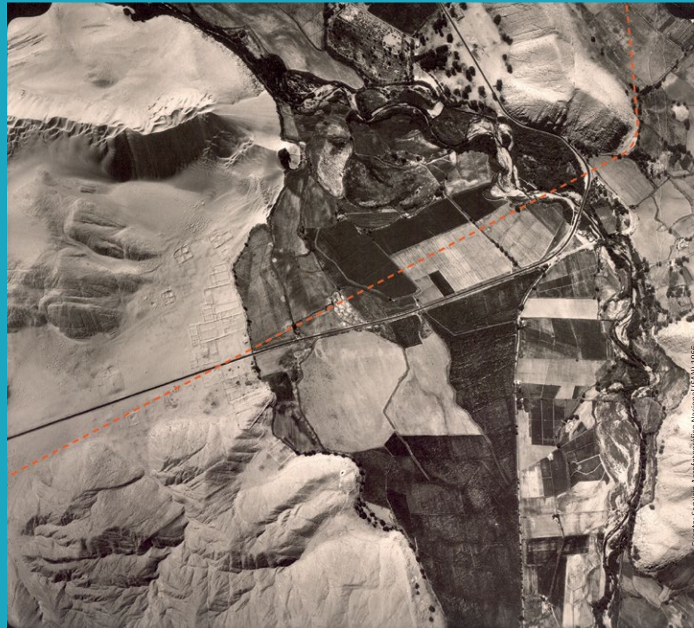
Fotografía aérea de Manchán, centro administrativo Chimú reocupado por los incas con fines políticos y administrativos sobre la margen izquierda del valle de Casma, Ancash, resaltándose la trayectoria del Camino Inca.