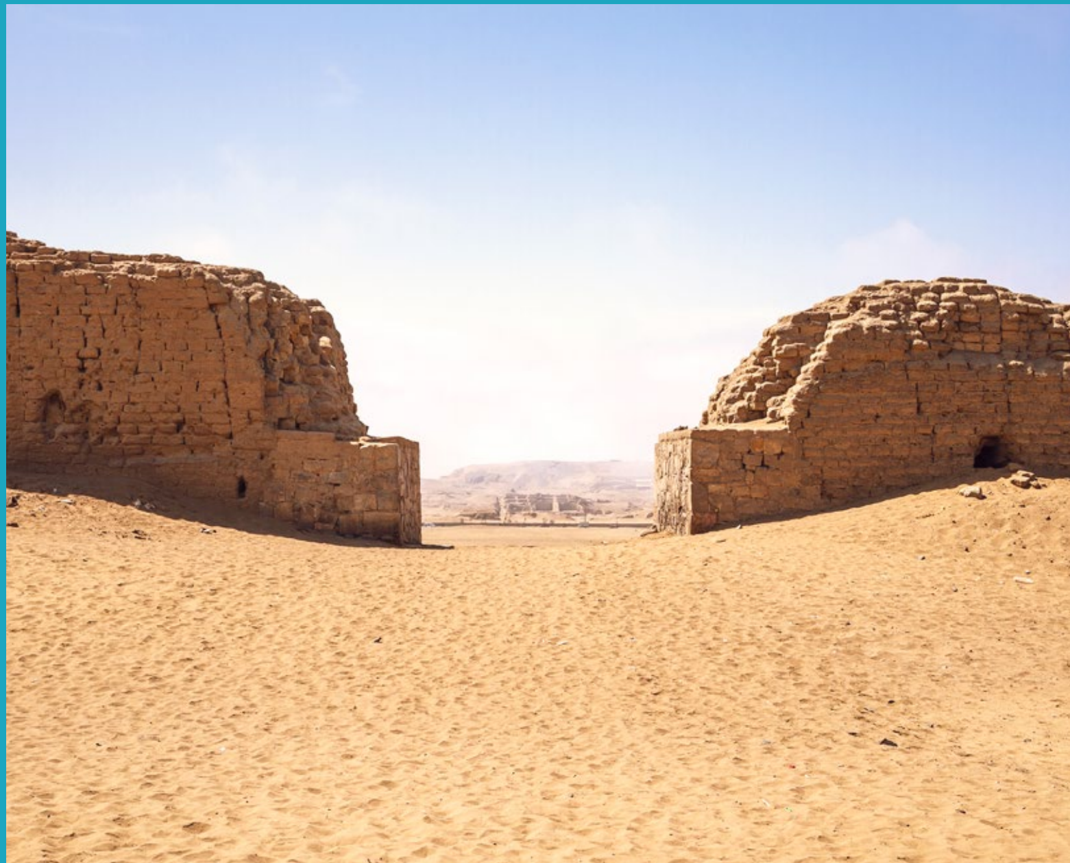
Portada de la Costa: Ingreso principal a Pachacamac por el Camino de los Llanos, Lima

La referencia escrita más temprana del camino que ingresa al Santuario de Pachacamac es narrada por Miguel de Estete (1533), quien acompañó como veedor a Hernando Pizarro custodiado por una comitiva de hispanos y dignatarios incas, con el objetivo de acelerar el envío del oro del rescate de Atahualpa. Hoy se conserva la calle Norte-Sur por donde ingresaban los peregrinos al Santuario. Se ubicaba en la confluencia de los dos caminos, el Camino de los Llanos y el camino transversal a la sierra. A través de esta calle, los peregrinos podían ingresar a los conjuntos de pirámides con rampa y participar en los rituales que eran realizados en las plazas del Santuario.