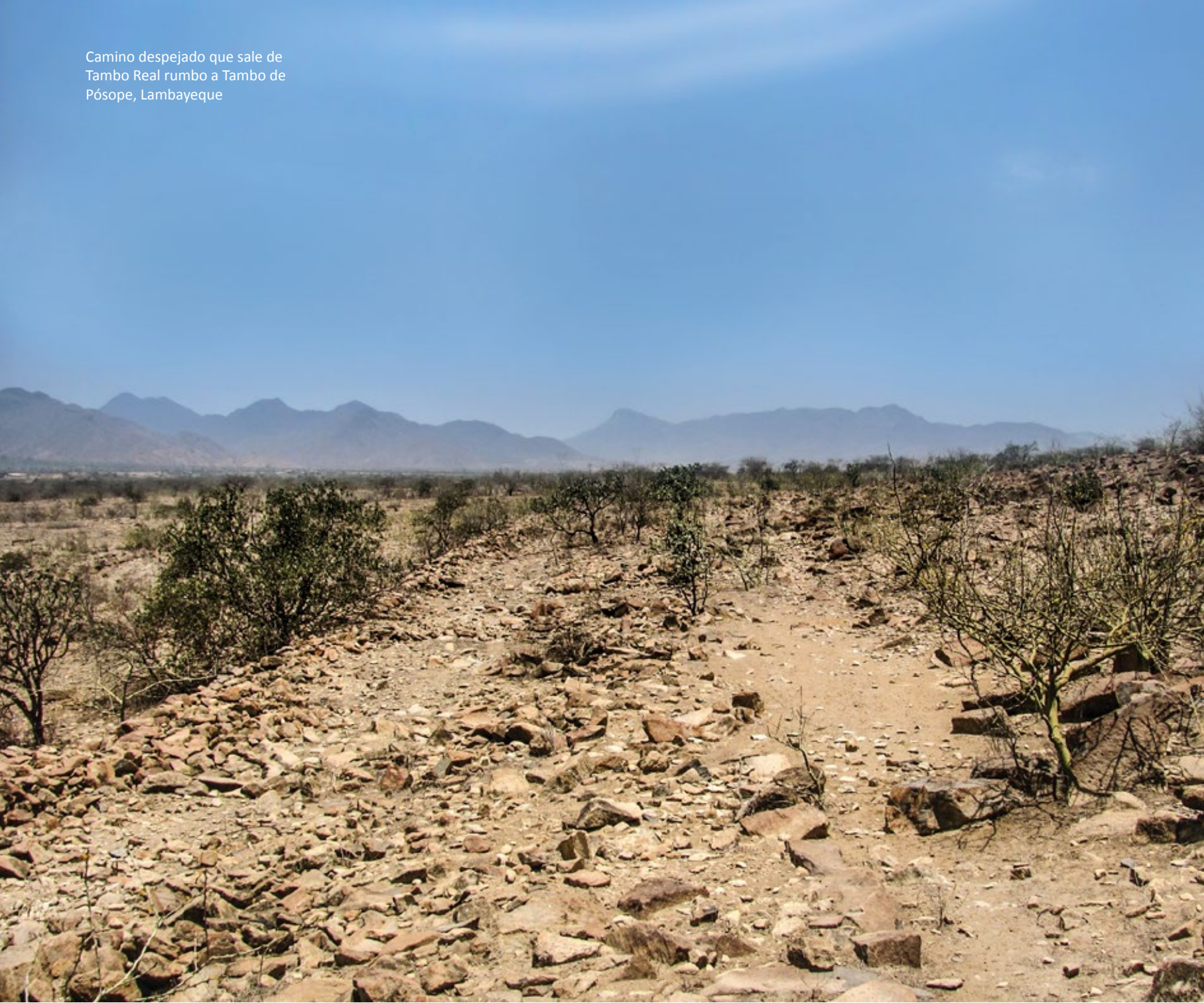
Camino despejado que sale de Tambo Real rumbo a Tambo de Pósope, Lambayeque