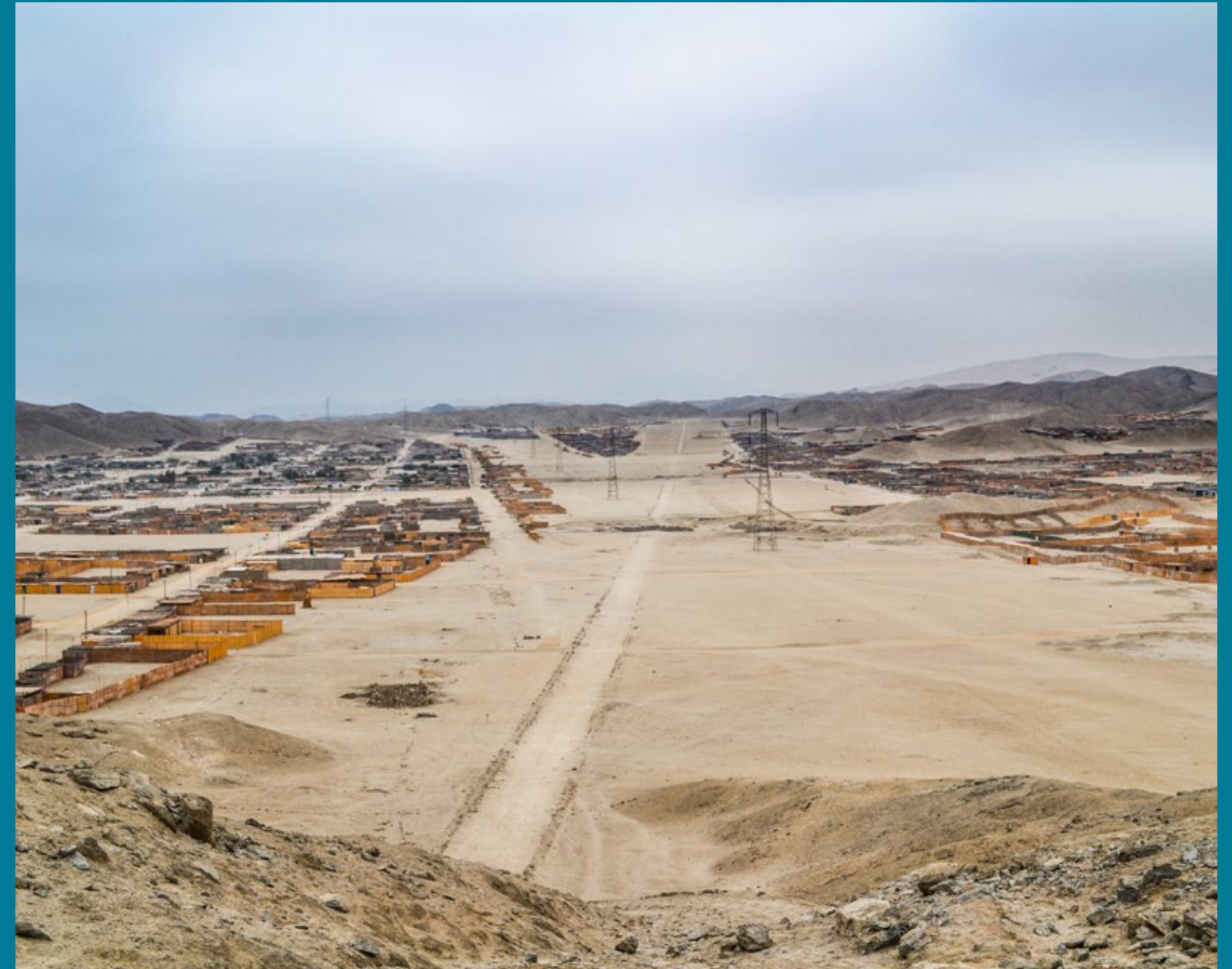
Camino encerrado por muros. Pampa Afuera, Casma, Ancash