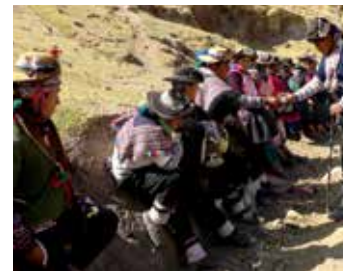
Los chopcca mantienen una cohesión social y sentido de pertenencia colectiva casi inexistente en otras regiones.

nivel translocal pero de un área delimitada, paralelamente al sistema político formal, permite referirse a los chopcca como un grupo étnico andino, generado autónomamente por la decisión colectiva de mantener su propia y particular identidad.