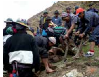
Las fiestas y faenas del ciclo agropecuario son labores productivas ritualizadas que encauzan el trabajo colectivo.