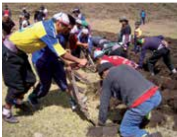
El chakmeo es la preparación de la tierra para la siembra.

Parte del ciclo agrícola es la preparación de la tierra previa a la siembra. En la comunidad campesina Chopcca esta labor se hace siempre con la chakitaclla , el clásico azadón de pie andino que se considera más adecuado que el arado o el tractor para estos menesteres en los suelos de ladera. Siendo esta una labor muy esforzada y que usa exclusivamente fuerza humana, requiere de una organización comunal eficiente, en este caso a cargo de