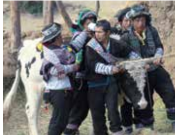
En la fiesta de la herranza o Santiago se realiza la marcación de ganado.

inicia entonces el velakuy (vigilia). En el interior de cada casa que hace el Santiago se dispone sobre un manto extendido los elementos que componen una “mesa” ritual: cintas de colores con las que adornarán las orejas del ganado, maíz cancha y maíz entero, agujas y tijeras, frutas, harina de maíz, golosinas como arroz tostado; y elementos propiamente rituales como aguardiente, claveles rojos, hojas de coca kintu , conchas de mar; y elementos duales como una piedra de colores blanco y amarillo (especie de amuleto para que no falte el dinero), dos recipientes llevando quinua y arena oscura (para propiciar la reproducción de los animales) y el wanzo o figurillas hechas con grasa de llama que representan a una pareja de vacunos. Coronan la mesa los haces de waylla . Así dispuesta, la “mesa” es