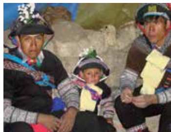
Los chopcca se identifican a sí mismos por su ascendencia común y por la ocupación continua de su territorio.