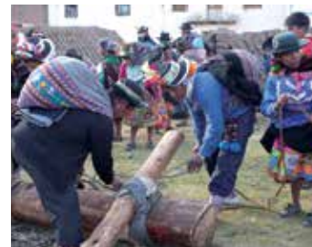
El traslado de la viga o Viga wantuy es una de las fiestas más características de los chopccas.

responsabilidad compartida es hacer llegar al tronco a su destino. El Delantero da ánimos con palabras de aliento, exclamadas rítmicamente, para que los cargadores sigan esta pesada labor. Los cargadores responden con la exclamación ¡brrrash! como expresión de aliento. En los momentos de descanso, los cargadores serán atendidos por sus respectivos Delanteros con aguardiente y coca. Esta labor es difícil y riesgosa, pues el peso del árbol puede hacerlo caer sobre los cargadores; de modo que no son infrecuentes las lesiones y fracturas durante este traslado. Es este elemento de riesgo lo que hace que el viga wantuy sea una actividad con tanta convocatoria: el individuo capaz de cargar esta viga, manteniendo con entereza este peso, es considerado un “buen hombre”, capaz de acometer con carácter las labores y dificultades futuras. Para los jóvenes solteros