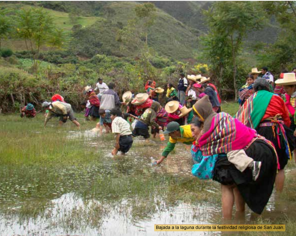
Bajada a la laguna durante la festividad religiosa de San Juan.