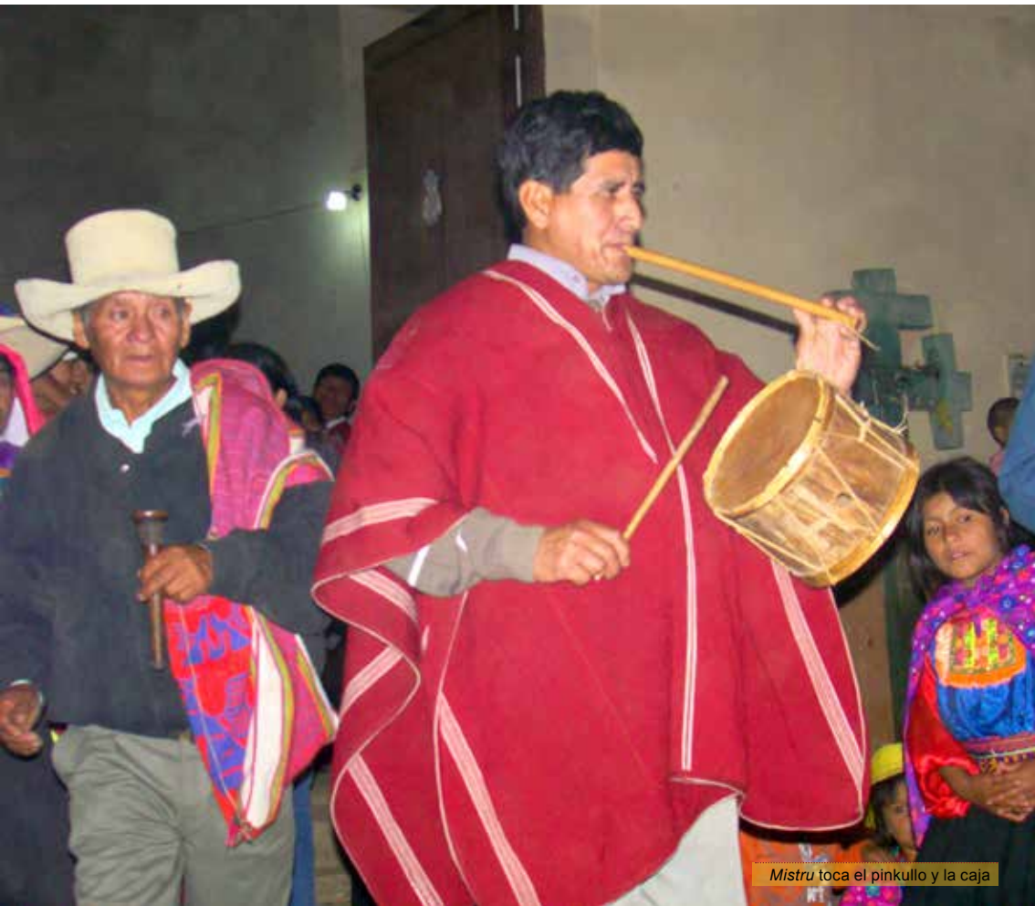
Mistru toca el pinkullo y la caja