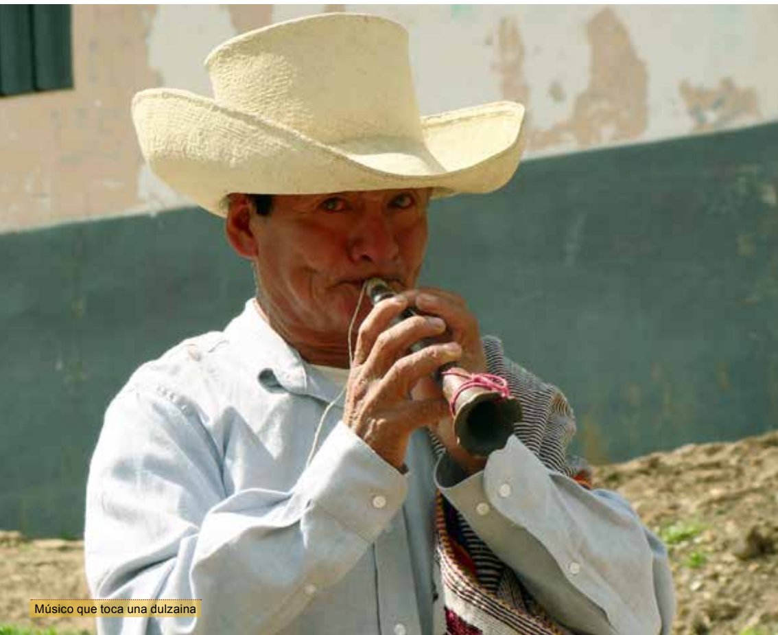
Músico que toca una dulzaina