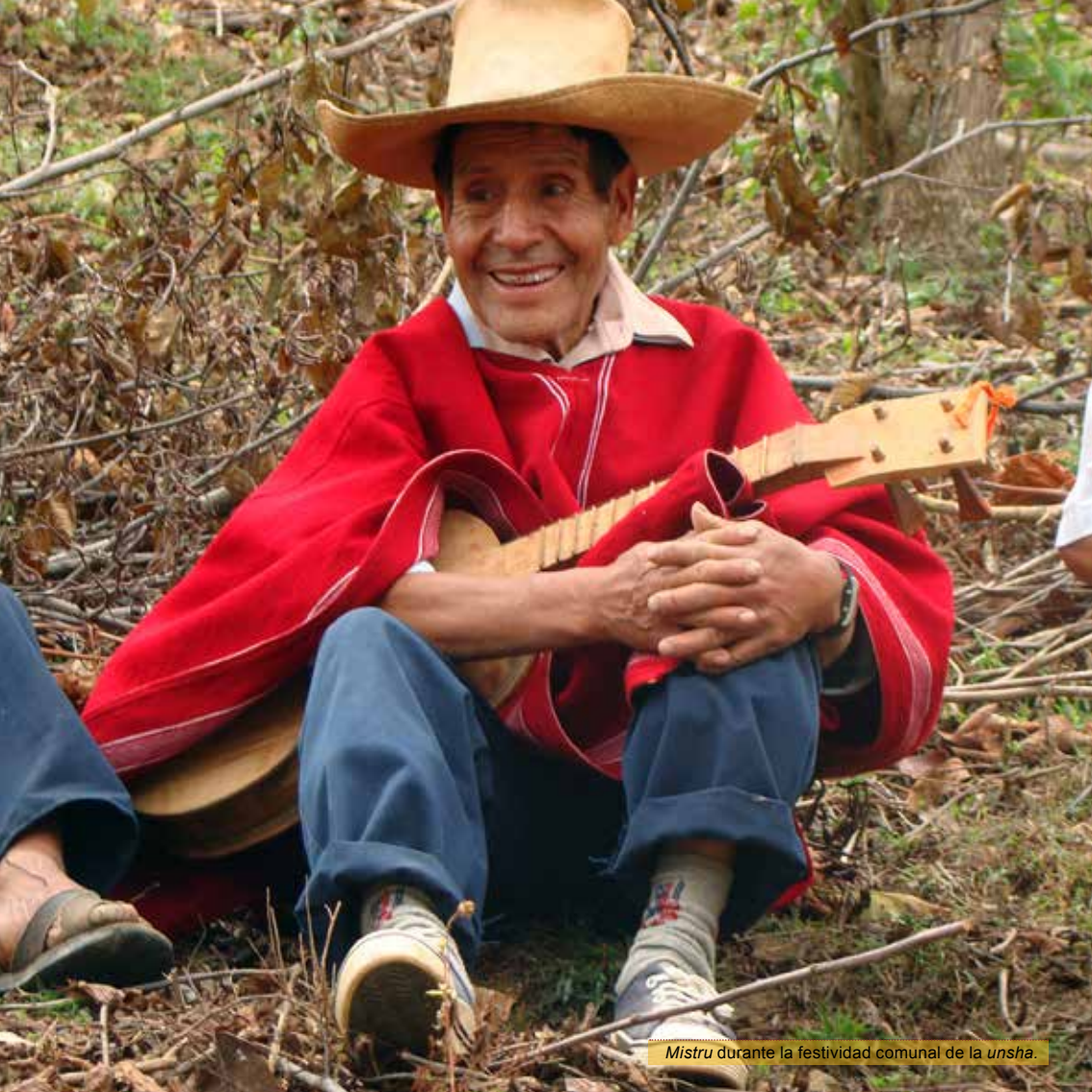
Mistru durante la festividad comunal de la unsha.