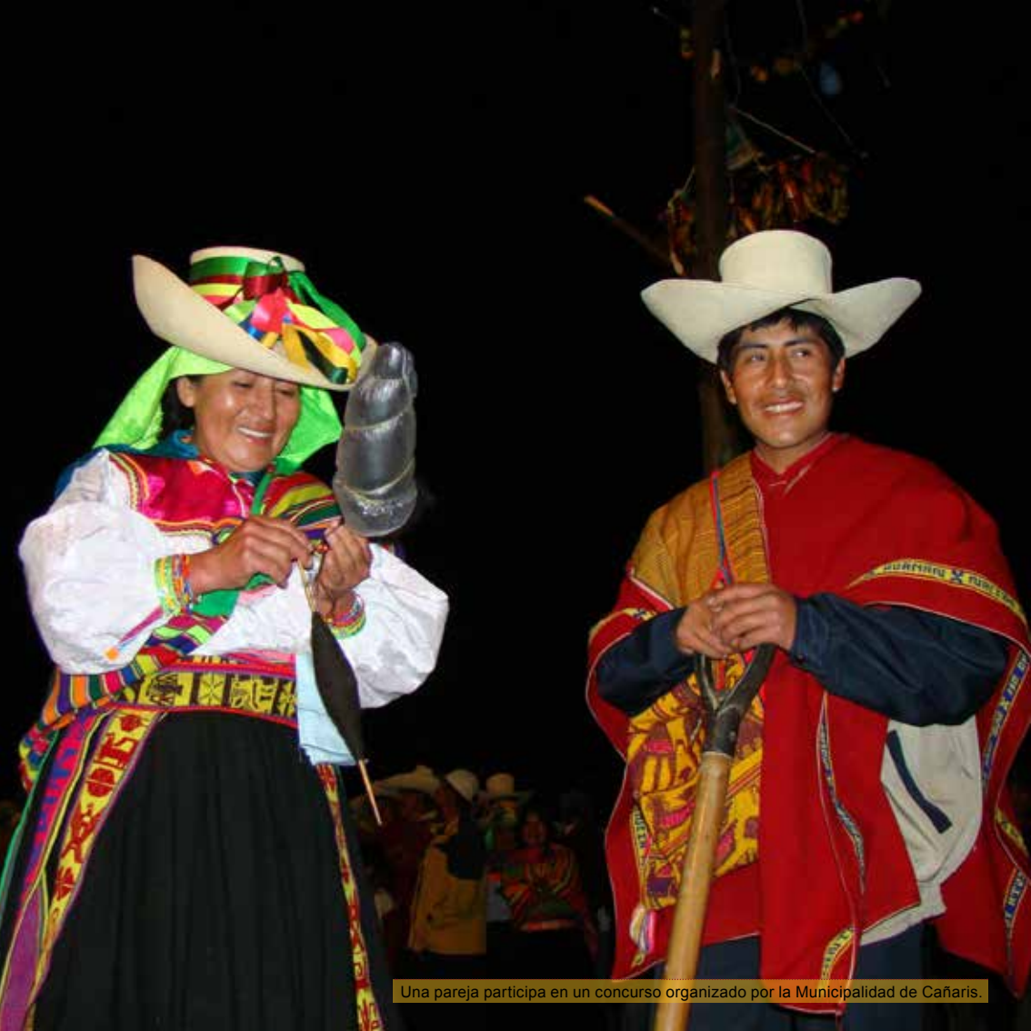
Una pareja participa en un concurso organizado por la Municipalidad de Cañaris.