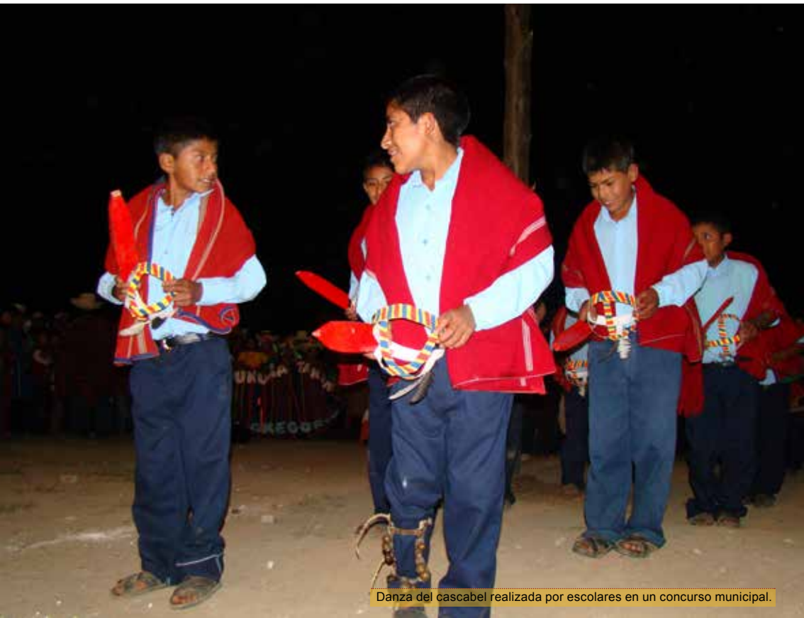
Danza del cascabel realizada por escolares en un concurso municipal.