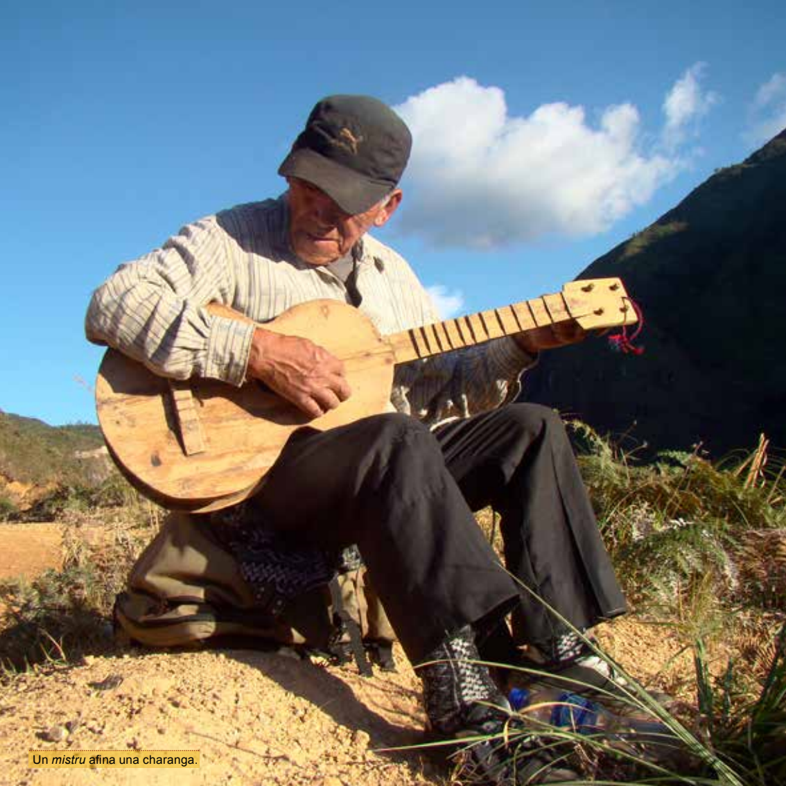
Un mistru afina una charanga.