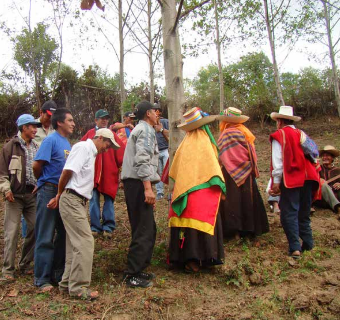
Ronda de hombres y mujeres alrededor del árbol durante la festividad comunal de la unsha.