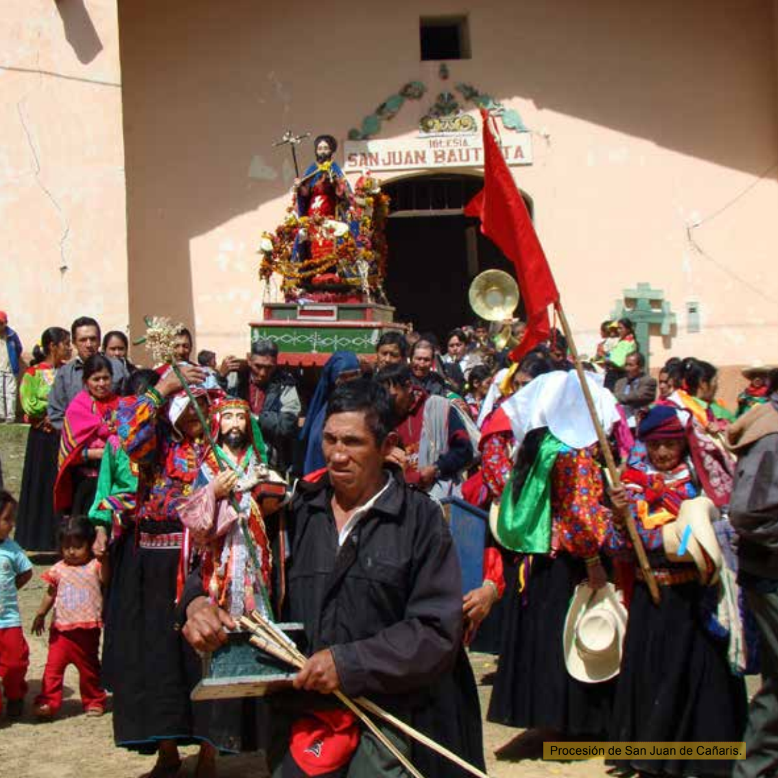
Procesión de San Juan de Cañaris.