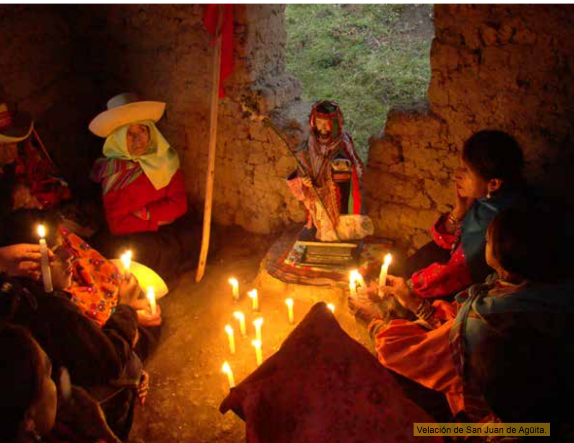
Velación de San Juan de Agüita.