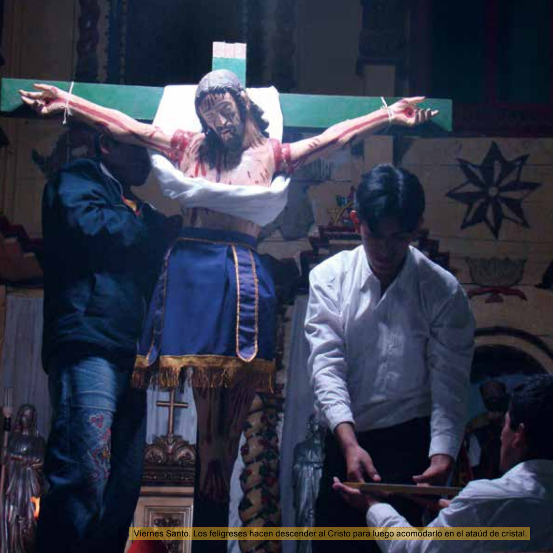
Viernes Santo. Los feligreses hacen descender al Cristo para luego acomodarlo en el ataúd de cristal.