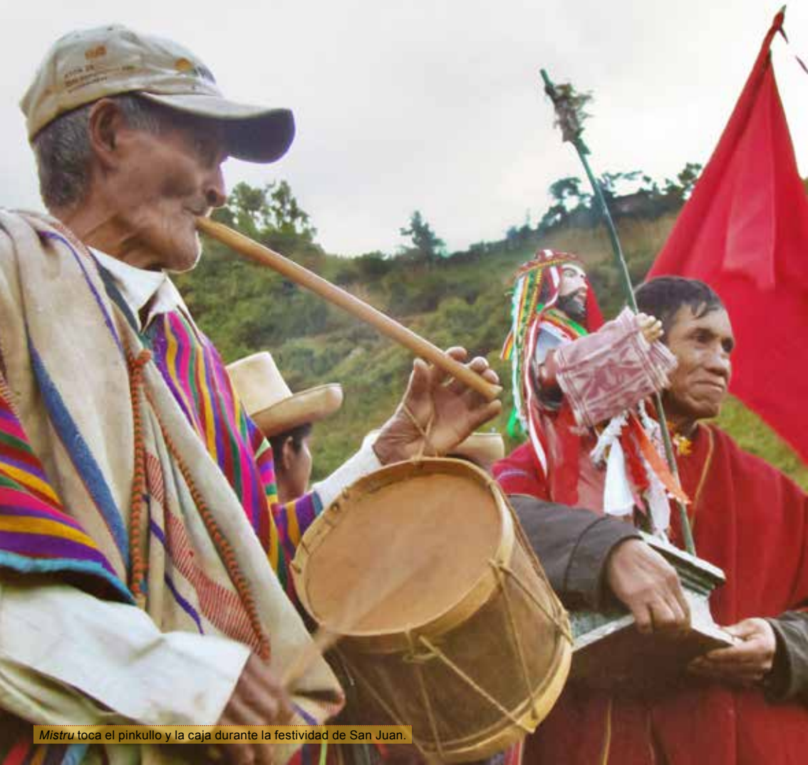
Mistru toca el pinkullo y la caja durante la festividad de San Juan.