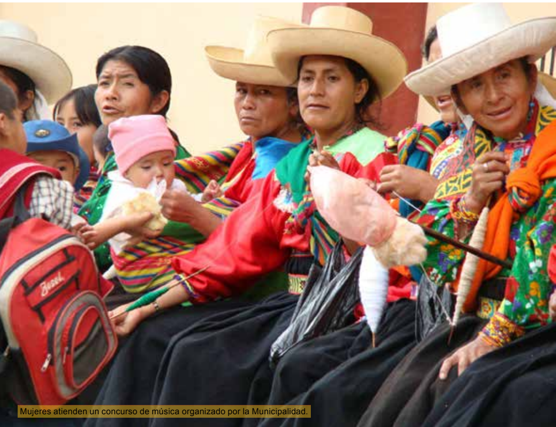
Mujeres atienden un concurso de música organizado por la Municipalidad.