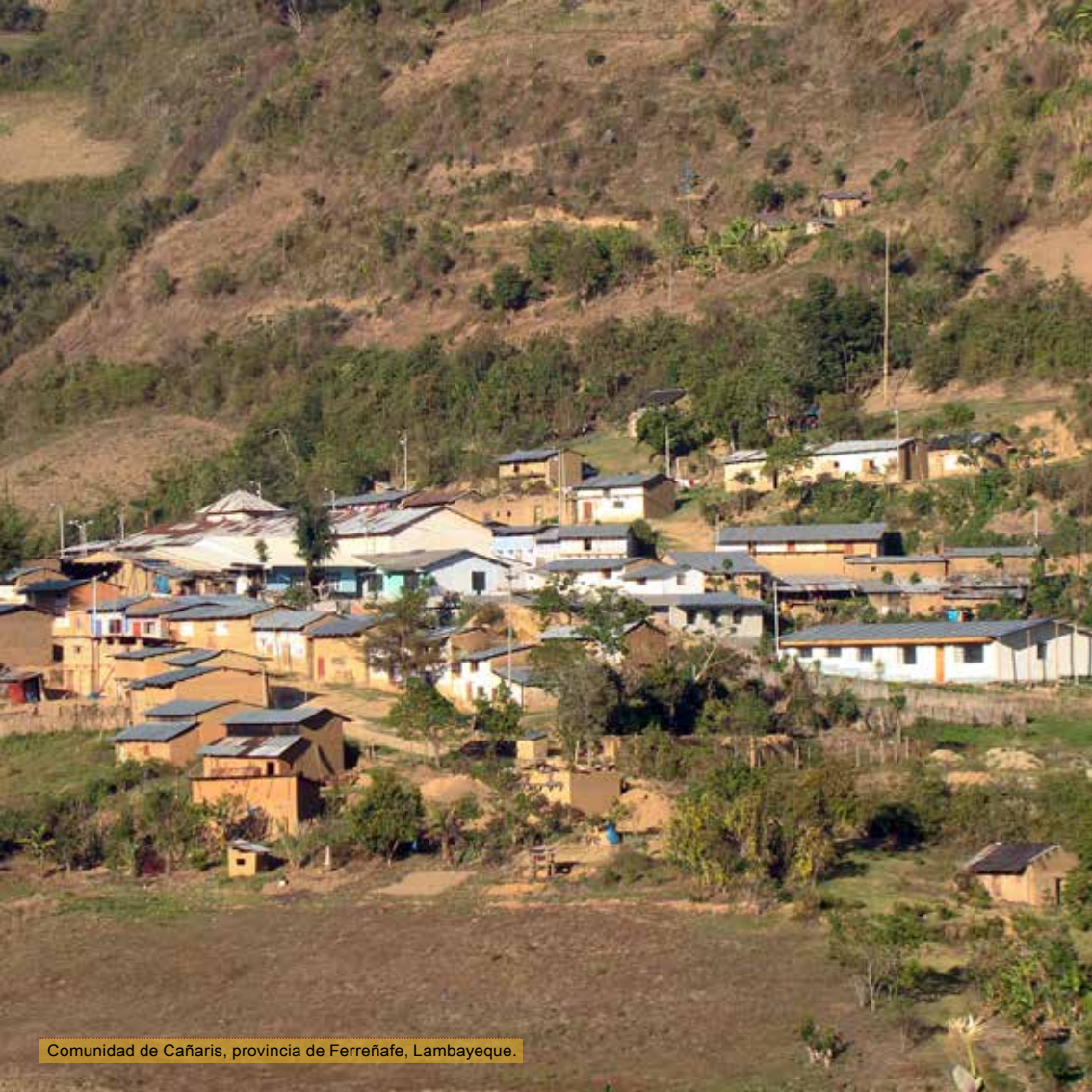
Comunidad de Cañaris, provincia de Ferreñafe, Lambayeque.