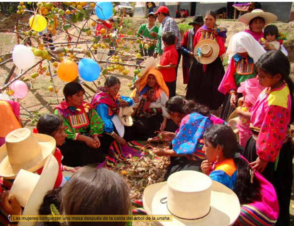
Las mujeres comparten una mesa después de la caída del árbol de la unsha .