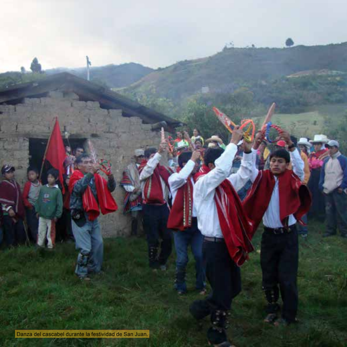
Danza del cascabel durante la festividad de San Juan.