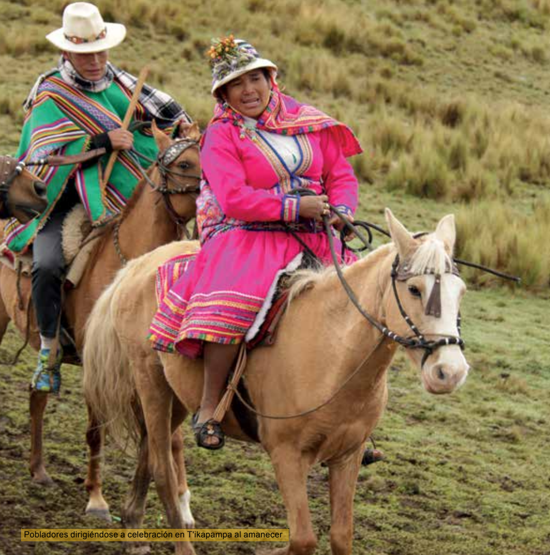
Pobladores dirigiéndose a celebración en T'ikapampa al amanecer

del primero, sufriendo represiones de parte del bando triunfante, con destrucción de infraestructura y pérdida de vidas; pero esto no fue sino la antesala al proceso mucho más cruento que interrumpió todo el proceso civilizatorio andino: la conquista española. Llegados en 1532, los españoles aprovecharían las pugnas internas del Tawantinsuyu, produciendo la ruptura del orden establecido por los incas, para someter a una diezmada población nativa, constituir sobre ella un nuevo sistema, basado fundamentalmente en la extracción de recursos y la explotación de mano de obra nativa, redistribuida para tal fin. Así, los nativos fueron reorganizados en reducciones y sometidos al régimen de encomiendas 17 , creado por Francisco Pizarro.