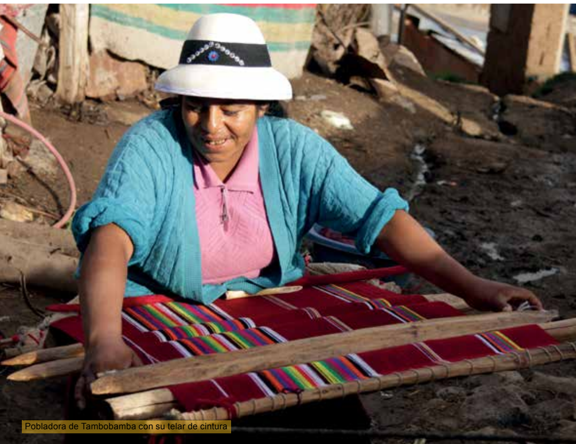
Pobladora de Tambobamba con su telar de cintura

En el área rural andina, los vínculos de parentesco son la base de una red de relaciones sociales que conduce no solamente los afectos sino también el movimiento económico 6 . Los vínculos familiares básicos se extienden hacia un conjunto de familias emparentadas que conforman una unidad definida con el término genérico de ayllu y, fuera del área de parentesco, a personas particulares en calidad de compadres, padrinos y vecinos. Tales vínculos son renovados durante este tiempo en las reuniones familiares, en la celebración compartida con los vecinos del barrio y en general con los paisanos de la localidad, lazos que conforman la organización básica del carnaval. Agrupaciones conformadas por familias y ayllus , o por secciones locales como barrios, parcialidades, sayas o similares, se distribuyen responsabilidades en la organización del carnaval, desde la realización del ritual hasta las comparsas de baile y de música.