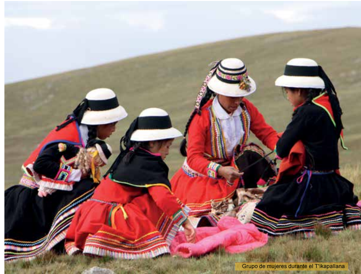
Grupo de mujeres durante el T'ikapallana