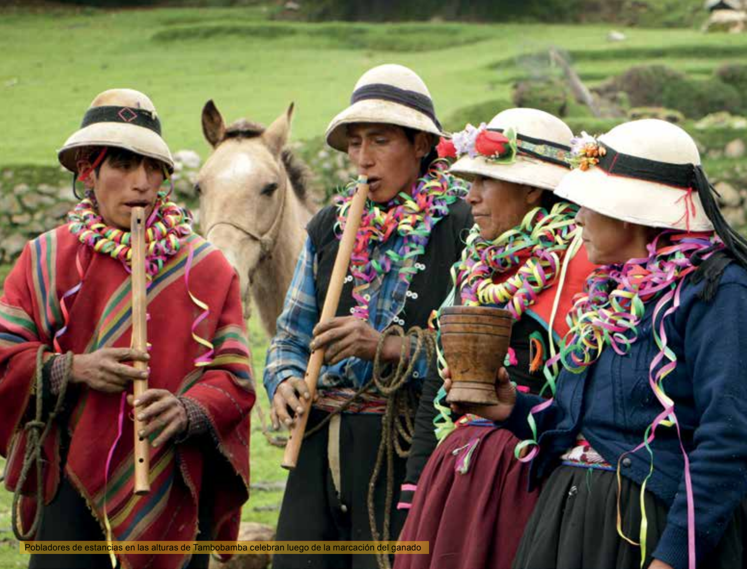
Pobladores de estancias en las alturas de Tambobamba celebran luego de la marcación del ganado