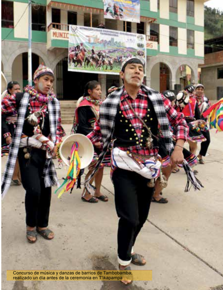
Concurso de música y danzas de barrios de Tambobamba, realizado un día antes de la ceremonia en T'ikapampa

principal, conformando un pasacalle encabezado por las autoridades municipales. Este concurso de qashwas , desplegado ante un jurado compuesto por estas mismas autoridades, durará todo el día, hasta caer la tarde. Los grupos participantes hacen entonces una invitación mutua, según se dice, para ir a honrar al día siguiente a Mamaporoto en T'ikapampa.