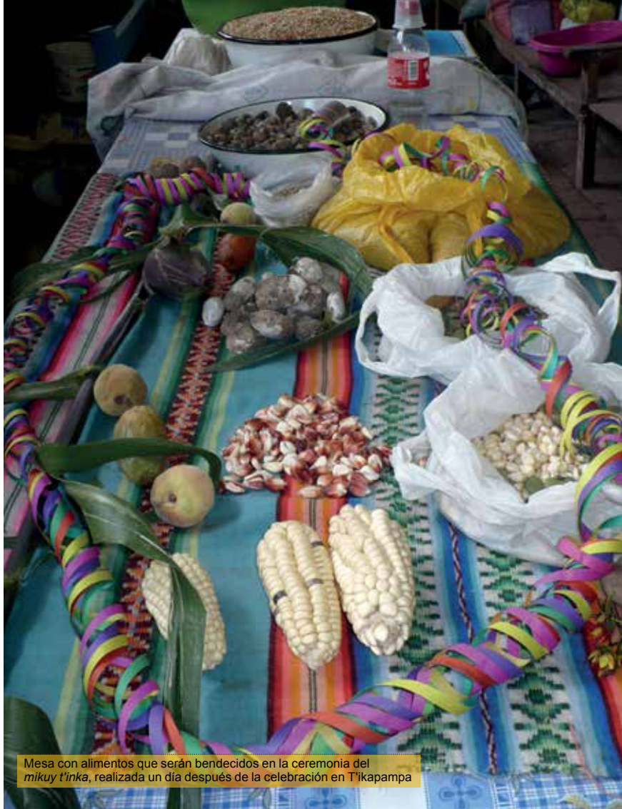
Mesa con alimentos que serán bendecidos en la ceremonia del mikuy t'inka , realizada un día después de la celebración en T'ikapampa

nos hizo reunir en la madrugada del día martes, y son puestos en un maqas grande, una buena manta, un poncho o un buen costal a modo de una mesa para dar las gracias a Dios y a nuestros apus . Así empieza la t'inka , pero mi mamá y mi papá en la casa nos preguntan: "¿Dónde está Mamaporoto, donde está la tuna, el membrillo y las flores del waqanki y el surphuy que trajeron del T'ikapallana? Pongan en la mesa para t'inkar todos los productos que hemos sembrado para tener un buen año". Con chicha han t'inkado .