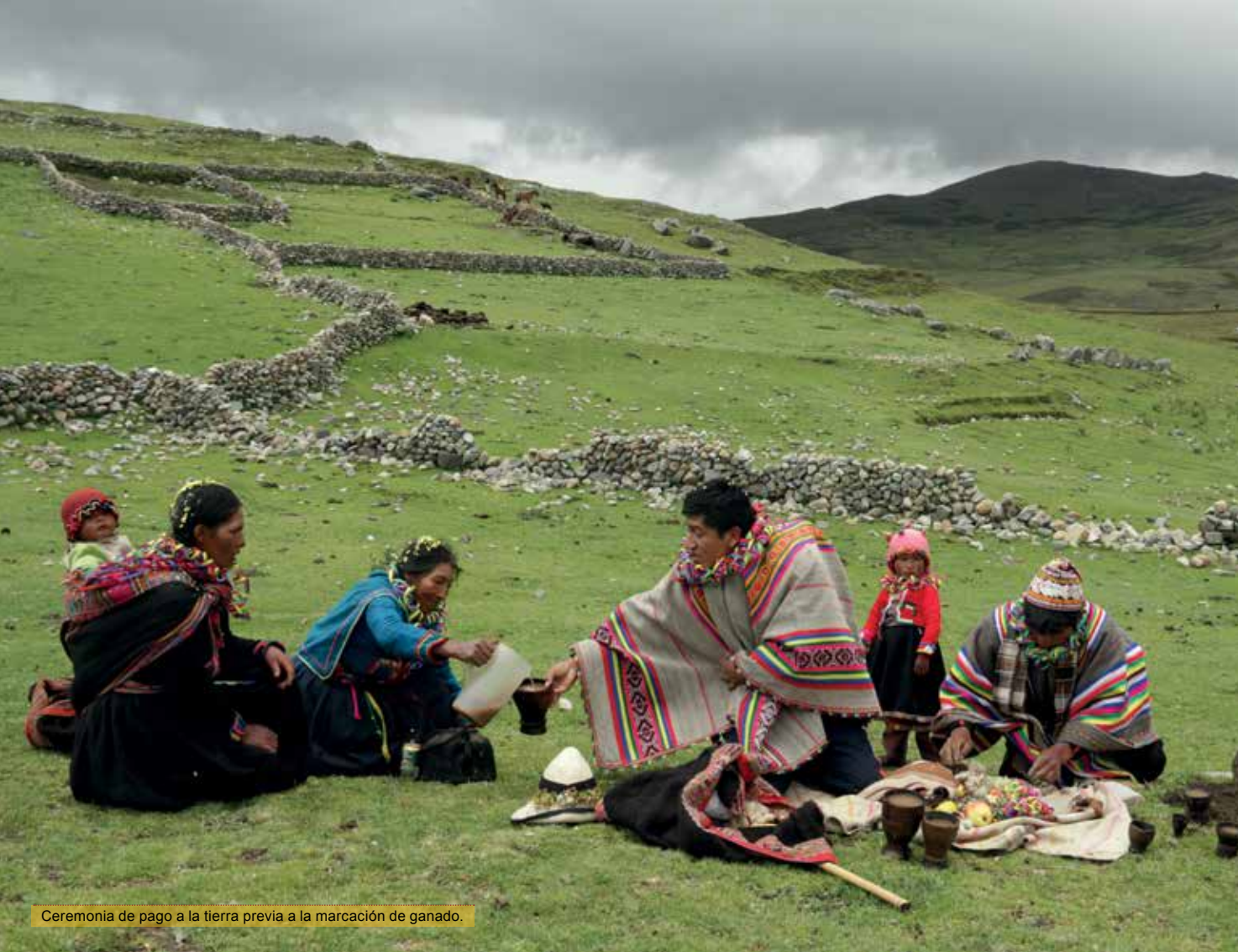
Ceremonia de pago a la tierra previa a la marcación de ganado.