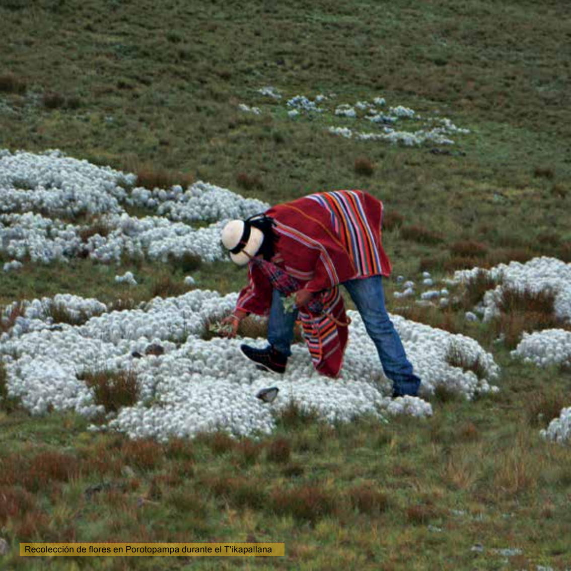
Recolección de flores en Porotopampa durante el T'ikapallana

T'ikapallana. A veces son robadas las flores que recogieron nuestras hermanas.