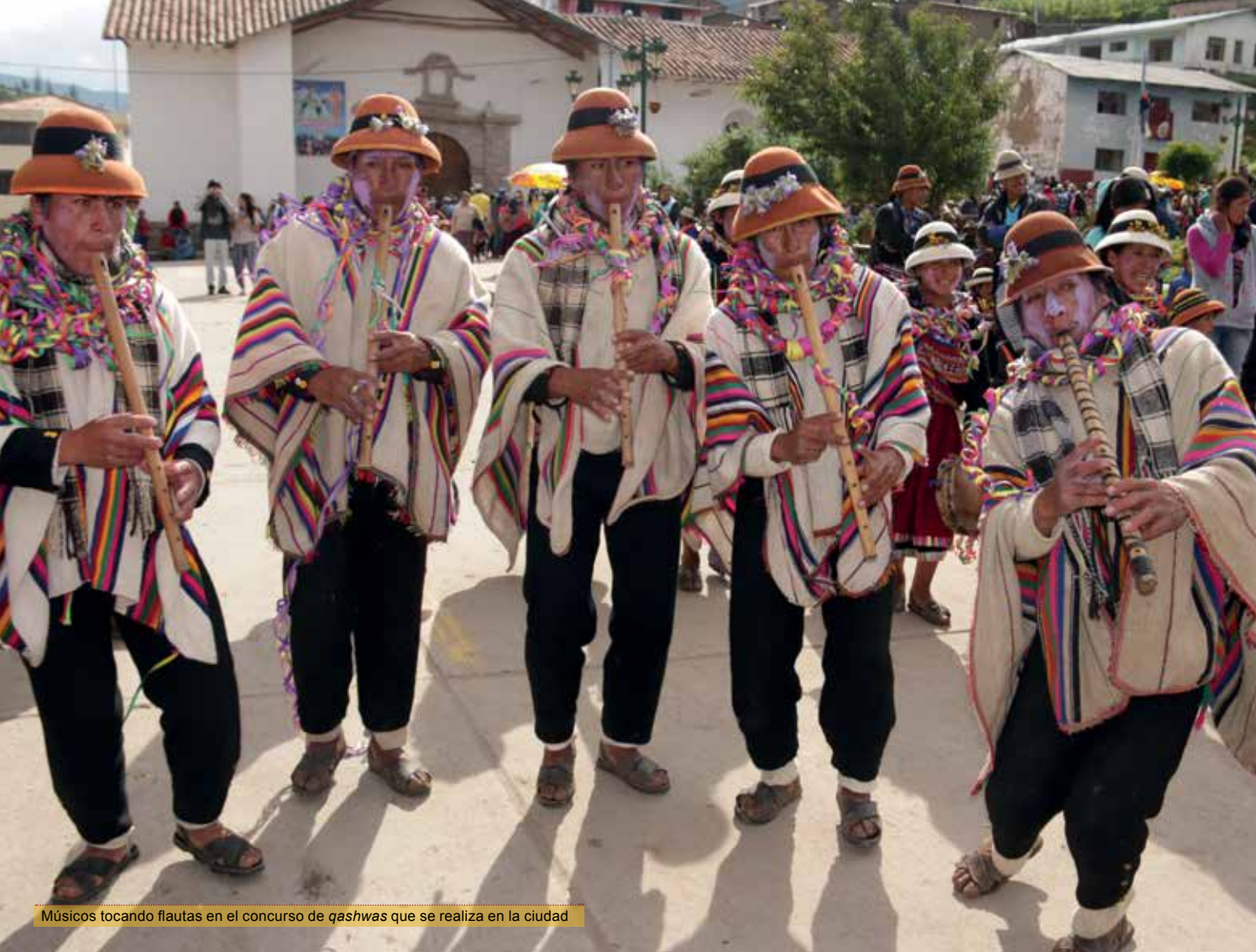
Músicos tocando flautas en el concurso de qashwas que se realiza en la ciudad