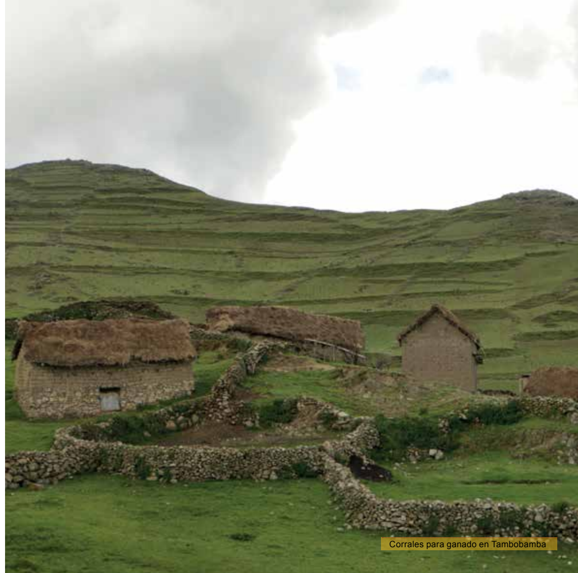
Corrales para ganado en Tambobamba