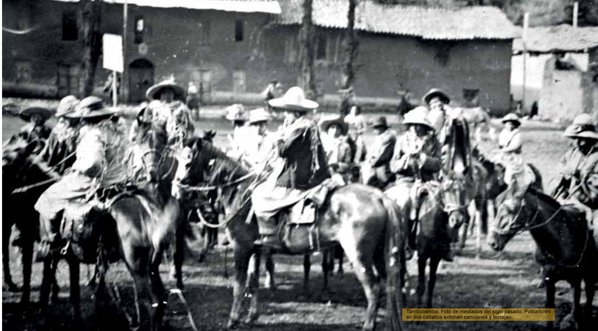
Tambobamba. Foto de mediados del siglo pasado. Pobladores en sus caballos entonan canciones y festejan.