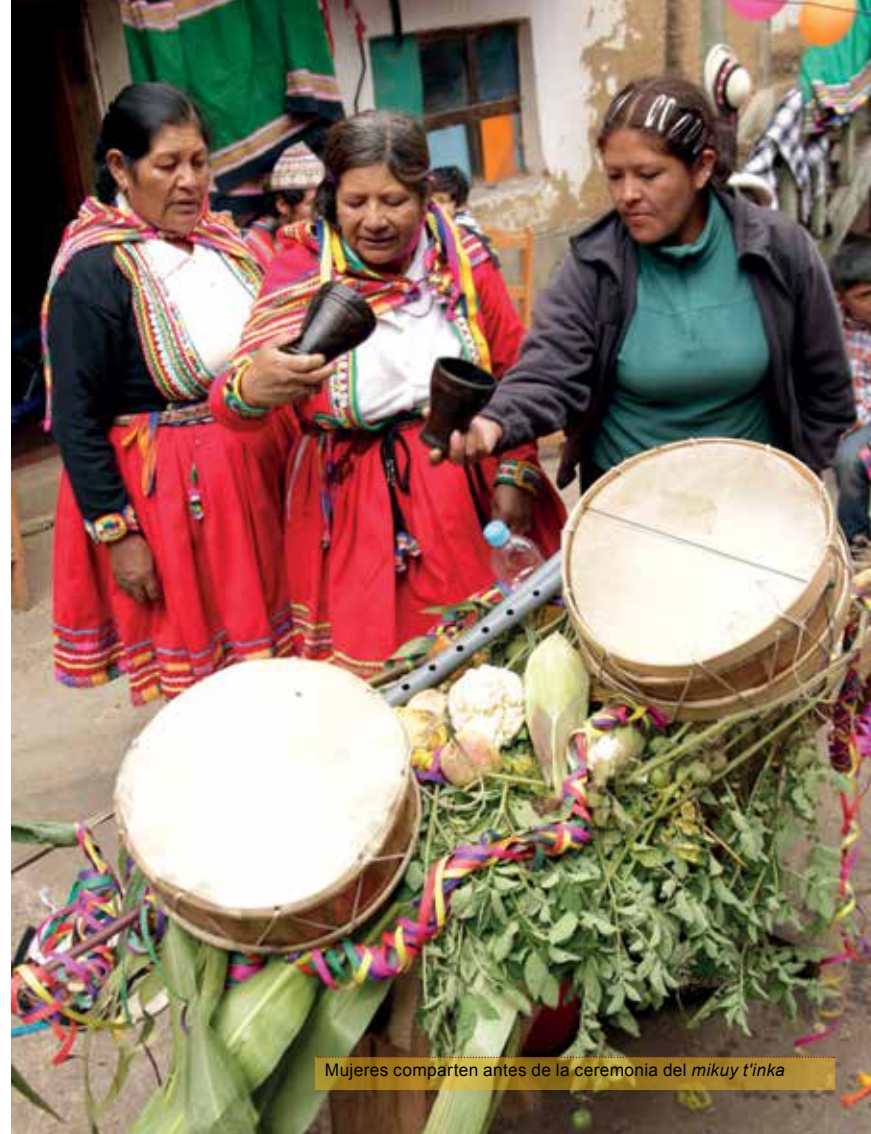
Mujeres comparten antes de la ceremonia del mikuy t'inka

El carnaval tambobambino, localmente llamado puqllay , es una variante particularmente rica y compleja de esta festividad ritual que se funda en la renovación de los vínculos de los familiares y del grupo humano con la naturaleza, constituyéndose por antonomasia en la más importante y esperada celebración por los pobladores de este distrito, dejando en un segundo plano a las festividades santorales del catolicismo. Pero además, este carnaval es un reflejo directo de la sociedad, y en el transcurso de esta investigación se han recogido testimonios muy completos sobre la versión antigua de esta fiesta, muy afectada por la presencia del sector social misti que antiguamente dominaba la sociedad regional.