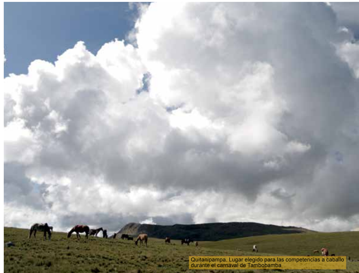
Quitaniyampa. Lugar elegido para las competencias a caballo durante el carnaval de Tambobamba