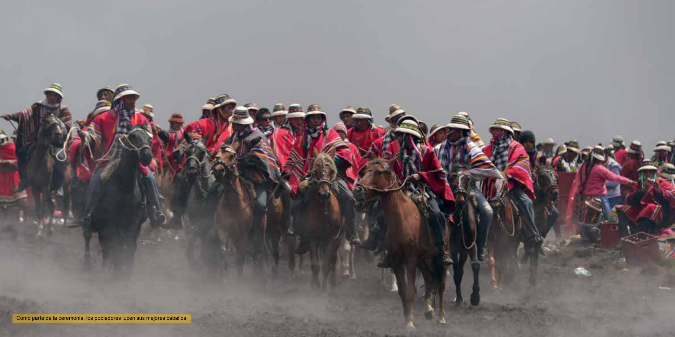
Como parte de la ceremonia, los pobladores lucen sus mejores caballos