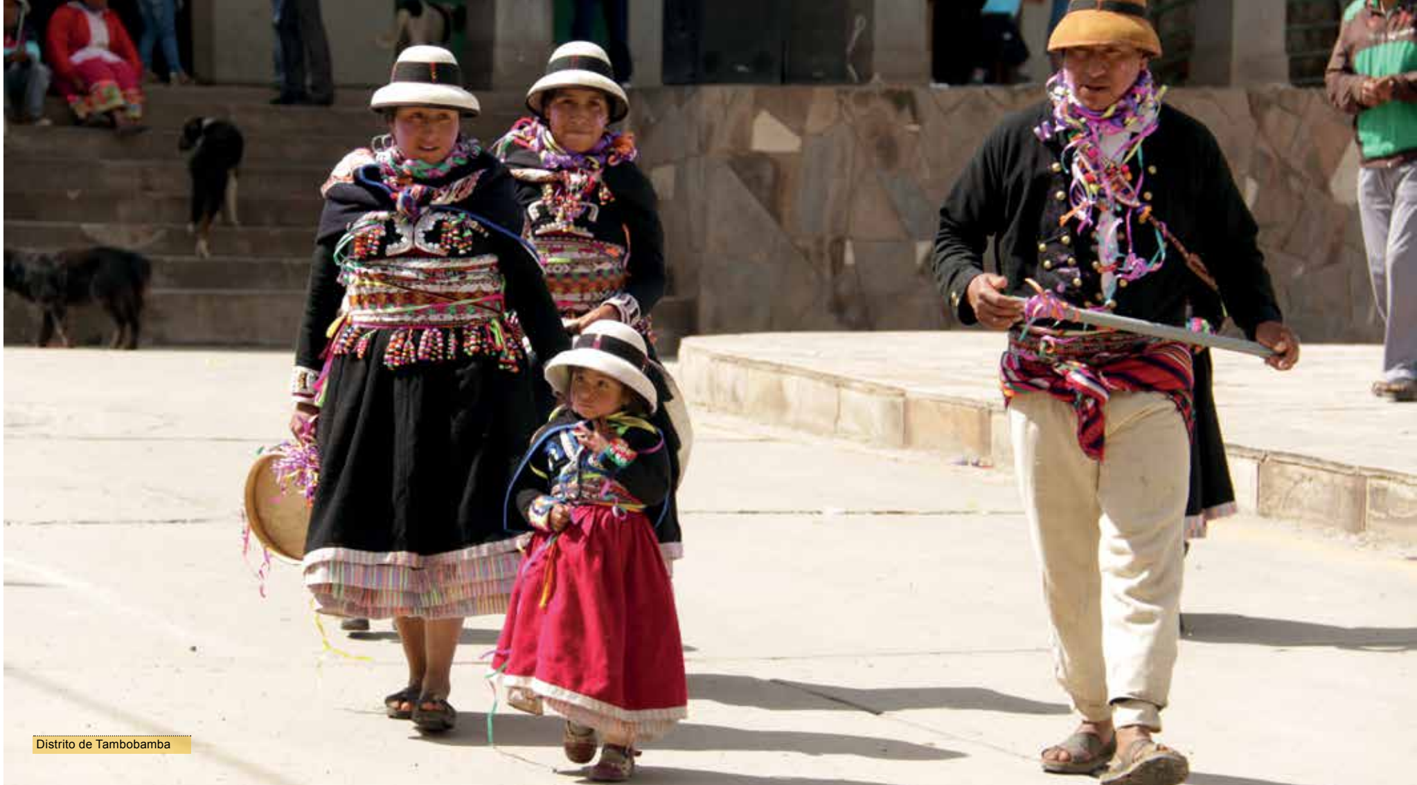
Distrito de Tambobamba