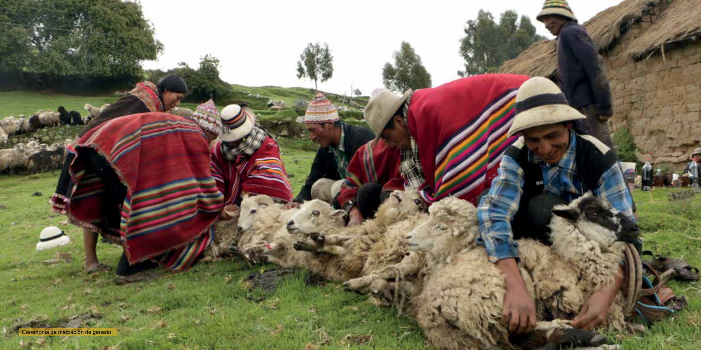
Ceremonia de marcación de ganado