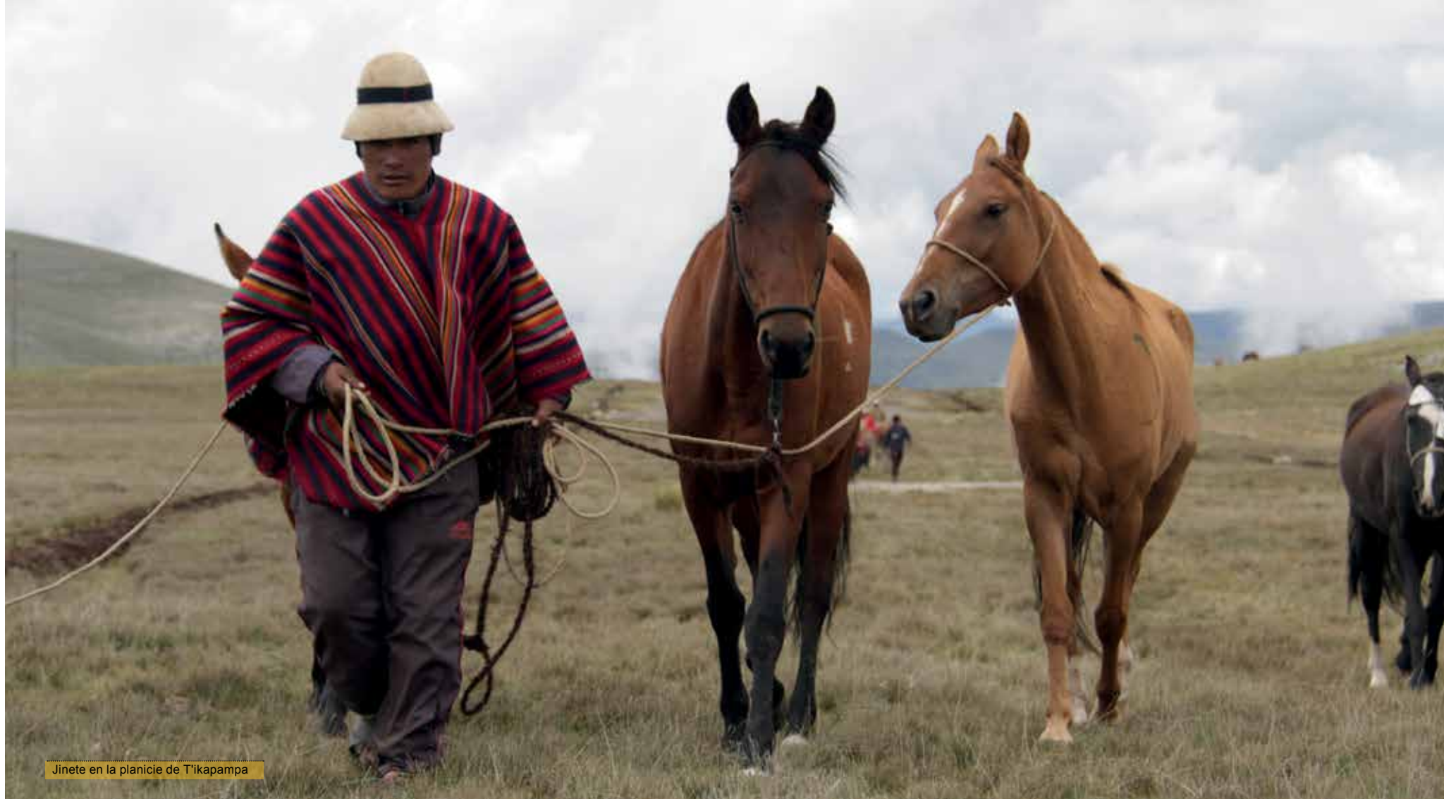
Jinete en la planicie de T'ikapampa