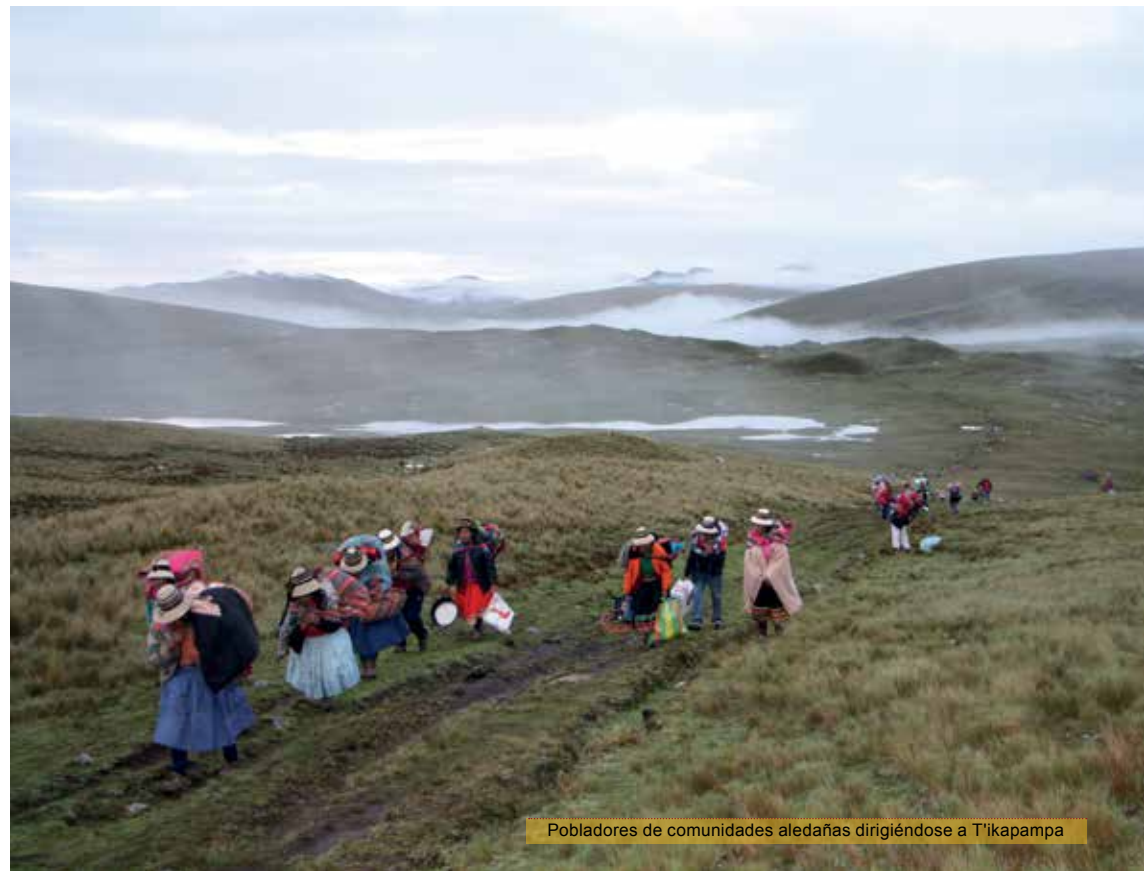
Pobladores de comunidades aledañas dirigiéndose a T'ikapampa

Poroto quiere decir frejol, en esa forma está más o menos el lugar. Cuando uno se ubica en la parte alta, en forma de poroto está prácticamente.