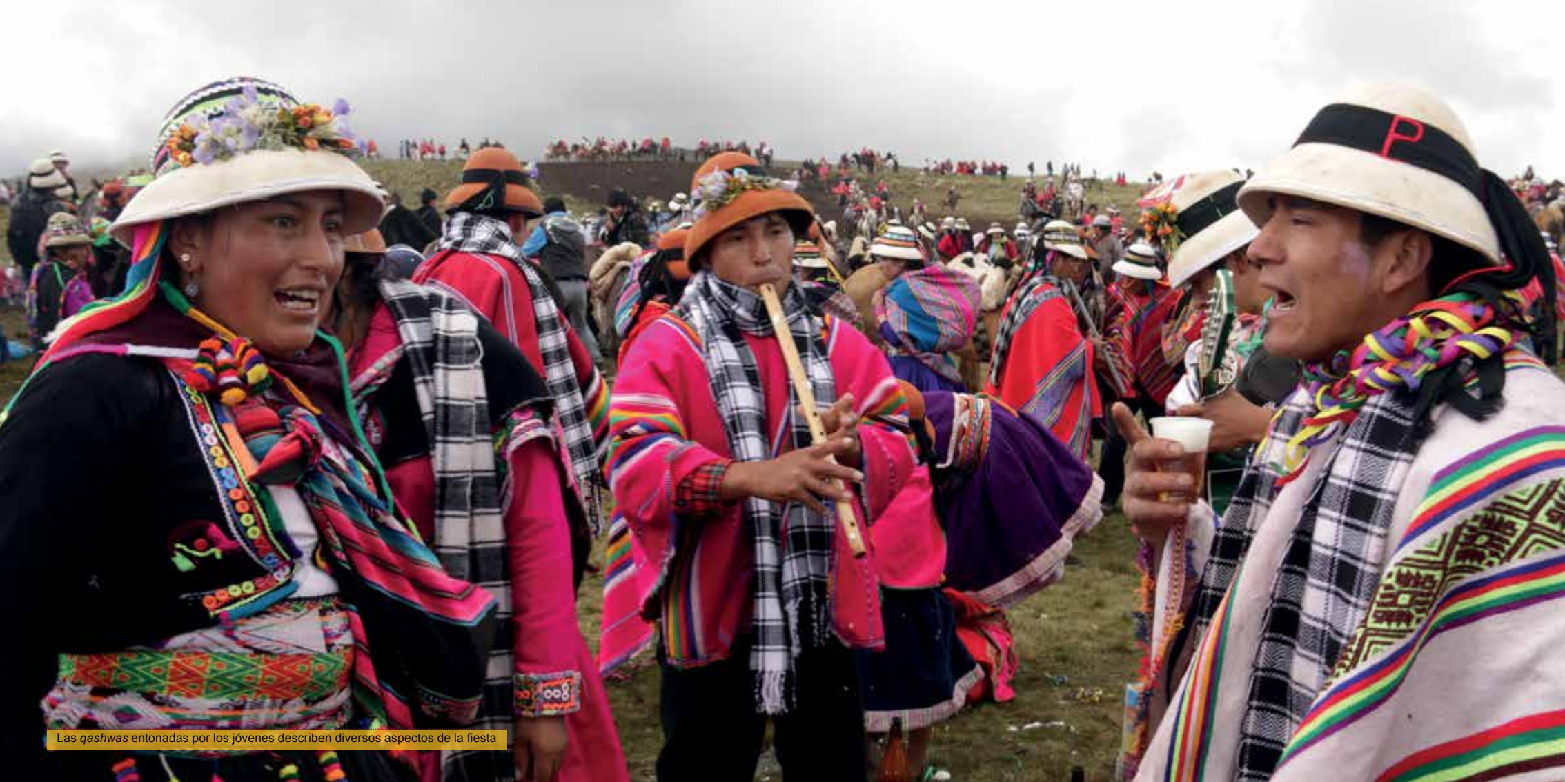
Las qashwas entonadas por los jóvenes describen diversos aspectos de la fiesta