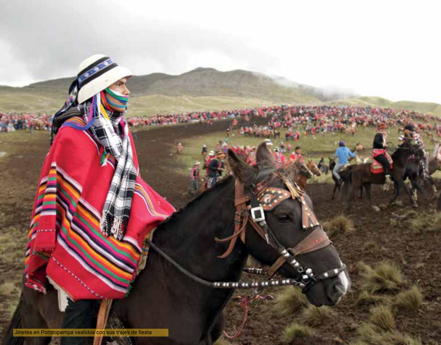
Jinetes en Porotopampa vestidos con sus trajes de fiesta