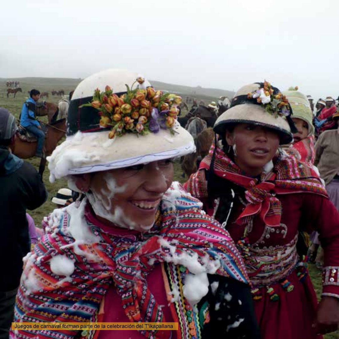
Juegos de carnaval forman parte de la celebración del T'ikapallana

los sitios de Hayllinus Pampa, Ñuñunwayuqkata y Patatay, antes de llegar a Tambobamba y a sus centros poblados de origen, ya llegada la noche. Las canciones hablan ahora del retorno del T'ikapallana, con la alegría de haber recogido las flores en T'ikapampa. La población sigue en su mayor parte unida por el festejo, que continuará celebrando con canciones, baile y licor, en sus centros poblados, hasta muy entrada la noche.