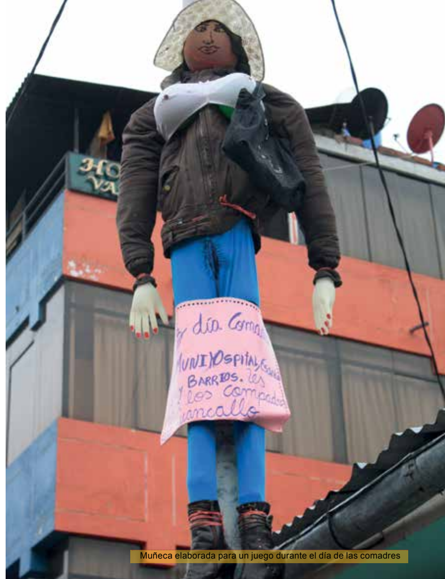
Muñeca elaborada para un juego durante el día de las comadres

Aquí en el pueblo de Tambobamba el día de compadres se elabora un muñeco. El día de compadres se representa a los varones; personifica a una autoridad, sea el alcalde o el regidor. Luego le sigue el día de comadres, se hace lo mismo que en compadres; el día de compadres las mujeres elaboran un muñeco representando al compadre. Y el día de comadres los varones elaboran una muñeca representando a la comadre, puede ser una regidora u otra autoridad. Para hacer el muñeco a veces nos traen o conseguimos, por medio de alguna persona, la ropa en la tarde o en la noche, y los dueños la reconocen cuando (el muñeco) ya está colgado en la plaza.