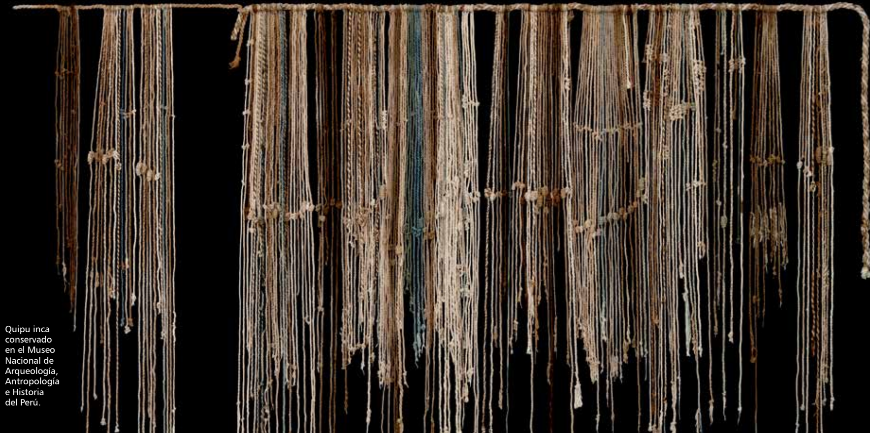
Quipu inca conservado en el Museo Nacional de Arqueología, Antropología e Historia del Perú.