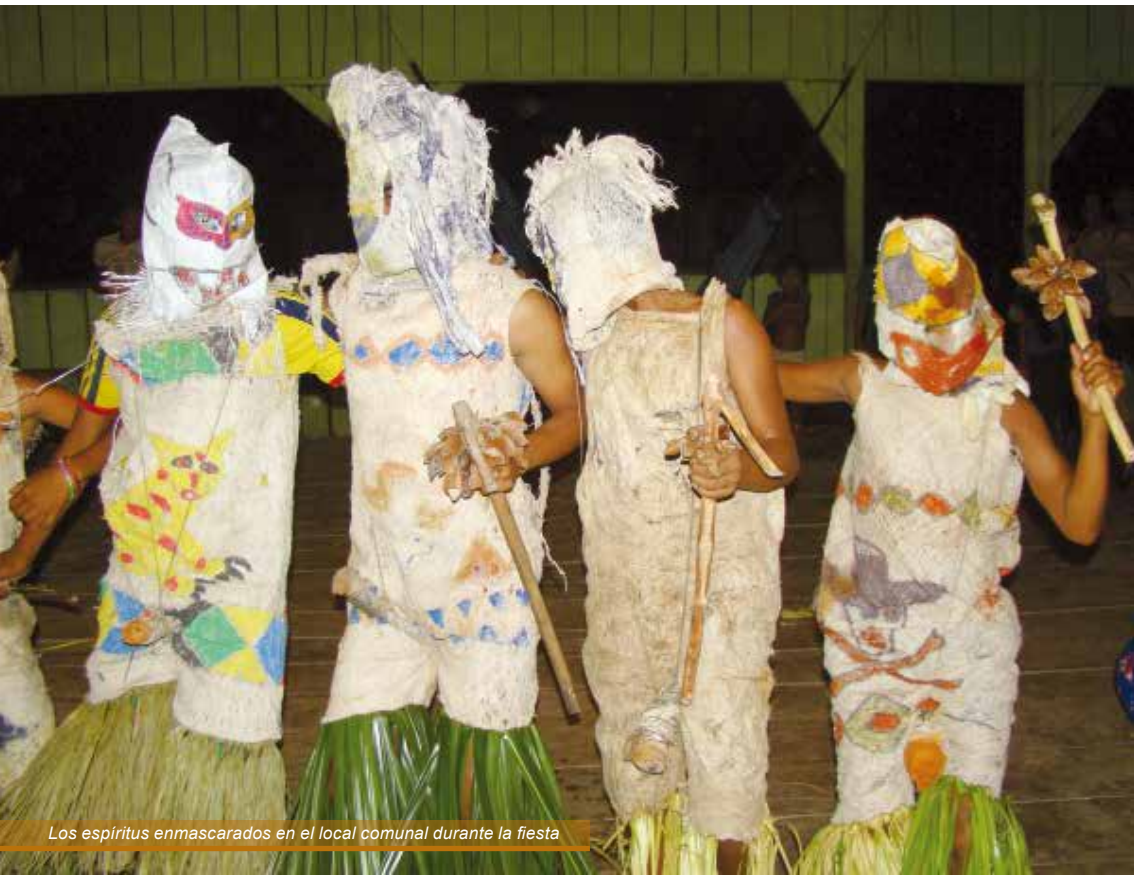
Los espíritus enmascarados en el local comunal durante la fiesta