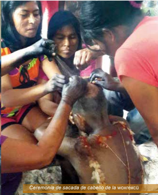
Ceremonia de sacada de cabello de la woxrexcü