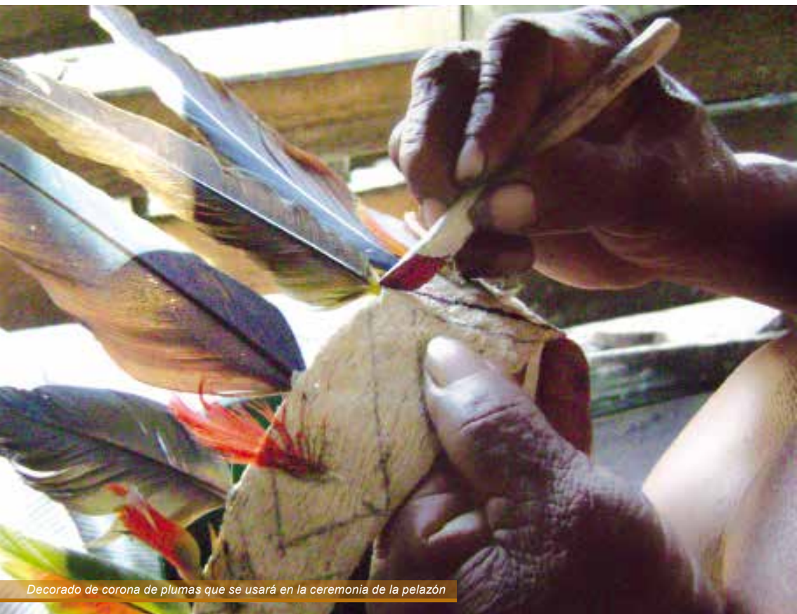
Decorado de corona de plumas que se usará en la ceremonia de la pelazón