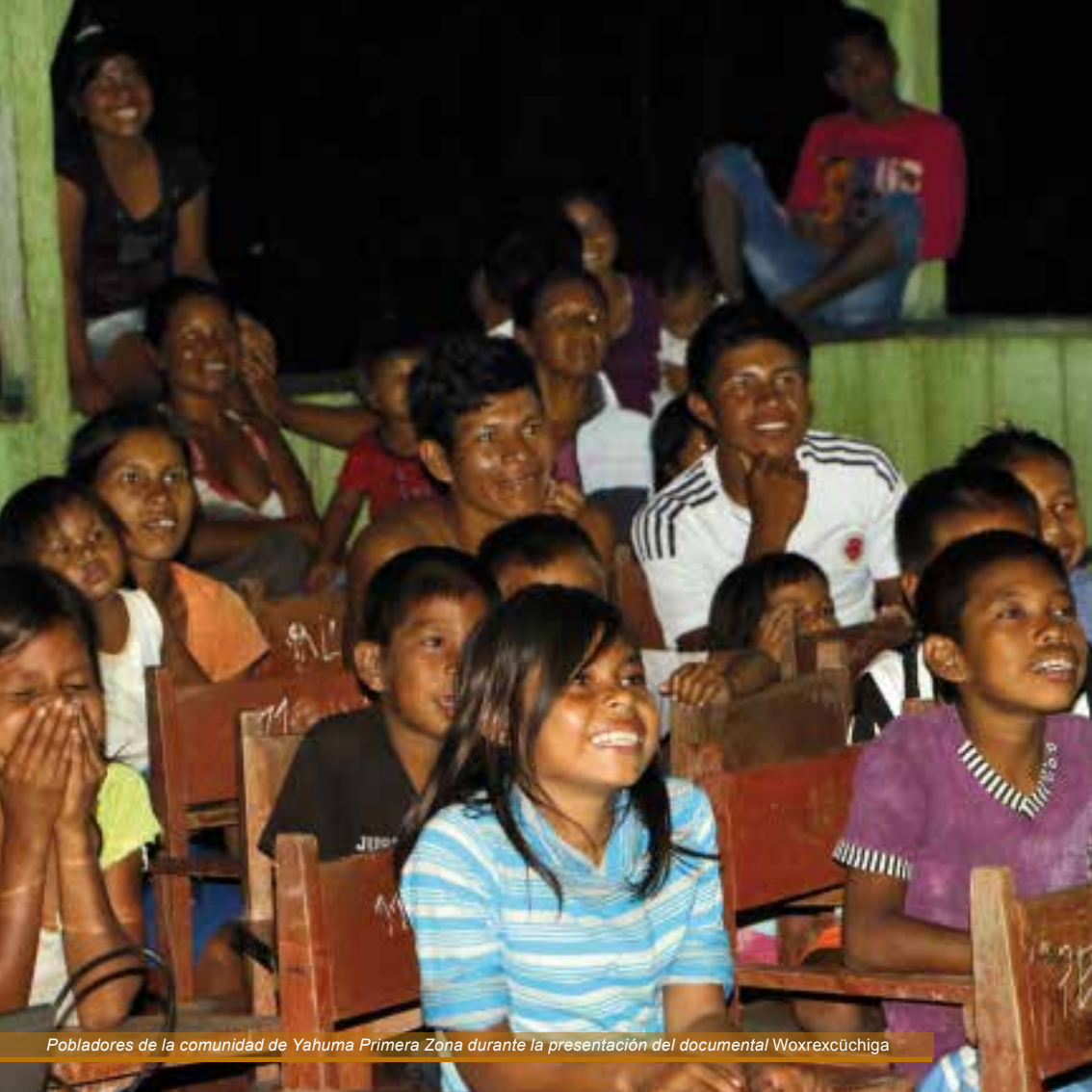
Pobladores de la comunidad de Yahuma Primera Zona durante la presentación del documental Woxrexcúchiga