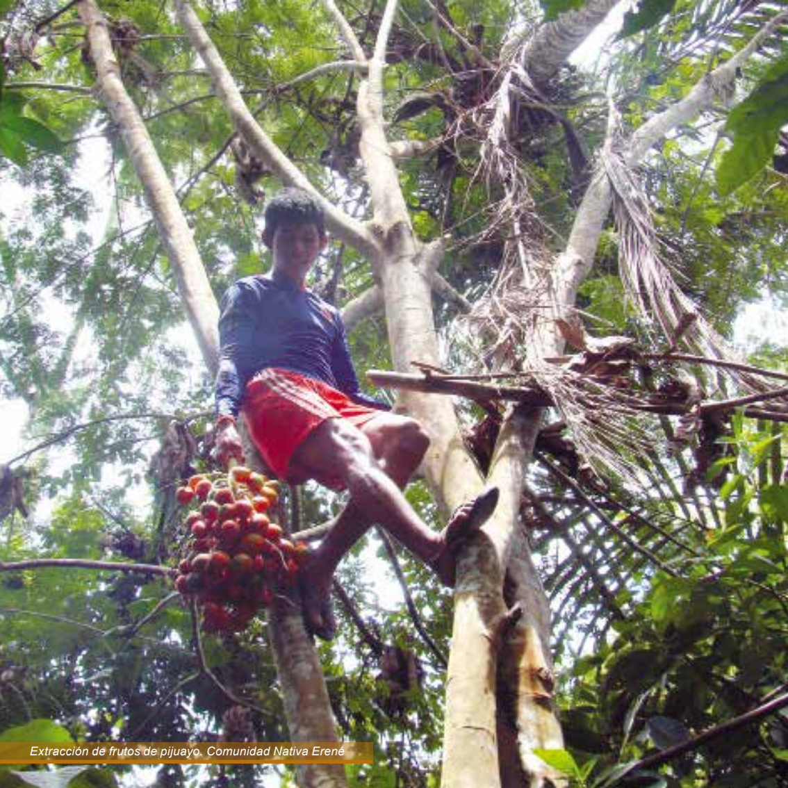
Extracción de frutos de pijuayo. Comunidad Nativa Erené