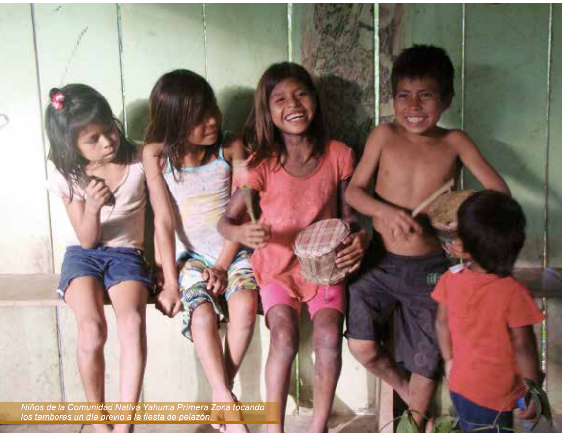
Niños de la Comunidad Nativa Yahuma Primera Zona tocando los tambores un día previo a la fiesta de pelazón.