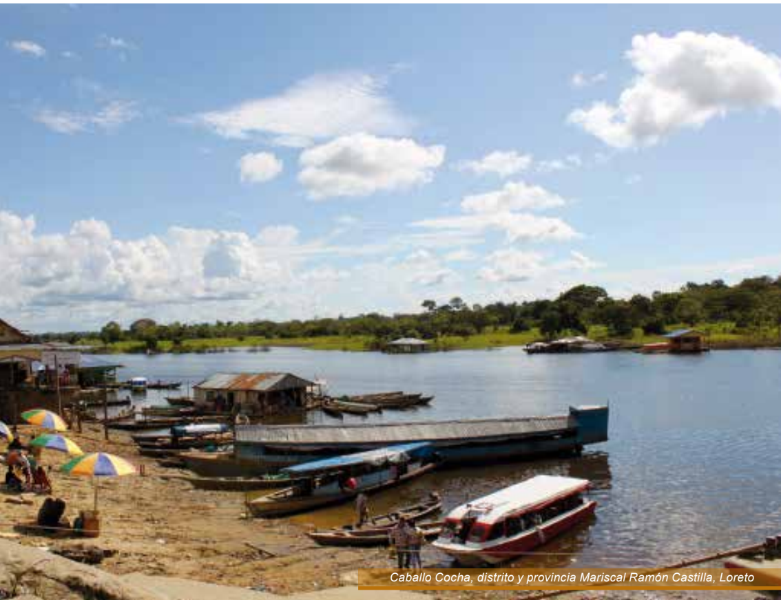
Caballo Cocha, distrito y provincia Mariscal Ramón Castilla, Loreto