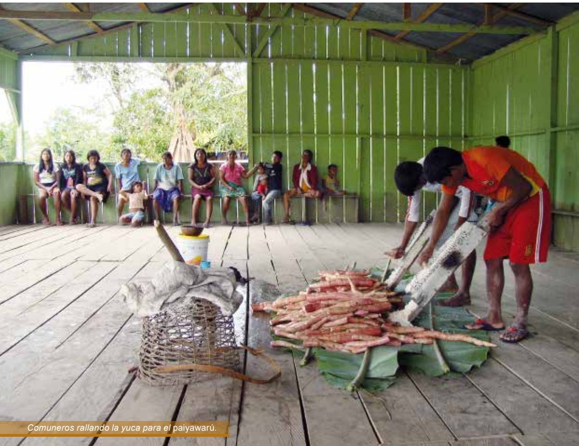
Comuneros rallando la yuca para el paiyawarú.