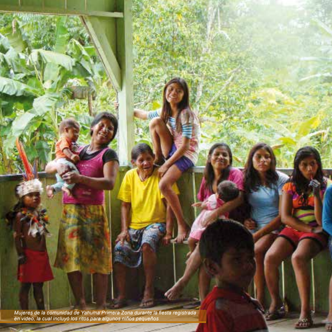
Mujeres de la comunidad de Yahuma Primera Zona durante la fiesta registrada en video, la cual incluyó los ritos para algunos niños pequeños