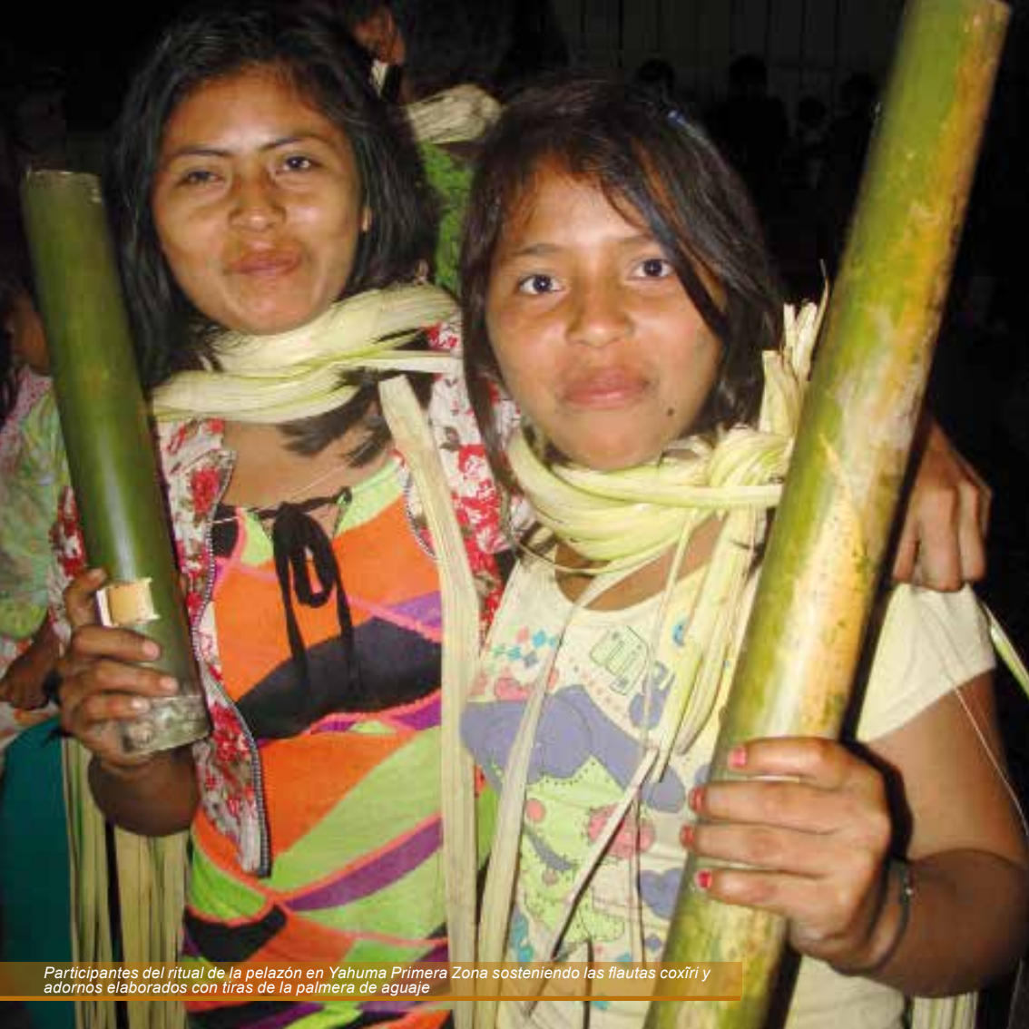
Participantes del ritual de la pelazón en Yahuma Primera Zona sosteniendo las flautas coxiri y adornos elaborados con tiras de la palmera de aguaje