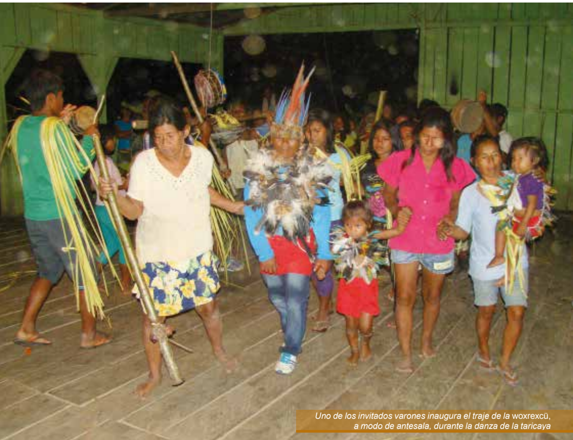
Uno de los invitados varones inaugura el traje de la woxrexcù, a modo de antesala, durante la danza de la taricaya