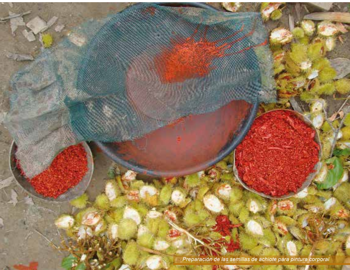
Preparación de las semillas de achiote para pintura corporal