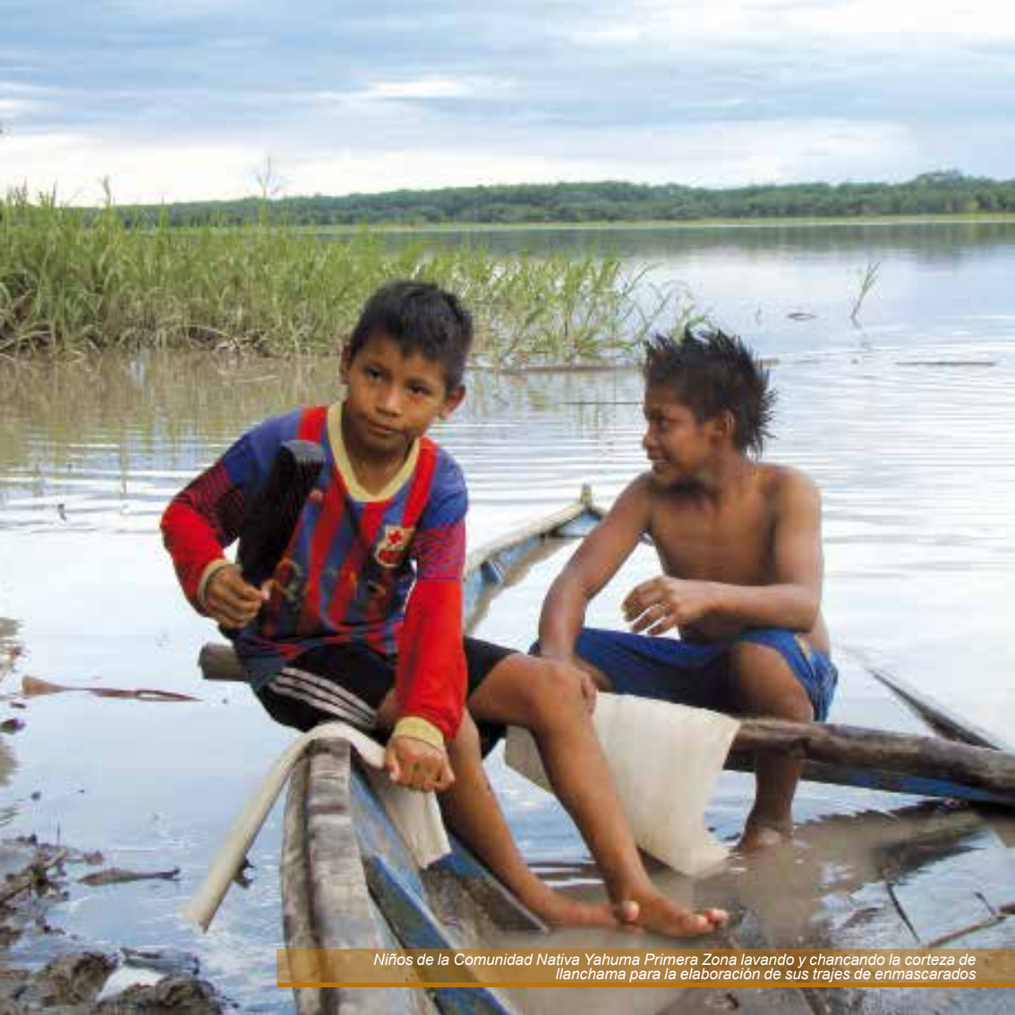
Niños de la Comunidad Nativa Yahuma Primera Zona lavando y chancando la corteza de llanchama para la elaboración de sus trajes de enmascarados