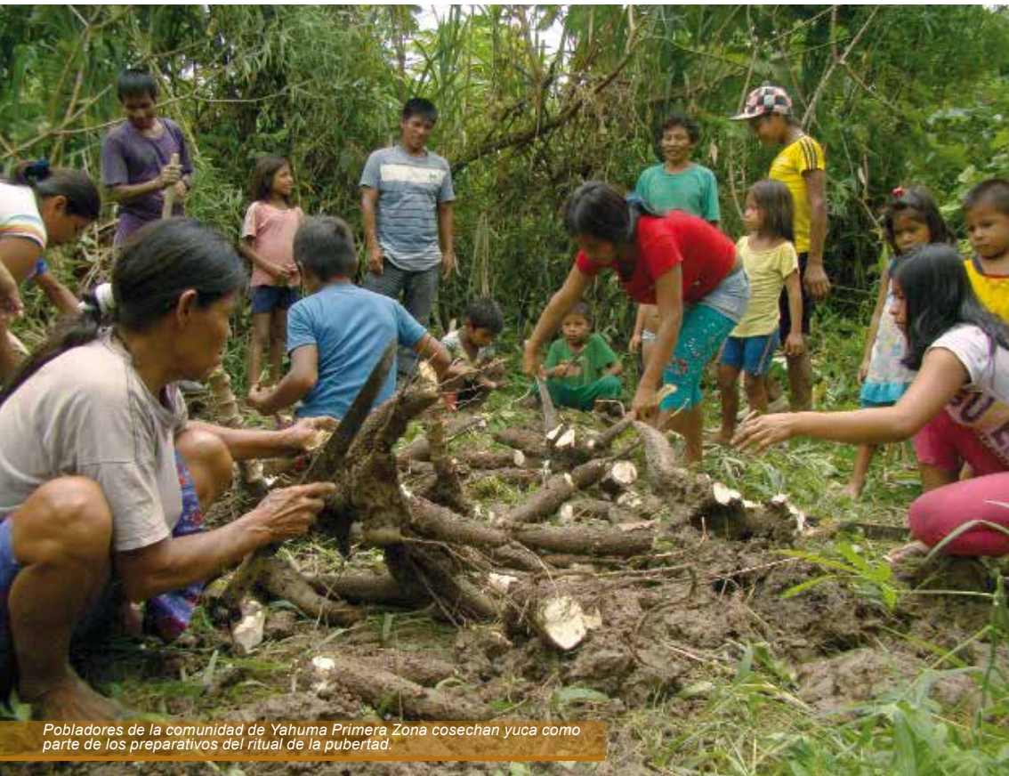
Pobladores de la comunidad de Yahuma Primera Zona cosechan yuca como parte de los preparativos del ritual de la pubertad.