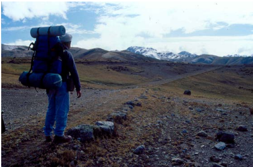
Camino en las alturas de Cajatambo

Siguiendo el itinerario de Miguel de Estete y efectuando las exploraciones arqueológicas en el campo, se identificaron secciones del mencionado camino Inca en buen estado de conservación, los ahora sitios arqueológicos aludidos en el documento de Estete, poblados actuales, la geografía asociada, etc. Es así como podemos reconstruir la ruta del camino Inca que comunicó Cajatambo con Pumpu en Junín, que en el siglo XVI estaban unidas por esta vía, siendo más de 100 km los que separan estas dos localidades.