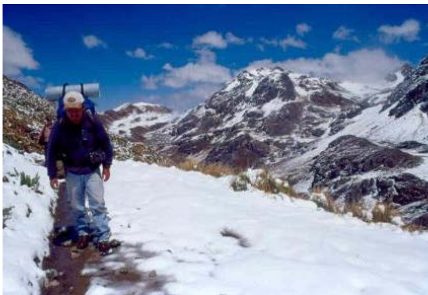
Camino en las inmediaciones a Quepog

atienden pobladores dedicados a la actividad pastoril. De ahí la observación de Estete en manifestarlo como pueblezuelo de pastores, quizás porque en comparación de los poblados grandes de Oyu y Caxatambo, la disposición de las viviendas de forma aglutinada daba la apariencia de ser menos organizada o posiblemente se trataba de un pequeño tambo 1 . Pasa una noche, para después muy temprano continuar hacia Pumpu atravesando Cerro Ventanilla y de allí internarse en el Bosque de Piedras de Huayllay, para tomar desde aquí el puente Rumichaca cruzando la última barrera natural del Río Conoc y llegar a Pumpu. Desde aquí siguió hacia Chacamarca, Tarmatambo para llegar a Xauxa y forzar la salida de Chalcuchimac para llevarlo a Cajamarca donde encontraría horrible muerte.