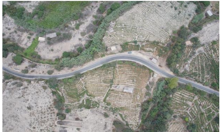
Vistas de las terrazas asociadas al sitio arqueológico Nieve Nieve. Aún está en discusión la función y el uso de las terrazas. Se especula que pueden ser desde terrazas de secado hasta campos para cultivos rituales, como la coca de la chaupi yunga