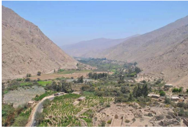
Vista del angosto valle del Lurín desde el mirador de Nieve Nieve en dirección oeste. En primer plano se puede apreciar parte de las terrazas de cultivo asociadas al sitio arqueológico.

Los valles costeños son rutas naturales entre las alturas andinas y las yungas. El valle de Lurín, además de su importancia como corredor que facilitaba el intercambio en la economía prehispánica 4 , también habría tenido una significativa importancia ritual desde épocas anteriores a la incaica por haber sido una ruta de peregrinaje que unía dos santuarios de gran importancia: Pachacamac en la costa y Pariacaca en las alturas de Yauyos. Sin embargo, al parecer la integración cultural entre serranos y yungas recién se dio durante el Horizonte Tardío (Salomon et. al., 2009).