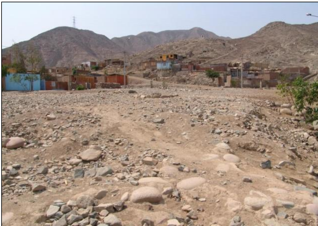
Área libre destinada para parque en el poblado Las Terrazas, como parte del Sector VI de la Zona Arqueológica, con vista general en primer plano de las cabeceras de muros pre-cerámicos de lajas y cantos rodados.