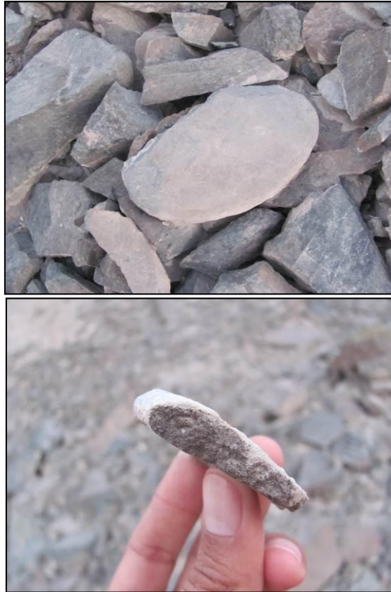
Restos de dos artefactos en material diferente ubicados en la superficie del sitio PV48-55B. Izquierda: Disco de piedra. Derecha: Fragmento de cerámica correspondiente a una olla sin cuello.

Asimismo, en el Sector IV, área ocupada originalmente de manera exclusiva por las cistas y que posteriormente con la ocupación Tawantinsuyo se empezará a poblar con otro tipo de estructuras de carácter monumental, ubicamos muy cerca de estas últimas lo que parece ser una plataforma baja con acceso frontal y patio orientados al sur - hacia la naciente de la quebrada- como posible estructura temprana, al ser su aspecto arquitectónico formal muy diferente a los de alrededor y demás sectores del sitio tardío (Ruales et al. 2013: 81).