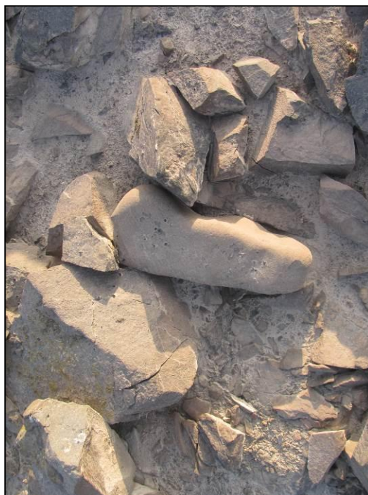
Batán y mano de moler in situ, ubicados en dos espacios distintos del sitio PV48-55B.