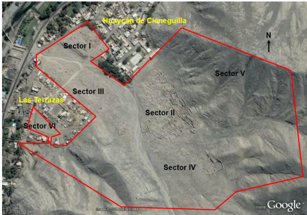
Vista aérea de la zona arqueológica de Huaycán de Cieneguilla con su poligonal de intangibilidad, donde se muestra los seis sectores identificados y los poblados actuales que la circundan.

Así Huaycán de Cieneguilla como zona arqueológica, se ubica en la parte superior del valle bajo del río Lurín, a una altitud de 449 msnm, punto que vendría a ser el inicio de la chaupi yunga , una zona ecológica de transición entre la costa y la sierra que se encuentra entre los 500 y 2000 msnm (Feltham 2009), un espacio geográfico codiciado en tiempos prehispánicos por ser zona apta para el cultivo de la coca (Rostworowski 1973; Marcus y Silva 1988). El asentamiento se encuentra emplazado al pie de la quebrada Huaycán, ocupando ambas márgenes de la terraza aluvial, a su vez flanqueado por las estribaciones del cerro Señal Perdida hacia el oriente y el cerro Mal Paso hacia el occidente, lo mismo que vino a suceder con el establecimiento moderno de dos poblaciones: Huaycán de Cieneguilla en su margen derecha y Las Terrazas en su margen izquierda, pertenecientes políticamente al distrito de Cieneguilla, en la provincia y departamento de Lima.