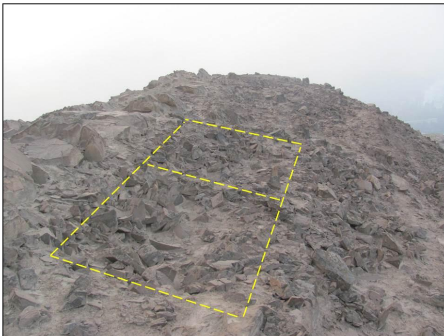
Compartimiento rectangular con muro divisorio como arquitectura del sitio PV48-55B.