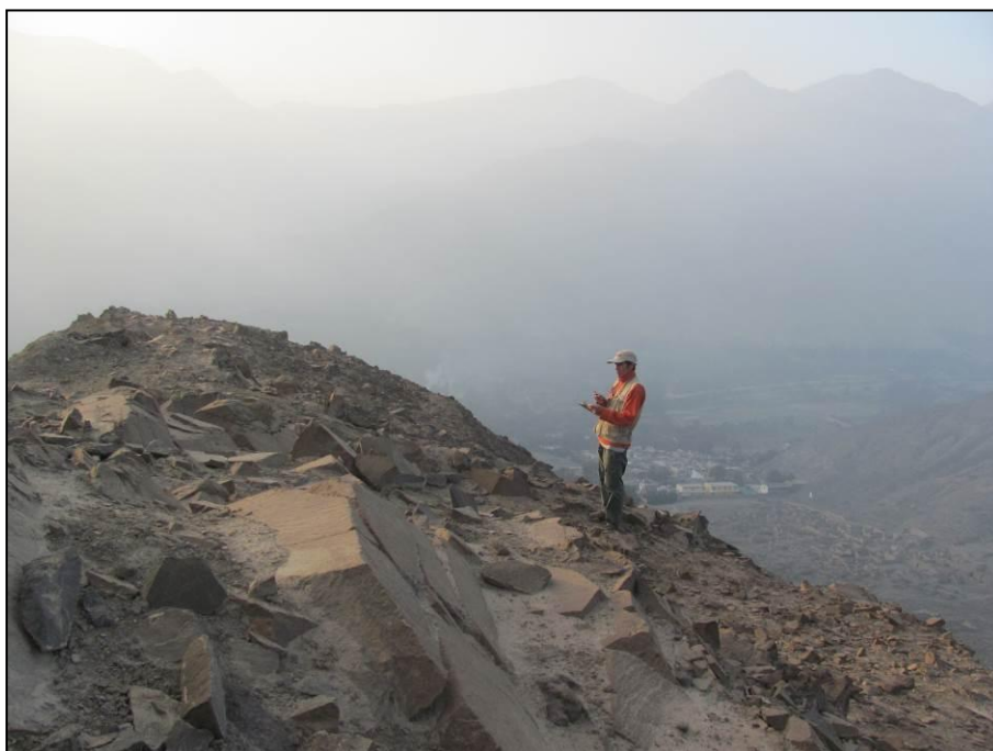
Observación de cortes hechos al relieve de la roca en el sitio PV-48-55B, flanco este de la cumbre del cerro Mal paso, con vista al fondo de la quebrada Huaycán con el asentamiento tardío.