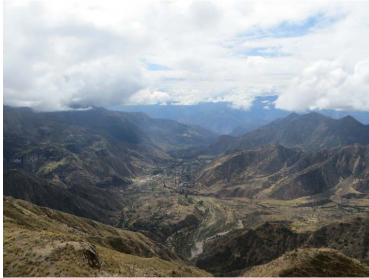
Foto 3. Al fondo territorio del distrito de Ocros, lugar de paso del ejercito insurgente.

Una de las acciones para la puesta en uso social del Sistema Vial Andino es la Ruta Qhapaq Ñan que, en su Tercera Edición, se denomina “Ruta de la Emancipación” en conmemoración al Bicentenario de la Rebelión Sur Andina de 1814-1815.