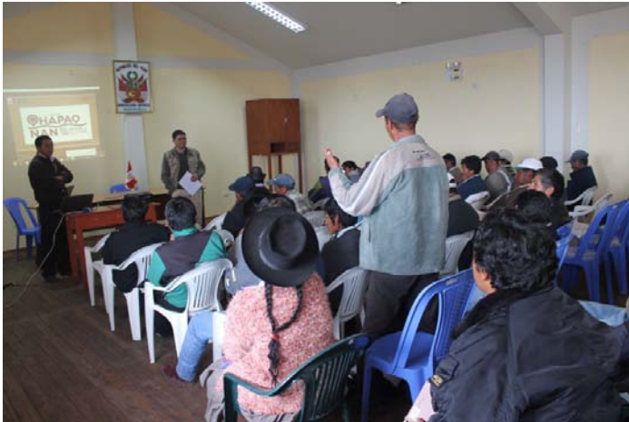
Foto 2. Población de Huamanguilla en diálogo con el equipo técnico del Qhapaq Ñan y docente de la Universidad Nacional San Cristóbal de Huamanga sobre el proceso histórico de su localidad.

El proceso de la rebelión de 1814, que algunos historiadores denominan como la Insurrección del Cusco (Husson, 1992), involucró una serie de comunidades. Muchas de ellas, en la actualidad, carecen de información respecto a la participación de sus antepasados en el proceso de emancipación; tal es el caso del distrito de Huamanguilla, cuya participación presenta escasa información sistematizada y lo que se escribió no ha sido difundida entre la población de esta localidad.