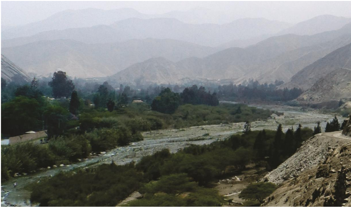
Fig. 2: El fondo del valle por el cual se desplaza el río Lurín. Aunque constantemente modificado por la acción humana, es el espacio de mayor densidad de vida gracias al agua venida año tras año.

El paisaje natural que rodea a Huaycán de Cieneguilla está caracterizado principalmente por el contraste entre dos ambientes muy distintos dentro de esta sección del valle correspondiente al actual distrito de Cieneguilla: por un lado tenemos un entorno verde que corresponde al fondo del valle, formado por el fértil suelo aluvial y que es surcado por el paso del río Lurín procedente de las alturas andinas (Fig. 2); y del otro lado, se encuentra el entorno gris correspondiente a las áridas quebradas laterales y macizos que conforman las estribaciones andinas de la vertiente del Pacífico (Fig. 3).