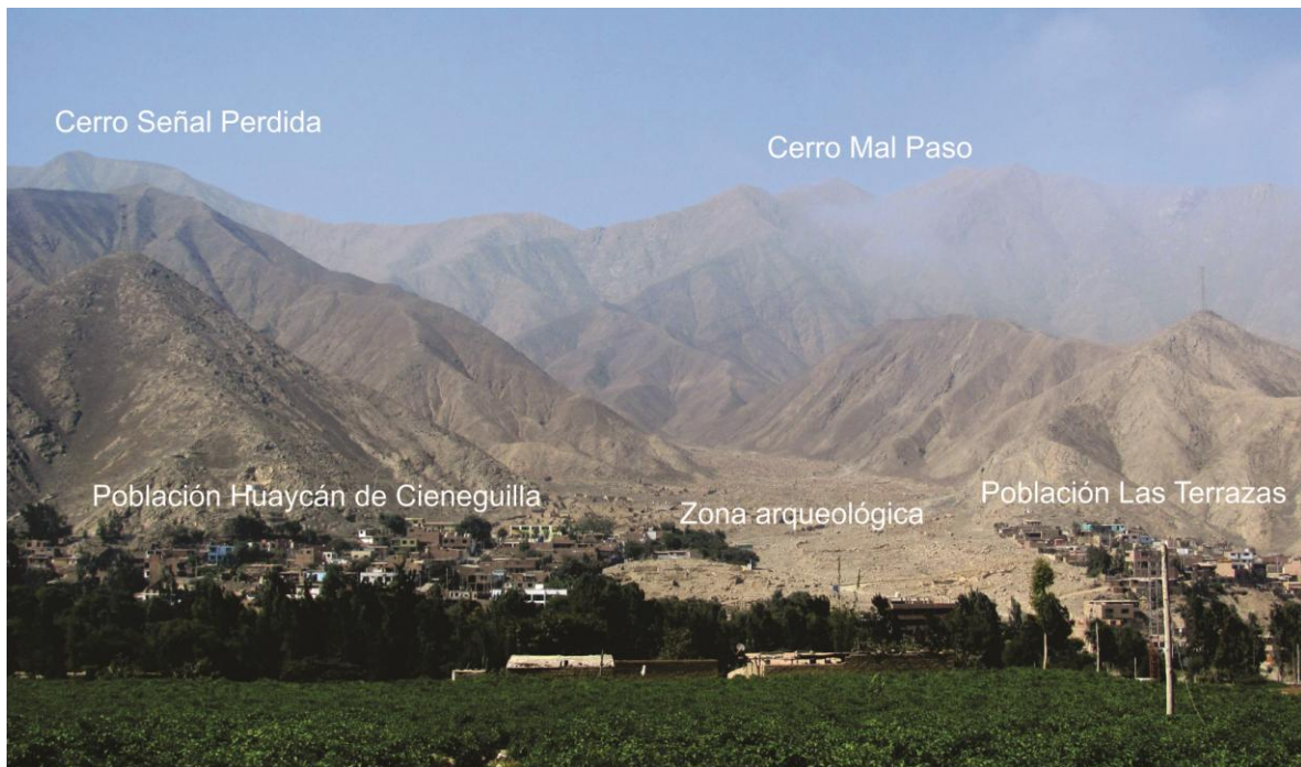
Fig. 4: Vista de la quebrada Huaycán desde la desembocadura de la quebrada Molle.