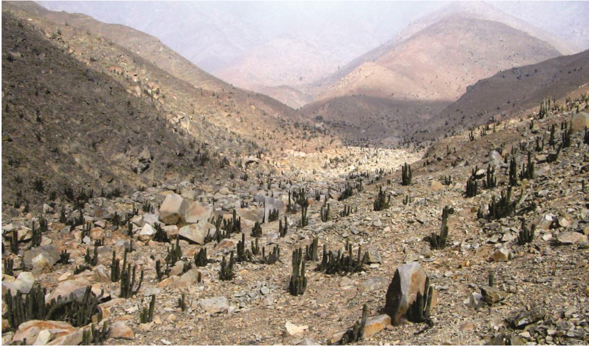
Fig. 3: Las áridas quebradas laterales aparentemente yermas albergan un ecosistema poco conocido del distrito.

Con la modernidad, esta forma de aprovechamiento del suelo cultivable ha venido sufriendo muchas alteraciones, pues el valle que alguna vez fue principalmente agrícola ha sido parcialmente mutilado por el cambio en el uso de los suelos debido a la expansión urbana periférica de la ciudad de Lima, así como el emplazamiento apresurado de las jóvenes poblaciones sobre algunas zonas, incluso con riesgo potencial de ser afectadas en caso de presentarse un incremento en el volumen del agua del río.