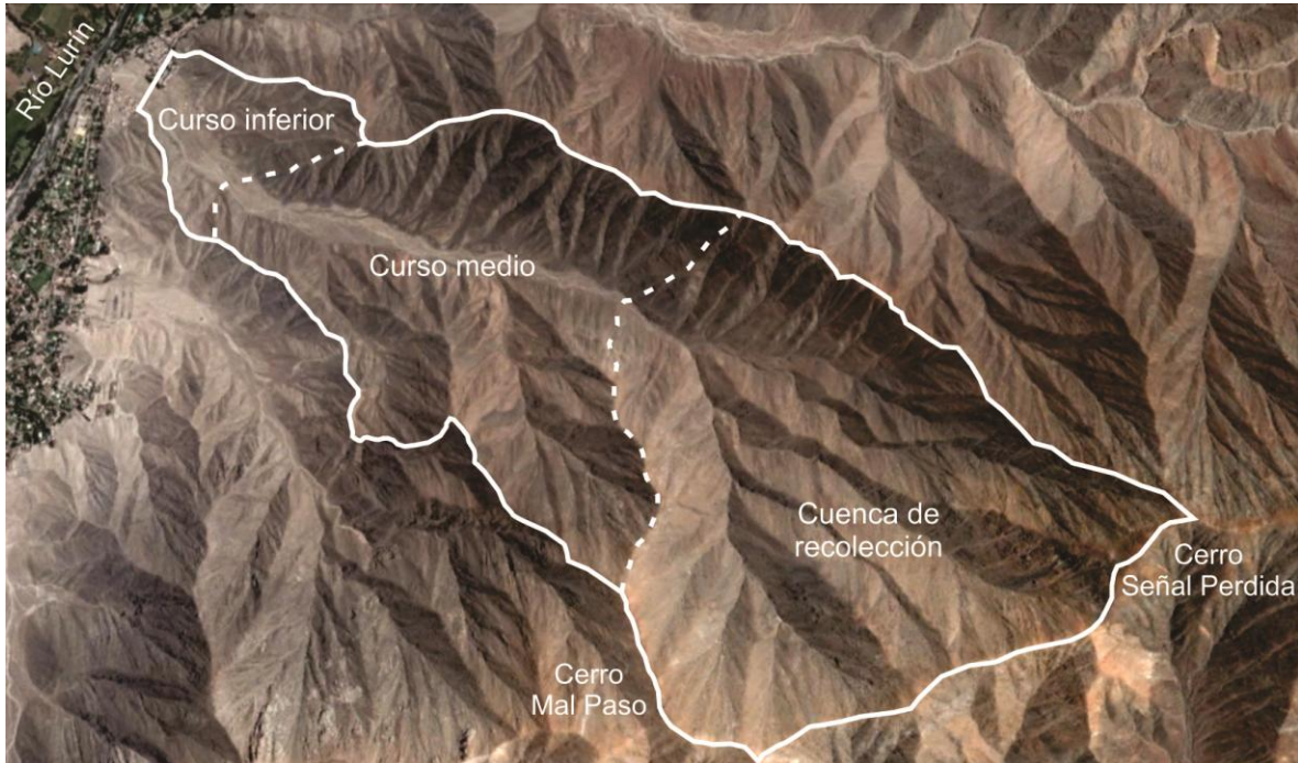
Fig. 5: Imagen aérea de la microcuenca que conforma la quebrada Huaycán.

fuerres precipitaciones sobre la cuenca de recolección podrían potencialmente reactivar el drenaje de los cauces normalmente secos, los cuales podrían acarrear agua hacia el cauce principal con cierta velocidad debido al grado de inclinación del terreno; esto hace que el drenaje de esta quebrada sea efímero y extraordinario a la vez (Ccente y Cerpa 2009b: 7-8).