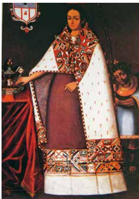
Retrato de ñusta, acompañada de símbolos hispanizados de la nobleza indígena. S. XVII. Museo Arqueológico del Cusco.