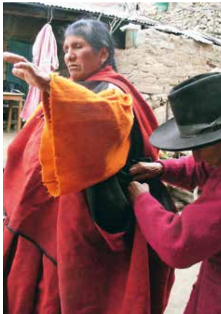
Proceso de vestir el anaco. Arriba, sujetando el anaco con los pchich'is o tupus, abajo, sujetándolo a la cintura con la wak'a, dejando ver las mangas de la mancaza.