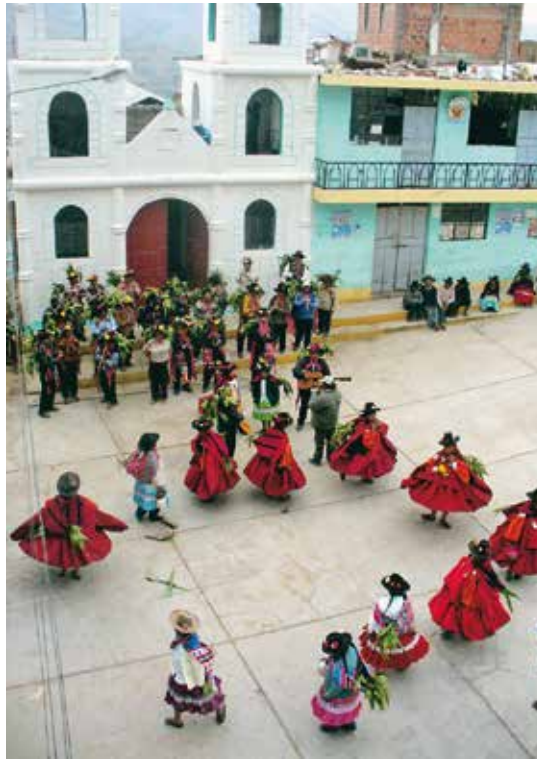
"Parada" al frente de la iglesia en plaza central de Camilaca