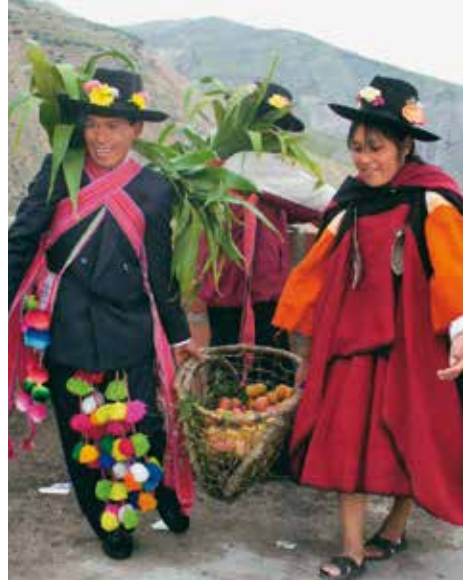
Machaqa o fiscalillos entrantes en función de servicio.