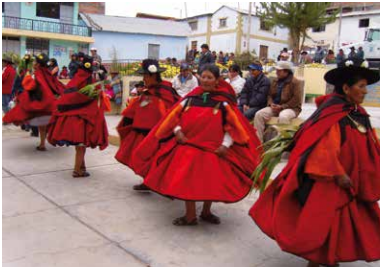
Pascua. Fiscalillos mujeres y esposas de autoridades bailando en formación de "marcha" con el anaco festivo, alrededor de la plaza principal.