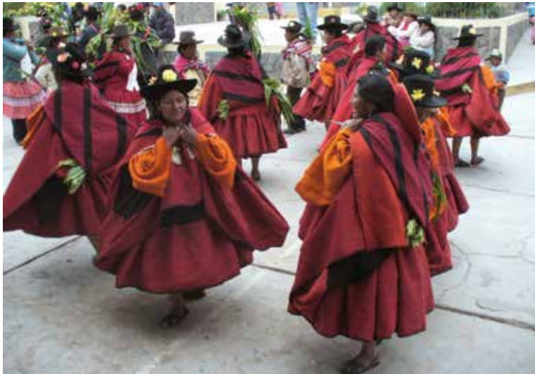
Procesión de lunes de Pascua.