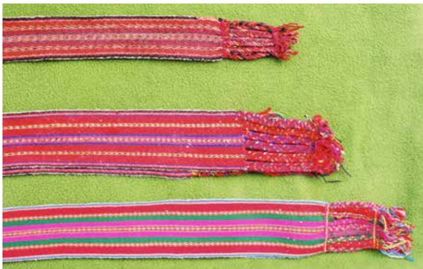
Wak´as o fajas. Las dos primeras son fajas de primer fiscalillo, de dominante roja, la primera del tipo antiguo y la segunda del tipo que se elabora actualmente. La tercera es para fiscalillo saliente, que usa otros colores aparte del rojo.