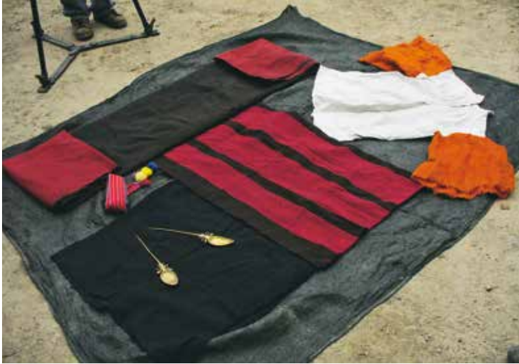
Algunas prendas y accesorios que componen el anaco.