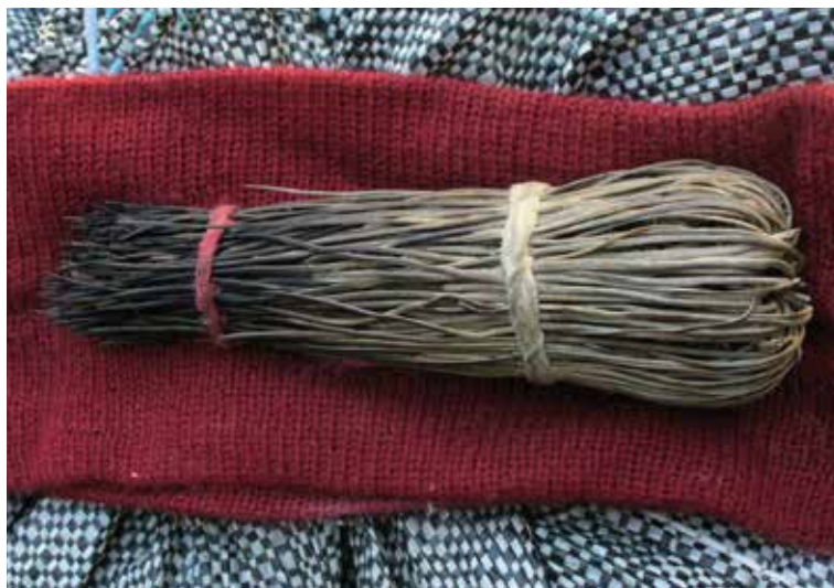
Chajraña, peine hecho de raicillas.