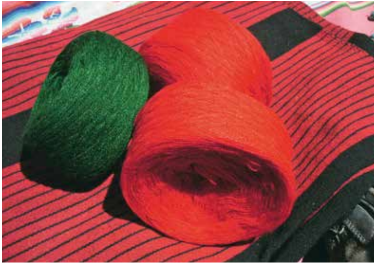
Khaytus de lana de alpaca listas para el tejido.