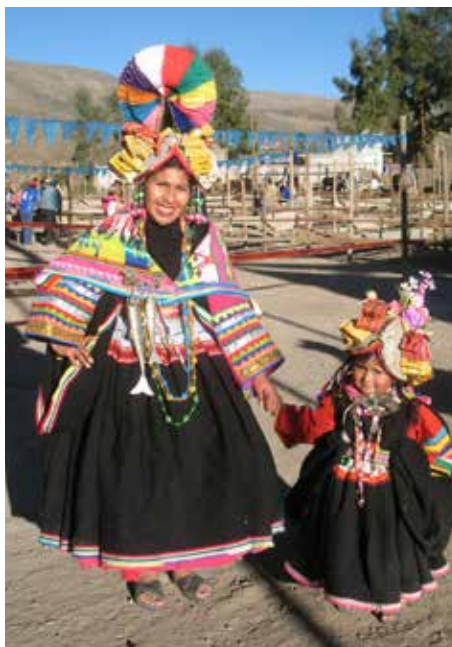
Madre e hija vestidas con el anaco de fiesta, cubierto por multitud de adornos, en San Cristóbal, distrito de Cuchumbaya, Moquegua. Aparte del color y los accesorios, esta vestimenta sigue el mismo patrón que el anaco de Tacna.