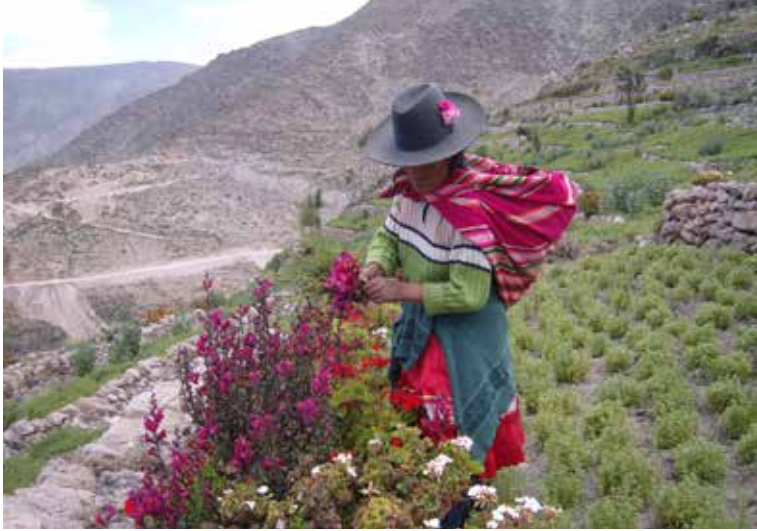
Recogiendo flores para la fiesta de Pascua. Al fondo, cultivo de orégano en andenería