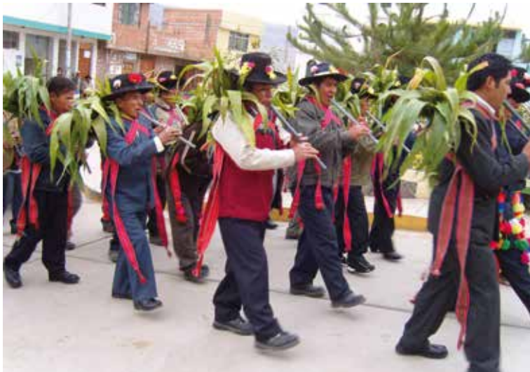
Fiscalillos varones y autoridades, ataviados con fajas y chalas de maíz, marchan tocando la tonada de Pascua.