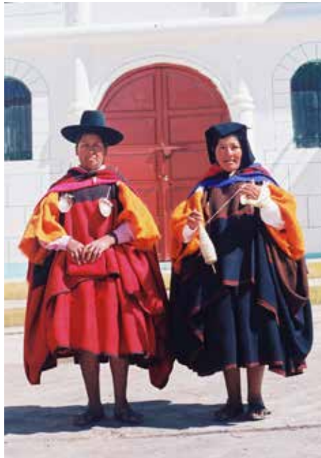
Los dos tipos de anaco de Camilaca: el festivo, de rojo encendido con ribetes negros, y el cotidiano, de color marrón y negro naturales, ambos con los mismos componentes.