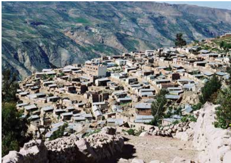
Vista panorámica del pueblo de Camilaca