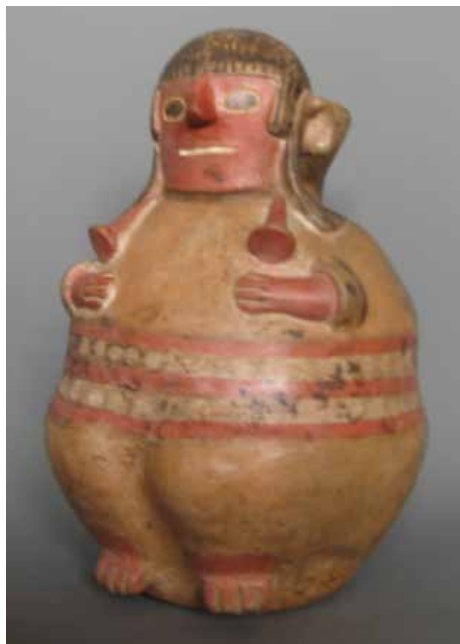
Mujer vestida con un acso, sujeto con un chumpi o cinturón y dos tupus. Pieza de cerámica Recuay (sierra de Ancash, 200-600 d.C). Colección MNAHP