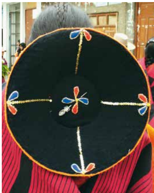
Montera, vista de la copa con el acabado de grecas y bordados.