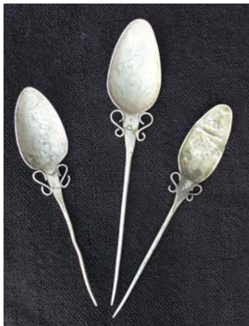
Tupus o pich'is de bronce y plata. Arriba, de gran tamaño para sostener el anaco; abajo, pequeños para sujetar el tocado.