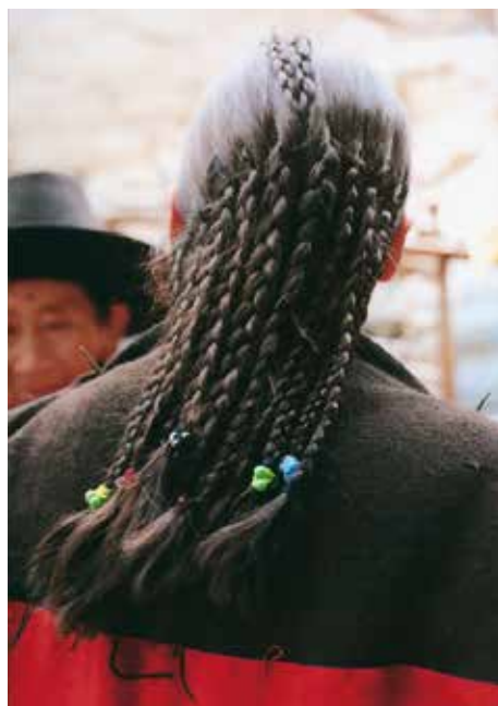
Dos versiones del peinado chini k'ana. Obsérvense las dos trenzas en la coronilla, para sujetar el tocado con un tupu pequeño.