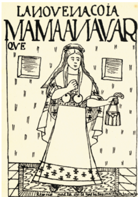
Mama Anahuarqui, novena Coya, según Guamán Poma de Ayala. Obsérvese el uso de tupus colgantes que penden sobre el chumpi o cinturón, similares a los de la actual comunidad de Tupe (Yauyos)