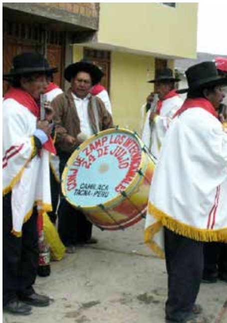
Miembros del conjunto 24 de Junio, conocidos como “Los Ponchos Blancos”, exponentes de la música tradicional aimara de Camilaca. En la foto, el sikuri tradicional se toca actualmente con instrumentos de metal, al ser escaso el material original de caña