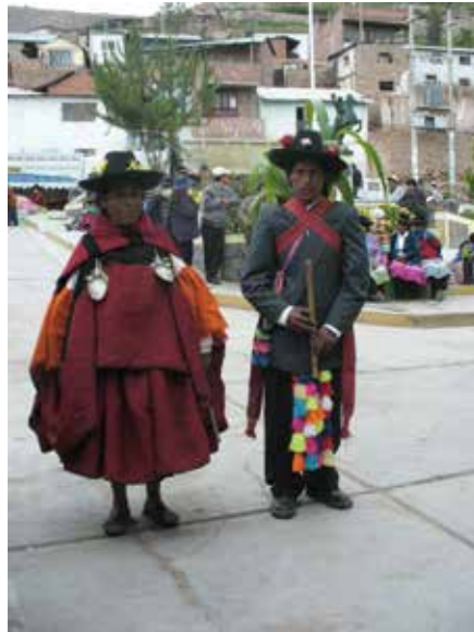
Danza de devoción a la cruz de Oratillo.