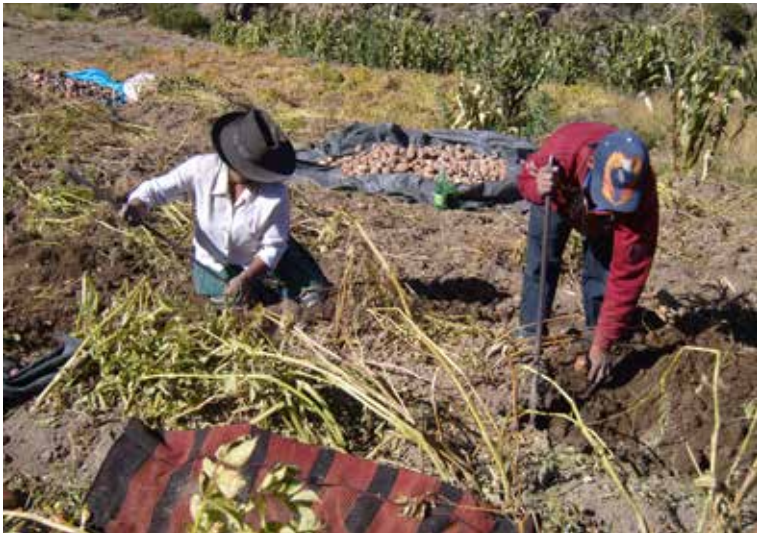
Cosecha de papas. Obsérvese el manto en primer plano, usado para carga.