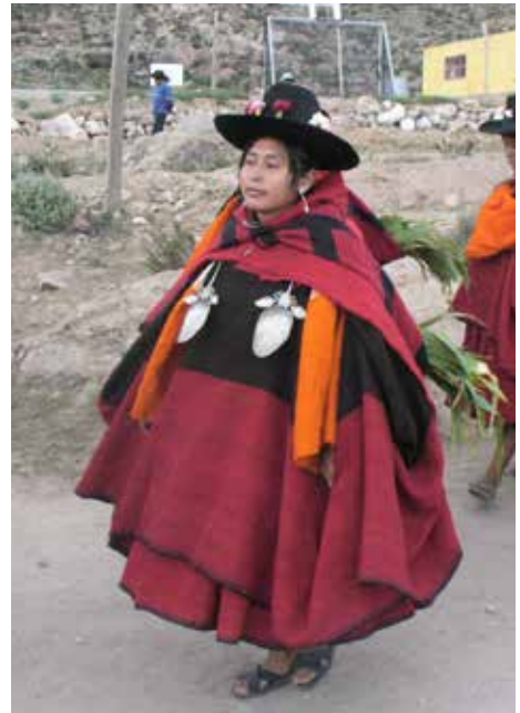
Arriba, la Virgen Natividad según una pintura mural en una pared lateral de la Iglesia del pueblo antiguo de Camilaca. La forma y color de su vestimenta son asociadas al anaco de fiesta. Abajo izquierda, detalle de la pintura. Abajo derecha, mujer con anaco tradicional.