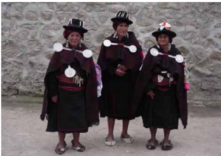
Mujeres de Tupe (Yauyos, Lima) con su vestimenta tradicional, el anaco envuelto y sostenido por el cinturón y dos tupus en forma de láminas colgantes, cubiertas por el manto. El manto está sujeto, a su vez, con dos tupus a modo de alfileres de gran cabeza repujada.