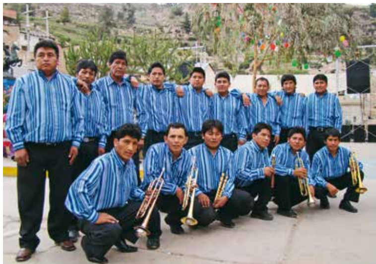
Orquesta Los Incomparables de Camilaca, uno de los más importantes exponentes del moderno wayno festivo, que combina instrumentos tradicionales con batería y orquesta de metales, destacando el uso de trompetas con sordina.