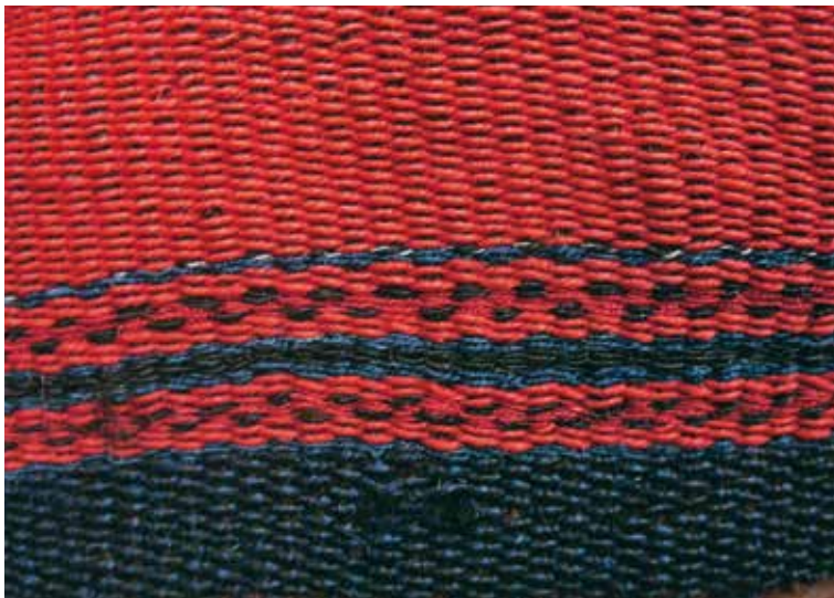
Detalle del iraka u orillo del anaco de fiesta.