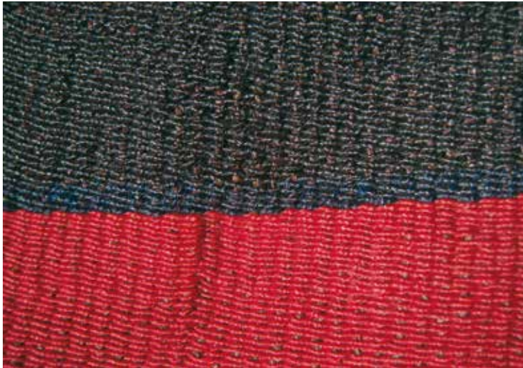
Detalle de la trama de un anaco. Son visibles los hilos de la trama base sobre la cual se teje la urdimbre.