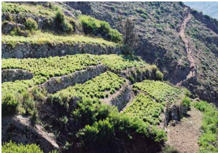
Cultivo de orégano en andenería, sostenido con un antiguo y complejo sistema de regadío.