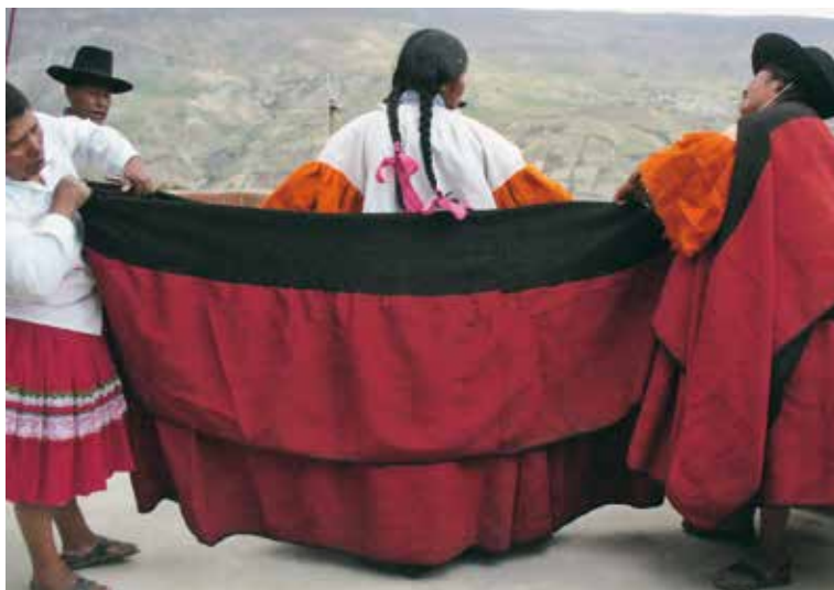
Para la colocación del anaco se hace un doblez longitudinal del lienzo a la altura de los hombros de la usuaria, ocultando la mayor parte del área central qallu.