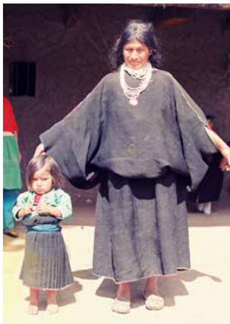
Mujer de Sondorillo, Piura, mostrando el anaco del tipo prehispánico costeño, una túnica ancha cerrada, ajustada con un cinturón. Este traje fue llamado capuz por los españoles.