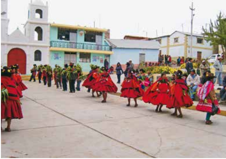
Procesión de lunes de Pascua.