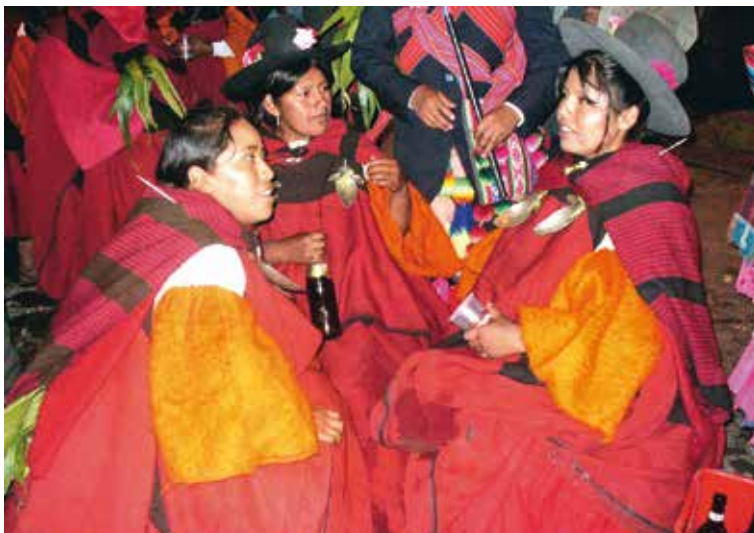
Aqtasi o competencia de bebida, celebrada al final de la Pascua, en que los fiscalillos entrantes consumen grandes cantidades de cerveza evitando dormir o perder la compostura. Los resultados de esta competencia no solo señalan la responsabilidad del joven, sino que son tomados como predicción de las lluvias del año por venir.