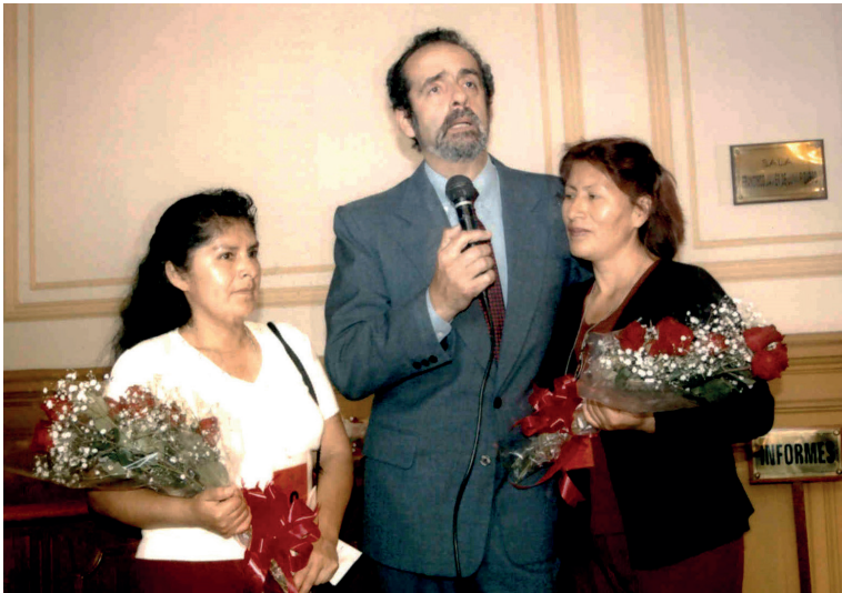
Homenaje por el Día de la Mujer en el Congreso de la República (8 de marzo de 2004).

Propuse también el tema de las reparaciones simbólicas. Es decir, que el Estado, mediante una directiva nacional, colocara el nombre de nuestros seres queridos en los parques, plazas y avenidas principales de las regiones donde fueron desaparecidos, asesinados y ejecutados extrajudicialmente. Obviamente los representantes del Estado no accedieron y las discusiones se prolongaron por meses. Respecto a la reparación en salud informé que los familiares de las víctimas no podían acudir a los hospitales por falta de dinero o