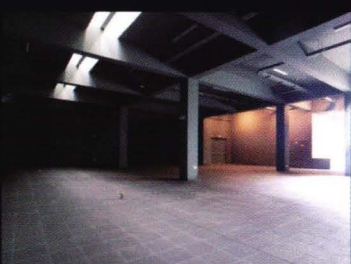
Vistas interiores del Museo Nacional Chavin.