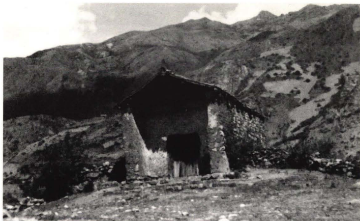
Primer Museo de Chavín, 1940.