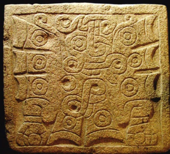
Laja grabada. Periodo Formativo.

HORARIO DE ATENCIÓN AL PÚBLICO Martes a domingo de 09:00 a 17:00 horas (incluido días feriados)