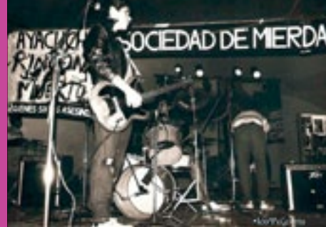
Se Acabó el Show - Leo Escoria

Autor: Carlos Torres Rotondo Editorial: Mutante, 2012