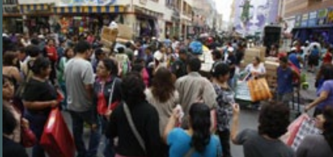
El Acorde Perdido - imagen mercado del centro de Lima