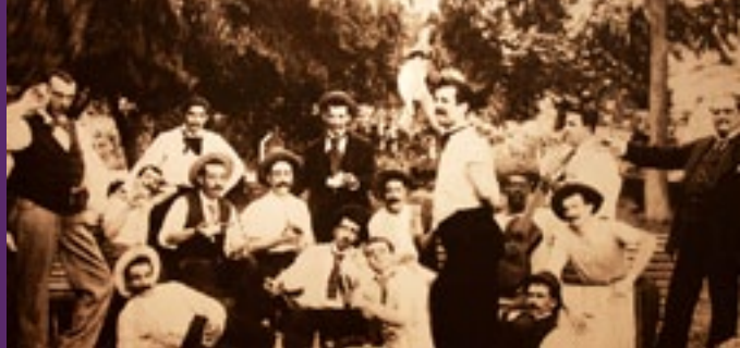
Lima, El Vals - Imagen inicios del criollismo en el Perú