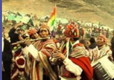
Fiesta en los Andes - imagen referencial