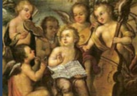
Musica Barroca del Perú - Imagen referencial