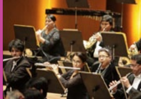
Estado de la musica en el Perú - Imagen referencial