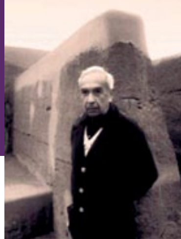
Instrumentos Musicales Peruanos - imagen de Arturo Jiménez Borja