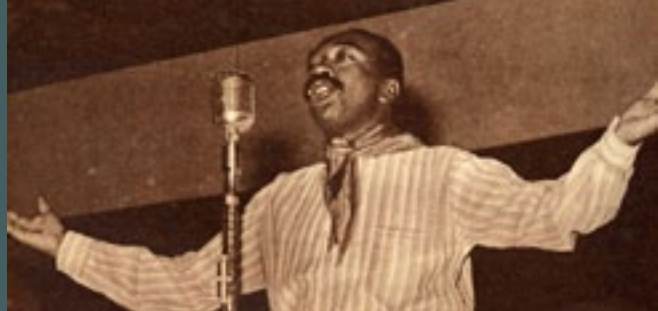
Ritmos Negros del Perú - Nicomedez Santa Cruz