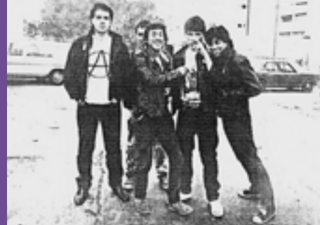
Política y Rocanrol - grupo subterráneo Ataque Frontal