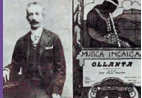
Guía musical del peru - imagen referencial - Compositor José María Valle Riestra