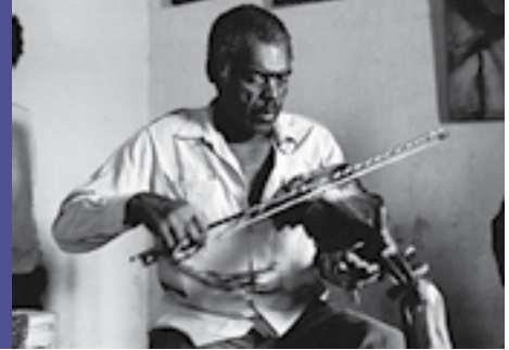
La Practica Musical de la Poblacion Negra - Músico Chincha