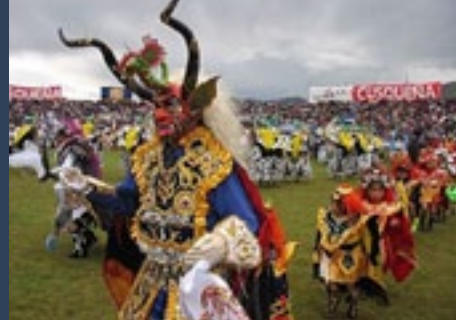
Catálogo Música Tradicional de Puno - Diablada Puno (Del blog punodanza)