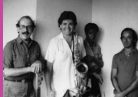
Mixtura - Perujazz, jazz afroperuano