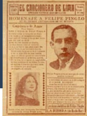
Felipe Pinglo - Homenaje - a - Pinglo - 11