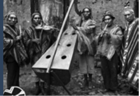
Sonidos Andinos - Imagen referencial