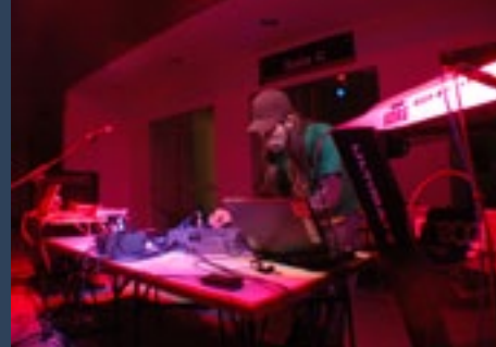
Post Ilusiones - Rapapay