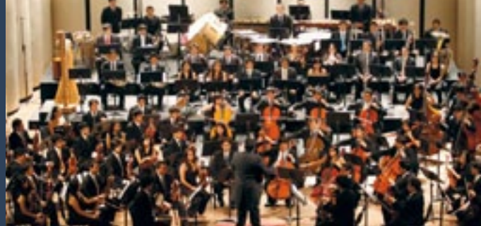
La Música Orquestal Peruana - Imagen de la Orquesta Sinfónica Nacional