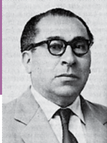
Vida Musical Cotidiana en Arequipa

Editor: Asamblea Nacional de Rectores, 2006