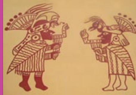
Origen de la Música en los Andes. Imagen iconografía, Mochica 2012

Editorial: Fondo Editorial del Congreso del Perú, 2007