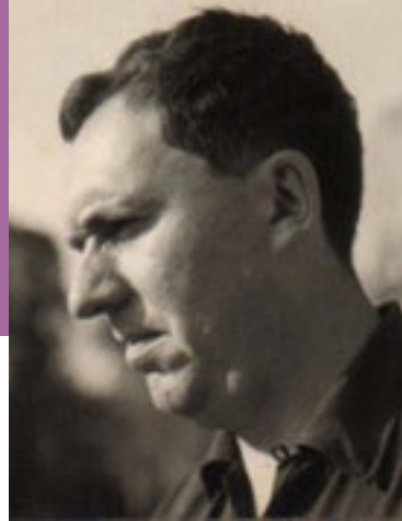
Informe Sobre la Música en el Perú - Enrique Pinilla