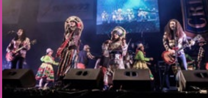
Foto: Cholos Incas- Grupo Uchpa