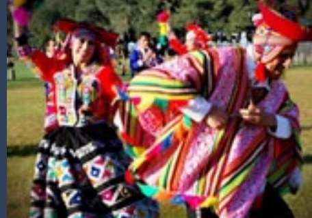
Foto: Cosmología en los andes - Huaynos