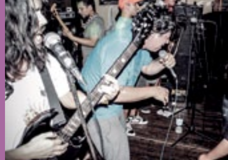
Reflexiones acerca de las escenas musicales alternas - Puramer-K