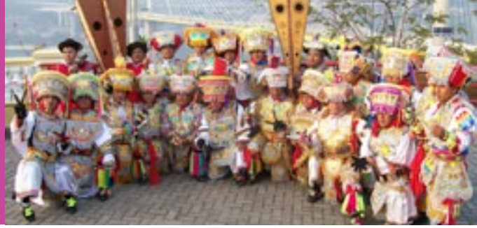
La Danza de Tijeras y el Violín de Lucenas