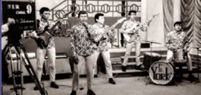
Demoler - Los Yorks