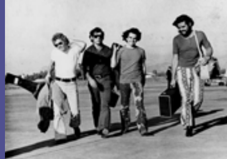
Porqué se fue - Traffic sound