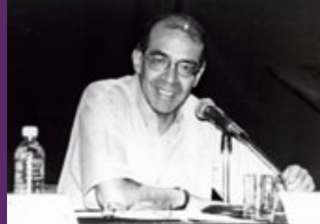
Nuevos Compositores en el Perú - Aurelio Tello