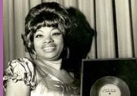
El Pirata - Lucha Reyes