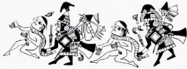
Fig. No. 252 - La danza de las guameas mochicas concluyendo prisiónes. Nótese los atuendos, los arcos y los demás utensilios. Museo Arqueológico Rafael Larco Herrera (1953)