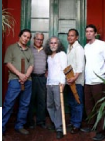
Fusión Banda Sonora - El Polen