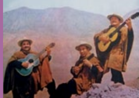
Nuestra Música y sus Interpretes - La Lira Paucina