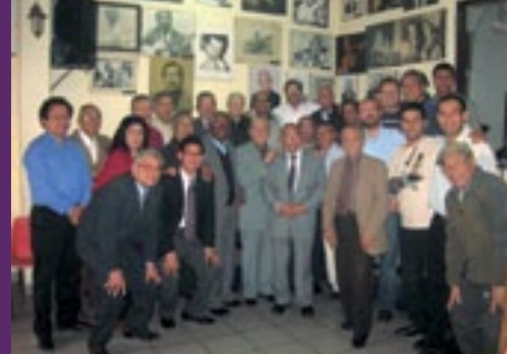
Centros Musicales de Lima y Callao (La catedral del criollismo)

EN: “LA LIMA CONTEMPORÁNEA. EL CASO DE LA CATEDRAL DEL CRIOLLISMO EN EL CONTEXTO DE LOS CENTROS MUSICALES Y PEÑAS LIMEÑOS”.