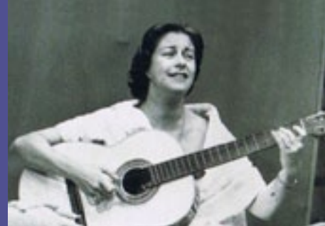
Musica Popular en Lima - Chabuca Granda