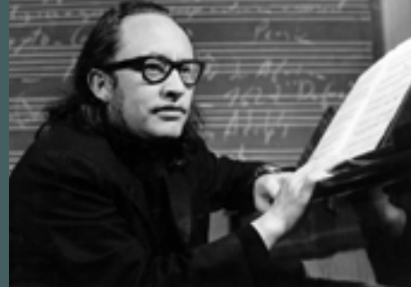
Tradición y Modernidad - Imagen Edgar Valcarcel